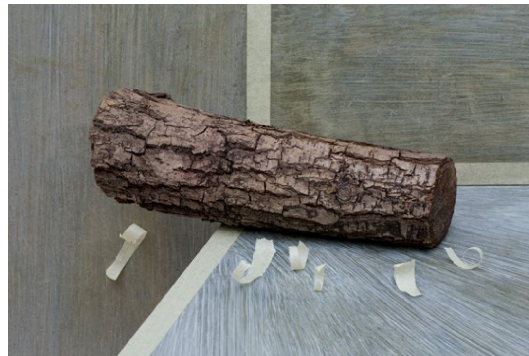
Double room, 2008 / archival pigment print 35 - 45 cm