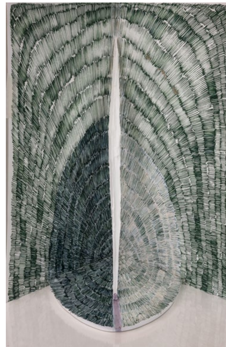
W24, 2016 / archival pigment print 88 - 56 cm © Ilona Plaum