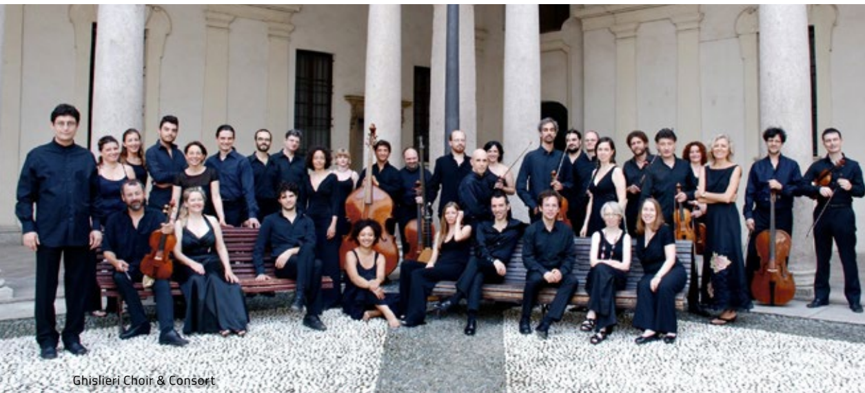
Ghislieri Choir & Consort