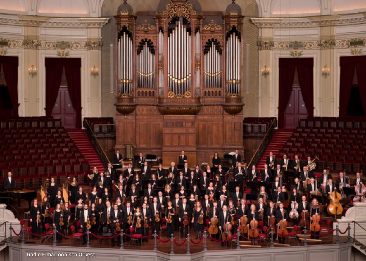
Radio Filharmonisch Orkest