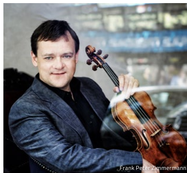
Frank Peter Zimmermann

De Tsjech Bohuslav Martinů groeide op in een kerktoren. Van daaruit bracht hij het tot een internationaal gewaardeerde componist met een onwaarschijnlijk groot oeuvre. Wie door de bomen het bos wil zien vindt daarin meesterwerken als het Tweede violconcert . Antonín Dvořák schreef met zijn Achtste symfonie een juweel waarin zijn bewondering voor Johannes Brahms onomwonden tot uiting komt. Wellicht verlegde hij om die reden zijn horizon daarna naar de Nieuwe Wereld, waar zijn Negende werd geboren. Het eclatante succes van dat werk had hij gemakkelijk kunnen evenaren. Maar Dvořák besliste anders. Hij wilde net zo beroemd worden als zijn collega's Verdi en Wagner. Dus stopte hij met het componeren van symfonieën en wierp zich met nieuwe energie op het schrijven van opera's. In de tien jaren die hem nog restten ontstonden drie opera's, maar helaas is er slechts één die zich – met moeite – in het grote repertoire heeft weten te handhaven: Rusalka . Een prachtwerk dat al meer dan een eeuw om een suite schreeuwt. Die bede werd verhoord door dirigent Manfred Honeck. - SR