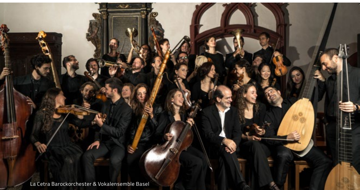
La Cetra Barockorchester & Vokalensemble Basel

Het verhaal – geschreven naar een prestigieus en veelgebruikt libretto van Metastasio – lijkt complex, maar is eigenlijk een variatie op twee liefdesparen die kruisgewijs verliefd op elkaar worden. Een complicatie is er wel. In het oude Griekenland vinden de Olympische Spelen plaats. De belangrijkste held weet dat hij die nooit kan winnen en vraagt zijn beste vriend om dat in zijn naam te doen. Maar wie krijgt nu de mooie dame die als hoofdprijs is bedacht? Om de Venetiaanse elite van zijn kunnen te overtuigen maakte Vivaldi gebruik van modieuze virtueuze aria's in Napolitaanse stijl, onder andere gezongen door twee castraten. Maar het authentieke Venetiaanse muziekdrama bleef hij trouw. - WB