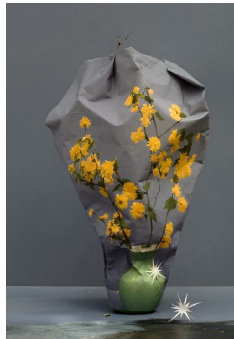
Horizon as reproduction (10)_sacha, 2009 / archival pigment print 70 - 48 cm / © Ilona Plaum