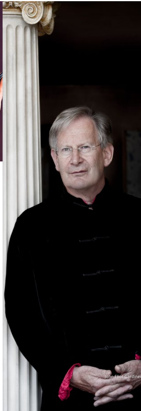
John Eliot Gardiner