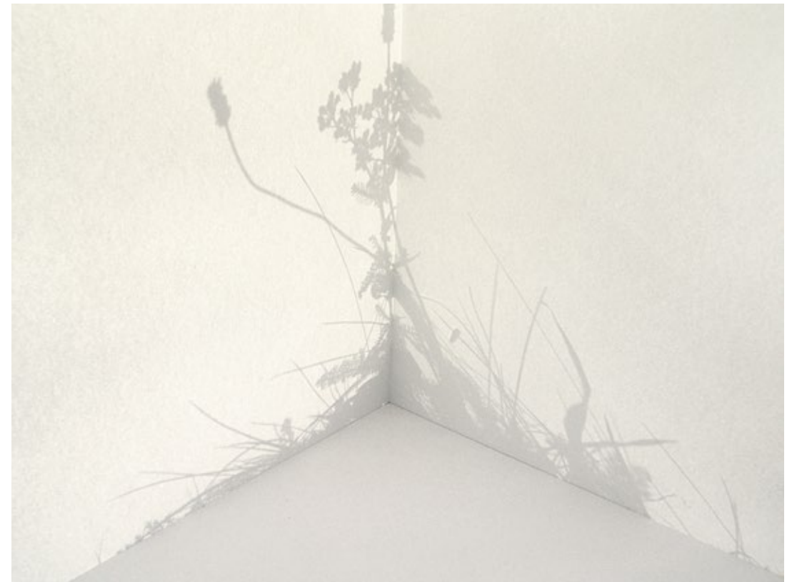
Corner silhouette, 2005 / archival pigment print 33 - 45 cm / © Ilona Plaum