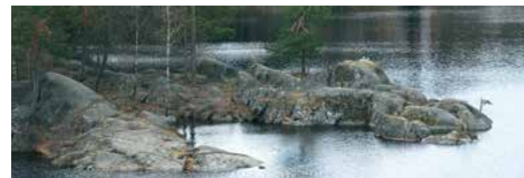
Exponerade badklippor vid Gömmaren