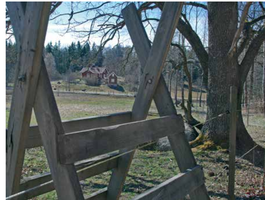
Kulturmarker vid Fullersta kvarn

Glöm inte att kika på den udda runan vid kvarndammen. "Färväl du kära fosterland 1872 August" - en av de många som tröttnade på nödären och sökte bättre lycka på annat håll i världen.