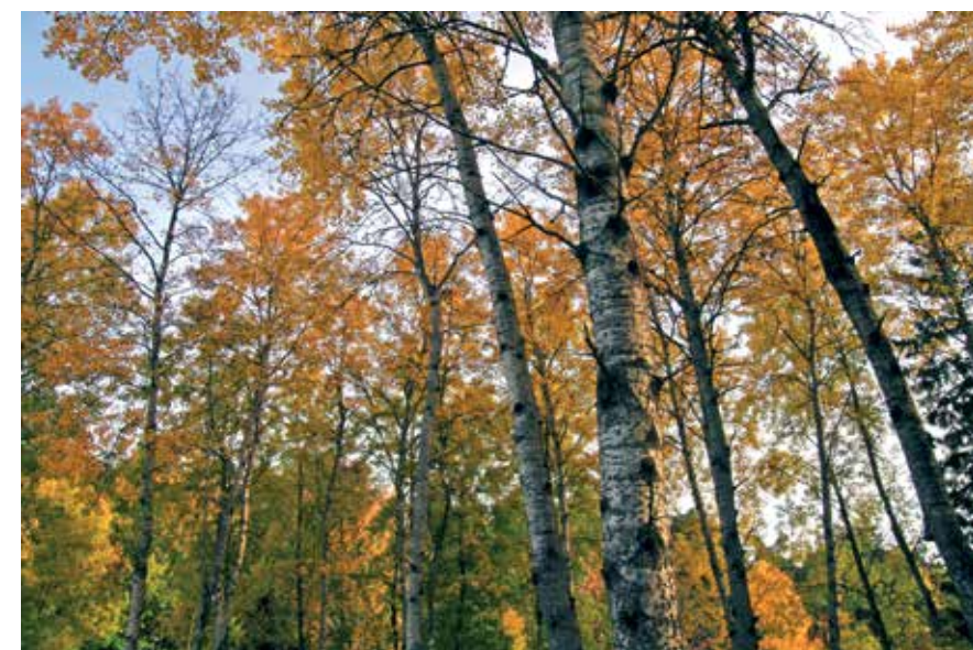
Höstaspar vid Långängen

För att uppleva ekskogarna får man söka sig till platser med kulturmarker vid Fullersta kvarn och Långängen. Särskilt vid Långängen finns mycket ek och ett stort inslag av hassel. Vårfloran i detta område är mycket vacker med mattor av vitsippor. Här finns även inslag av asp, sälg, klibbal, lönn, lind och våra björkar, vilka ger Gömmarområdets skog sin variation.