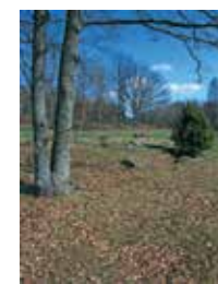
Vår vid Långängen