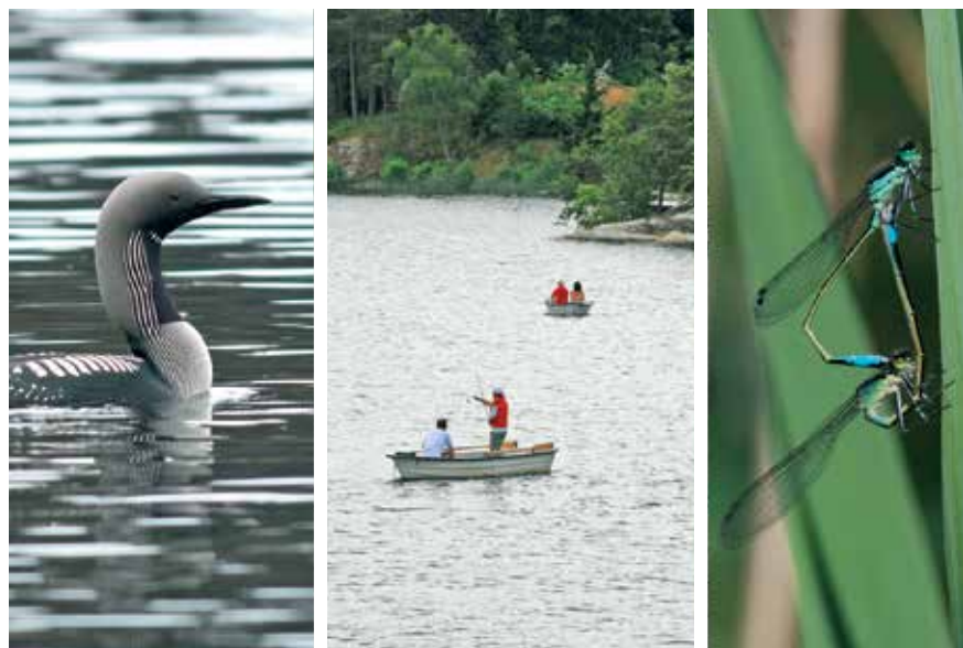
Sjön Gömmaren med storlom, sportfiske och större kustflickslända

En sevärd fågel som regelbundet häckar i sjön är storlommen. Den tillhör sommarens tilldragelse när kvällar och nätter fylls med dess speciella sång. Ljudet av storlom ger verkligen sjön sin vildmarksprägel. Den kraftfulla fiskjusen ses ofta spana efter fisk. Högt över sjöns vattenspegel flyger den och spanar efter byten med sin knivskarpa blick. Med lite tur kan man se fågeln störtdyka ned i vattnet och gripa någon fisk med sina klor.