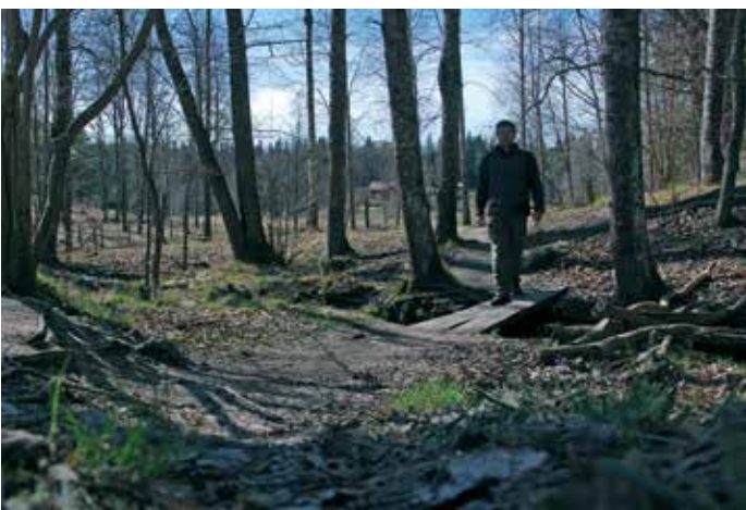
Vandring vid Fullersta kvarn

Kartunderlag baserat på orienteringskarta Gömmaren uppdaterad 2007 och producerad av Snättringe SK och Skogsluffarnas OK