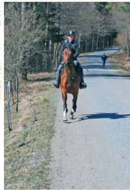
Ridning i naturreservatet