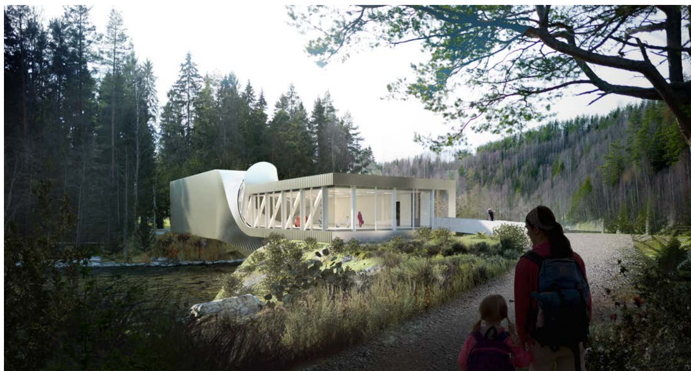
Den nye kunsthallen "Twist" plassert over Randselven.