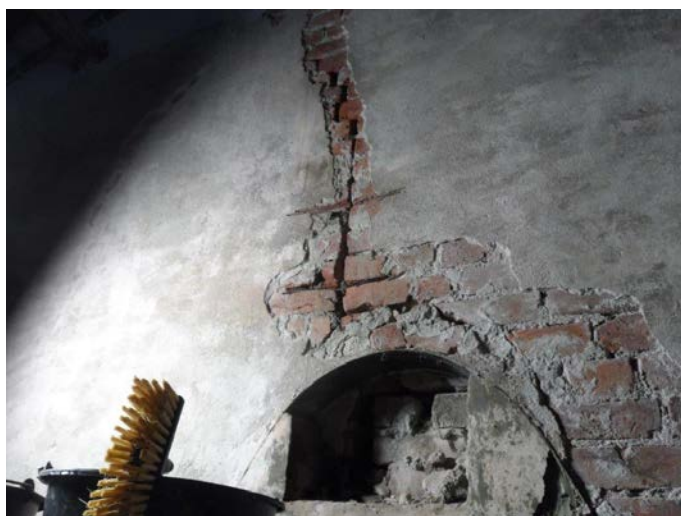
Bilde viser revne i teglsteinsvegg i Renseriet.

Museet har i 2017 ansatt murer som i tråd med antikvariske restaureringsprinsipper skal vedlikeholde alle de gamle mursteinsbygningene.