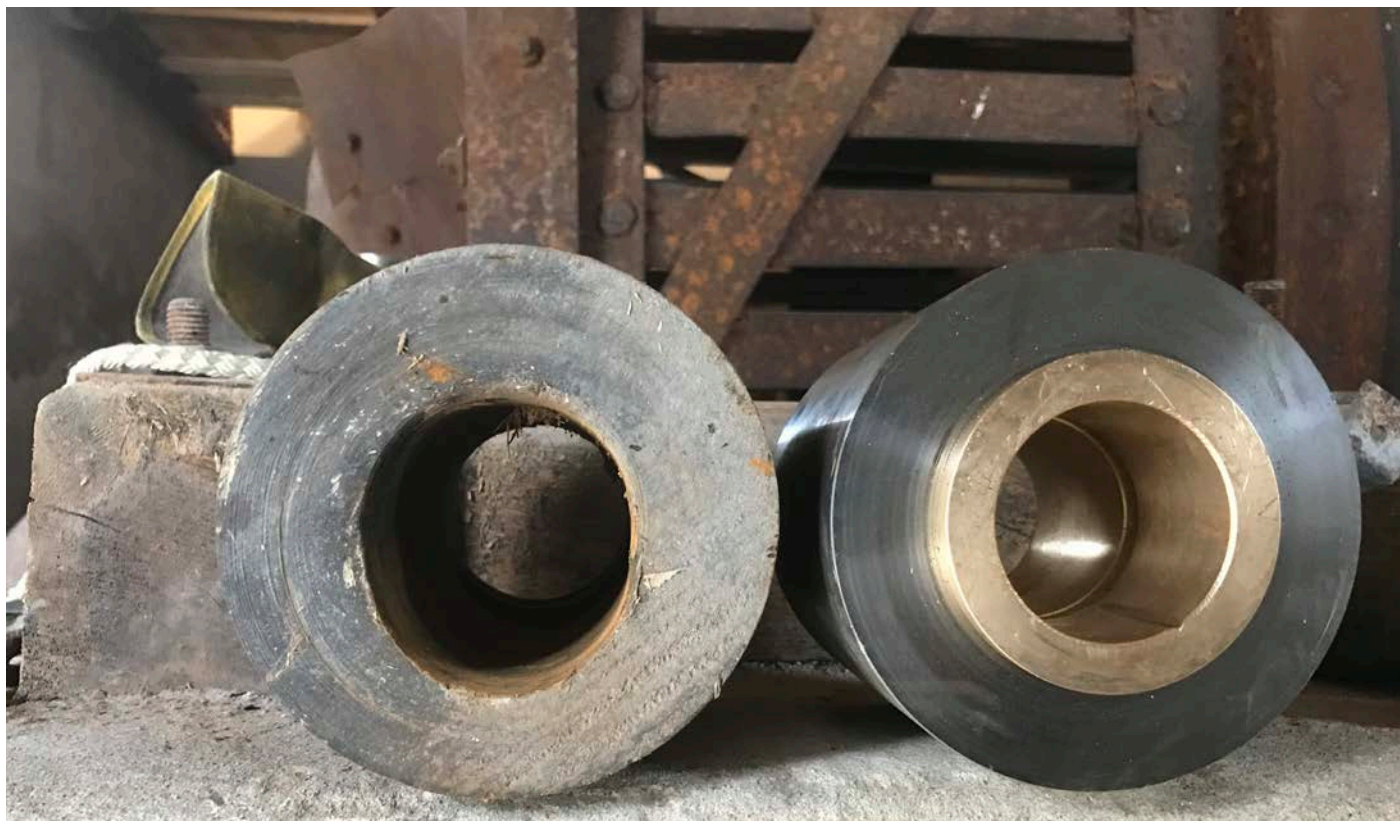
Bildet viser gammel og ny opplagring for barketrommel.

Ifm. vedtatt reguleringsplan har Riksantikvaren og museet i fellesskap etablert en hensynssone rundt bygninger og anlegg, for at bygninger og anlegg bygget før 1955 ilegges spesielle hensyn.