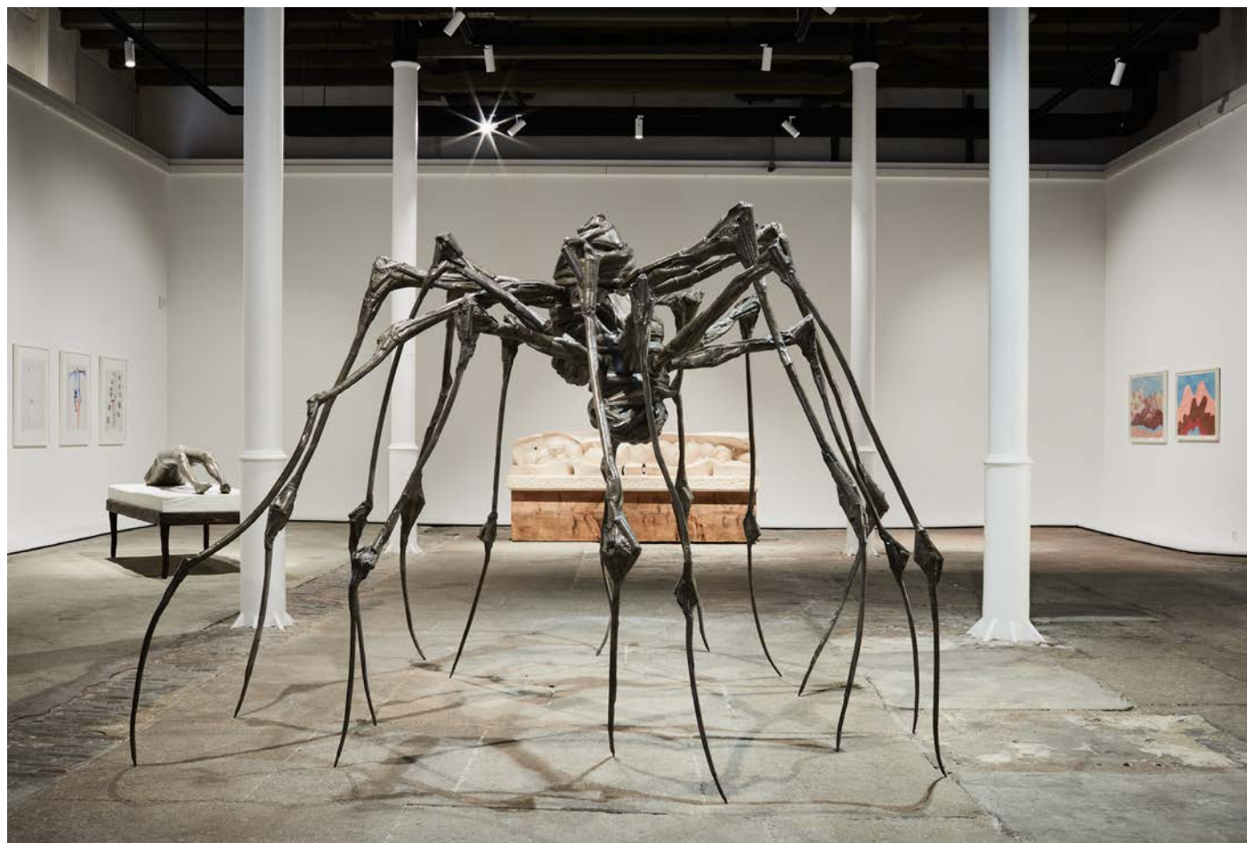
Louise Bourgeois SPIDER COUPLE , 2003.