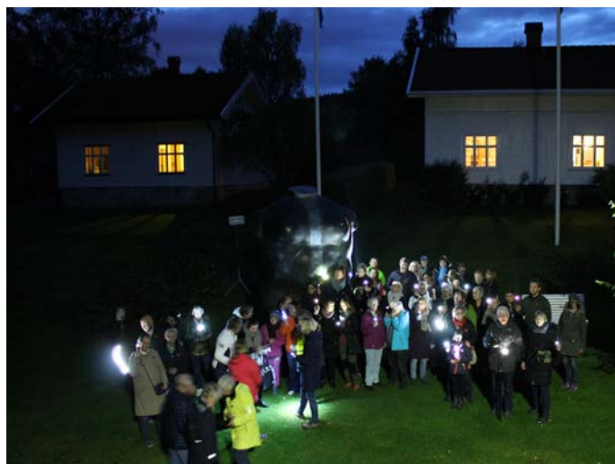
Kveldsvandring i skulpturparken 22. september 2017.

Den 22. september 2017 ble det arrangert kveldsvandring i skulpturparken. Grunnet stor interesse og god påmelding ble det satt inn to guider som tok med hver sin gruppe på omvisning. Det var 54 betalende gjester på arrangementet. Kistefos-Museet fikk gode tilbakemeldinger fra deltagerne. Mange har gitt uttrykk for at de ønsker at dette arrangementet gjentas, både av de som var med den 22. september og av andre som ikke hadde mulighet til å delta ved denne anledningen.