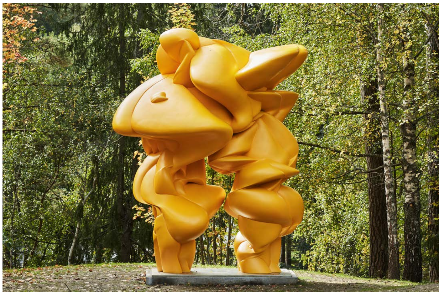
Castor & Pollux, Tony Cragg, 2017.