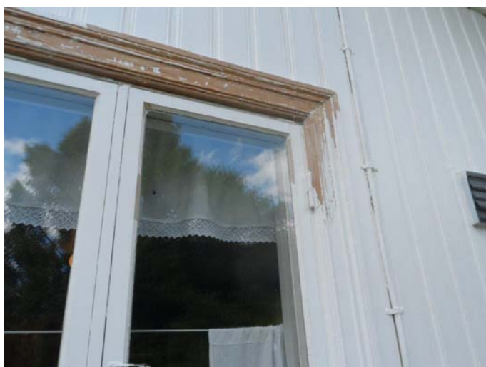
Bildet viser skrapet og pusset vindusomramming, og kittet glass i vindusramme på Reperatørbolig.