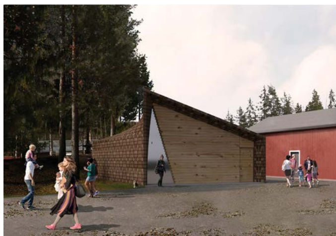
Det nye flotte toalettbygget åpnes 27. mai 2018.