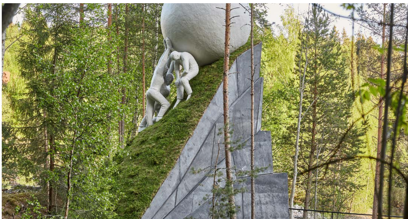
The Ball, Ilya Kabakov, 2017.

Installasjonen med sin plassering midt i naturen kan videre sees som en kommentar til menneskets relasjon til naturen. Mennesket har alltid søkt å kontrollere og overvinne naturkreftene, men gang på gang seirer naturen. Vendt mot syd blir ballen et symbol på solen i sin bane fra øst mot vest, der vi enten hjelper den opp eller holder den igjen på sin vei ned.