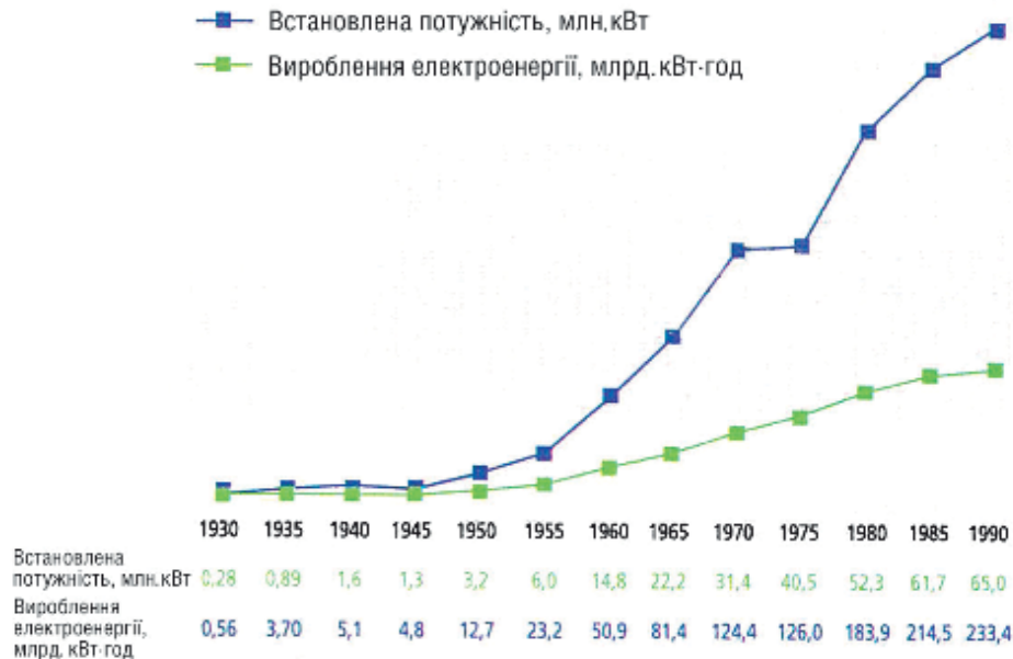
Рис. 2. Зростання встановленої потужності і виробництва електроенергії на ГЕС у СРСР

В Україні за проектами Укргідропроєкту, який на даний час став однією із головних міжнародних фірм, що спеціалізуються в інжинірингових послугах з проектування гідроенергетичних і водогосподарських об'єктів, будується Ташликська ГАЕС на р. Південний Буг потужністю 900 МВт у складі Південно-Українського енергокомплексу, куди також входить Південно-Українська АЕС потужністю 3000 МВт, найбільша в Європі Дністрівська ГАЕС на Дністрі потужністю 2268 МВт. [2, с. 236]