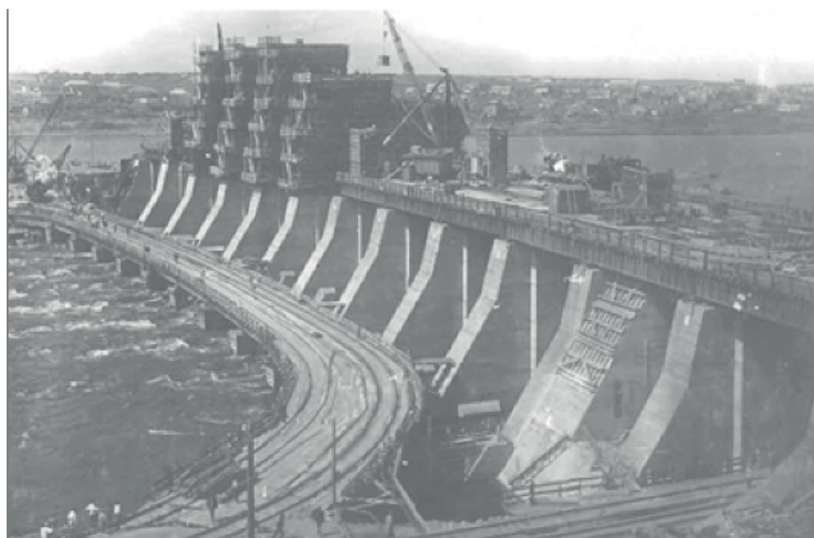
Рис. 1 Будівництво Дніпрогесу, 1930 р.

1 травня 1932 р. Дніпровська гідроелектростанція дала перший струм. Офіційне ж відкриття Дніпрогесу відбулося 10 жовтня 1932 р. 1 травня 1933 р. через трикамерний шлюз пройшов перший пасажирський пароплав «Соф'я Перовська». Так відкрилося наскрізне судноплавство Дніпром. Проте лише 16 квітня 1939 р., з пуском дев'ятого гідроагрегату, був повністю завершений монтаж устаткування і станція вийшла на проектну потужність – 560 тис. кВт [15, с. 34]. У період до 1940 р. були введені в дію такі великі ГЕС як Дніпровська, Нижньосвірська, перші ГЕС на р. Волзі.