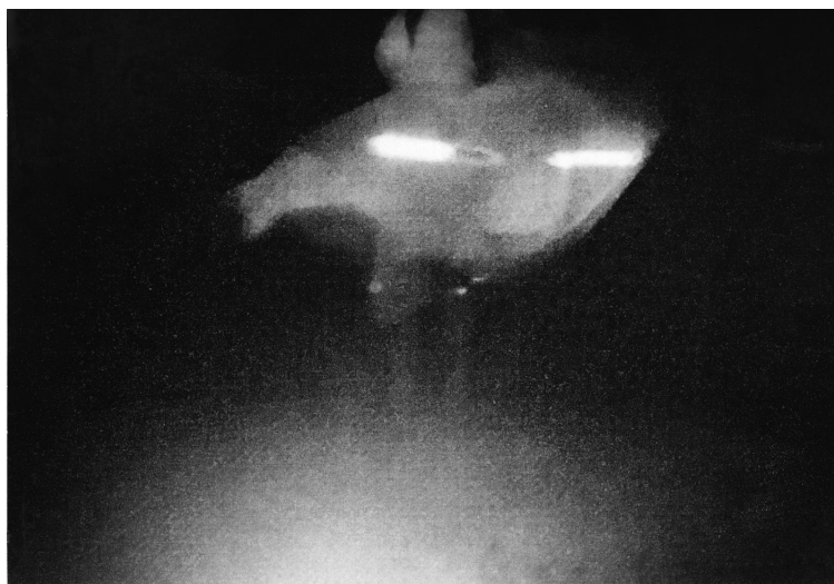
Tokyo Rumando "S" (#05), gelatin silver print, 2018 ©Tokyo Rumando