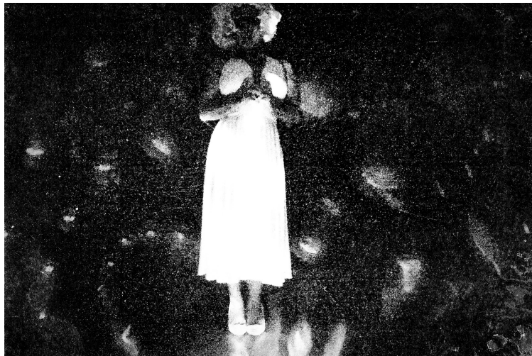
Tokyo Rumando "S" (#04), gelatin silver print, 2018 ©Tokyo Rumando