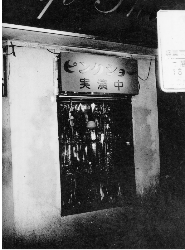
Tokyo Rumando "S" (#01), gelatin silver print, 2018