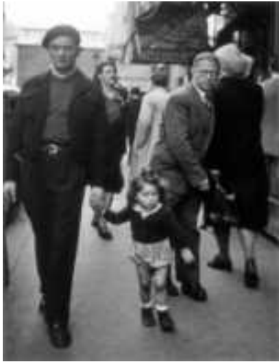
Jean-Paul Sartre, Paris, 1950