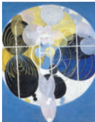
Hilma af Klint: Nyckeln, ur serien De stora figurmålningarna, 1907