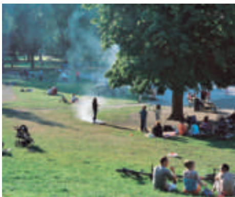
Knut Åsdam: Utan titel (Filter City), 2004