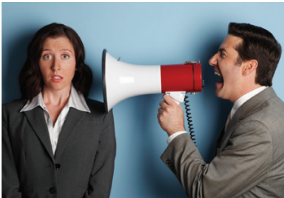
Når ord og uttrykk brukes for ofte, mister de gjerne sin kraft. Vi blir rett og slett tutet ørene fulle av dem.