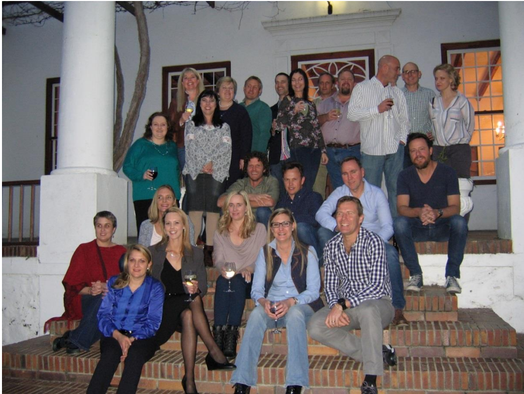
Matrieks 1992 hou hul reünie by Welgemeend