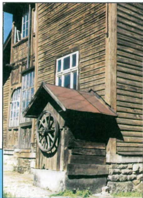
III nagroda - Dorota Kolbon