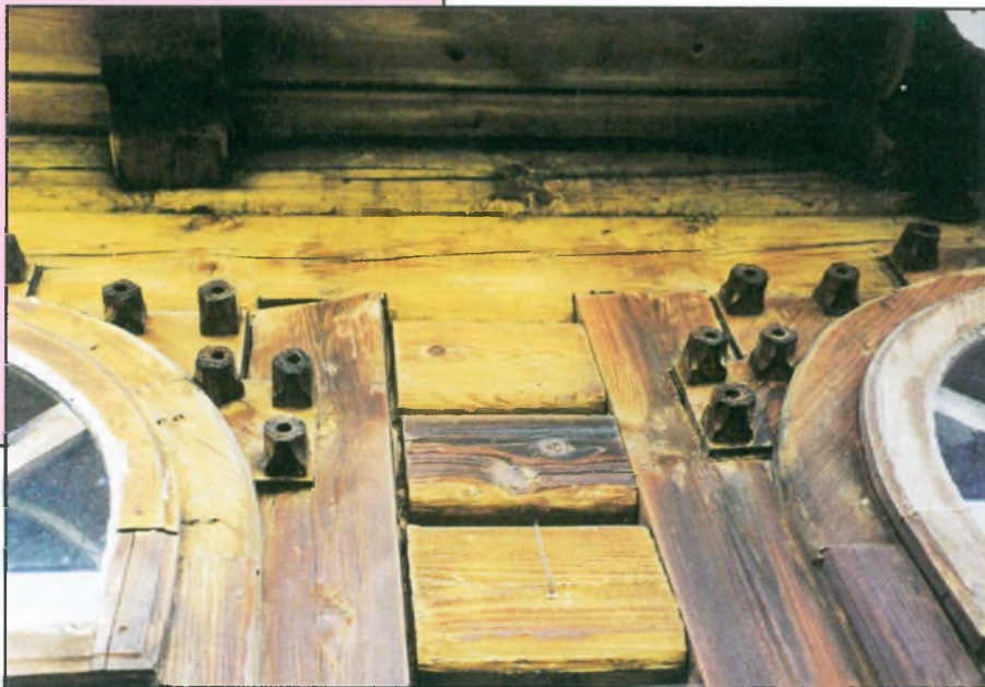
I nagroda - Krystyna Łotek