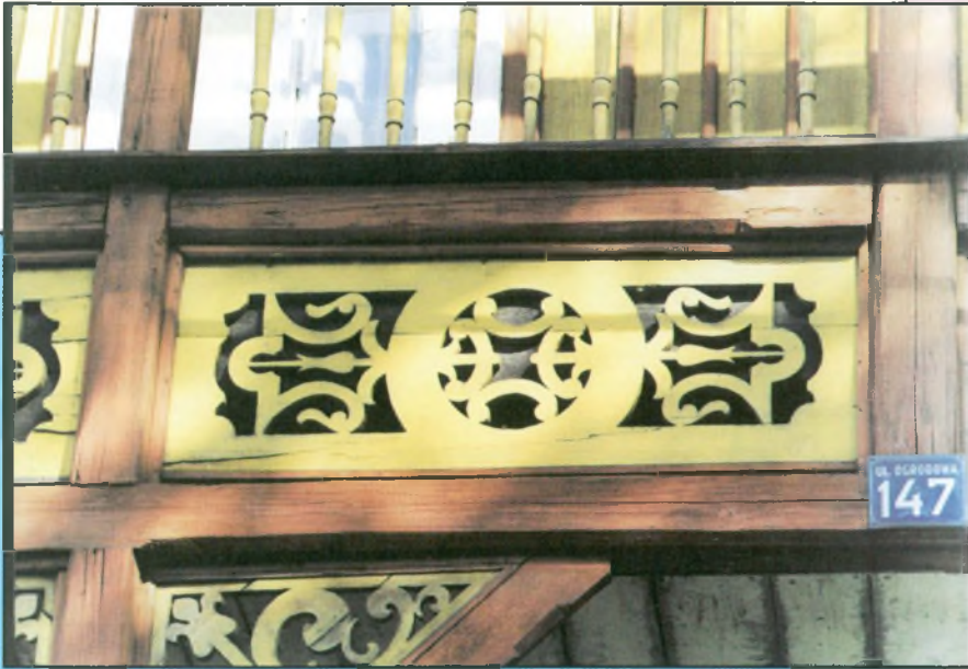
I wyróżnienie - Piotr Basałyga