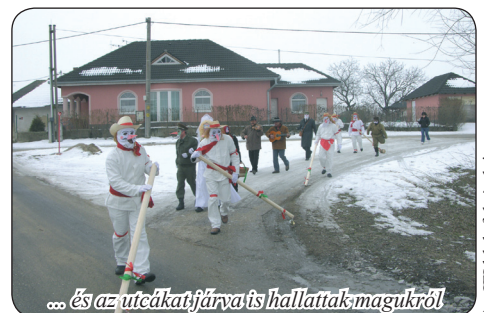
... és az utcákat járva is hallatták magukról