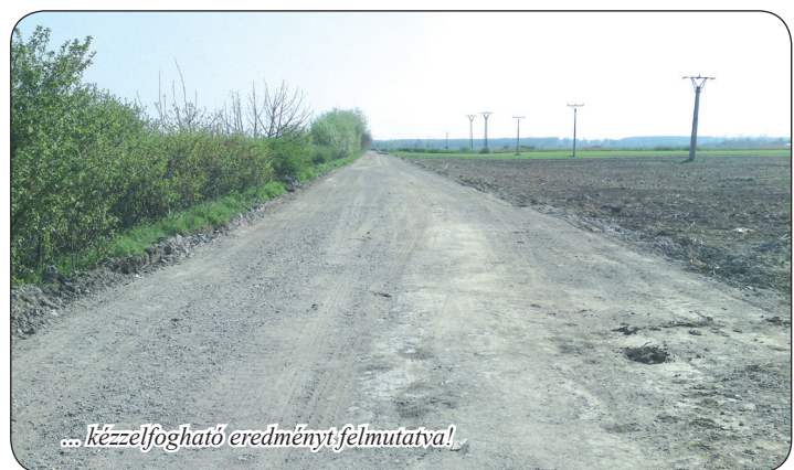
... kézzelfogható eredményt felmutatva!