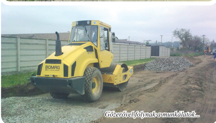
Gőzerővel folynak a munkálatok...

Aztán jött az utolsó, sikert hozó lehetőség. A község egy új betonút tervdokumentációját készítette el, s a gazdasági minisztériumhoz nyújtotta be pályázatát. Ez utolsó törekvésünket siker koronázta, s mintegy 427 ezer eurós (12.863.802 SKK) vissza nem térítendő pénzügyi támogatást kaptunk a minisztériumtól az út megépítésére. Így egy alapjaiban is teljesen új betonút kerül megépítésre a szomolai elágazástól egészen az ún. ipartelepi letérőig, mintegy 1,3 km hosszúságban. Csiszolt, C3 típusú betonútról van szó, amely reményeink szerint július végéig el is készül. Az út építésére közbeszerzés útján választottuk ki a kivitelező Profi stav