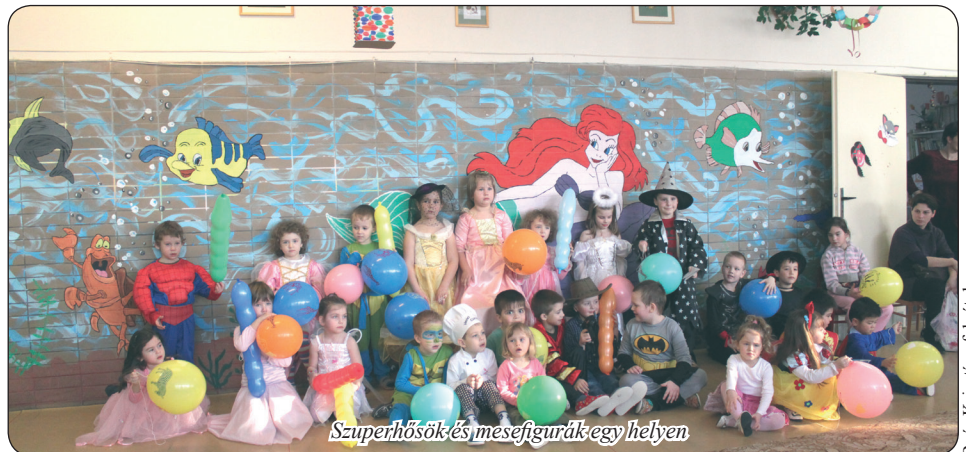
Szuperhősök és mesefigurák egy helyen