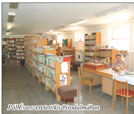
Pál Éva szeretett kis birodalmában