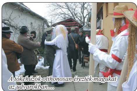
A tőkehúzókat otthonosan érezték magukat az udvarokban....

Természetesen idén sem maradhatott el a legismertebb farkasdi népszokás, amely ebben az évben február 17-re esett. Ahogy azt már megszokhattuk, hamvazószerda reggelén ismét több csapat vágott neki az utcák meghódításának. A három hagyományosan "tőkéthúzó" csoport (szilvásiak, szomolaiak, osztáliak) mellett idén először a helyi IFI Klub is összehozott egy csapatot.