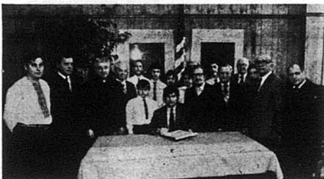
Голова повіту Ессекс Пітер Шаніро підписує прокламацію проголошуючи день 22-го січня "Українським Днем Незалежності" під час церемонії в своїй бюрі, на яку прибули члени української громади з Ньюарку і околиць.