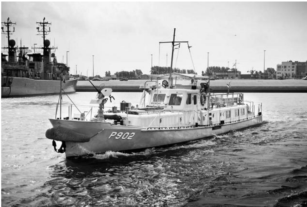
'P902 LIBERATION'

Definitief beschermd als varend erfgoed bij Ministerieel Besluit van de Vlaamse Regering van 19 november 2012