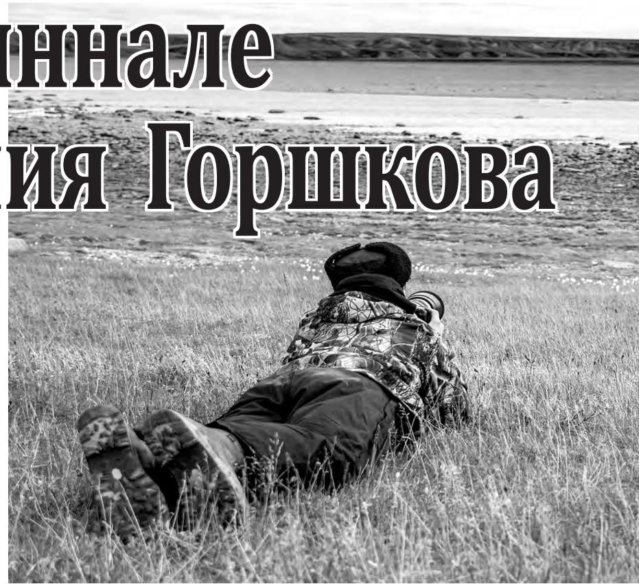
Фотоохота на овцебыка.