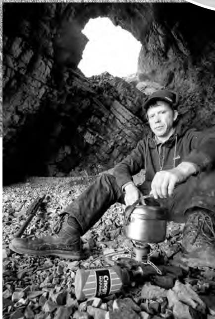
Кофе в пещере Миддендорфа.