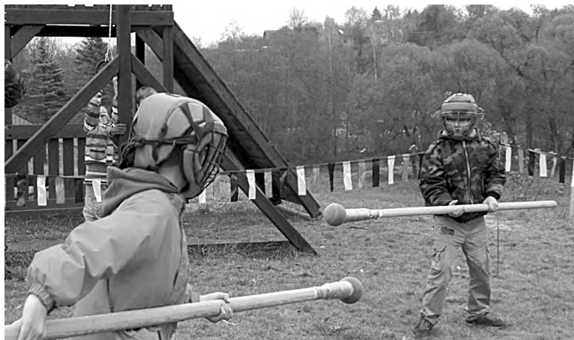
На шермициях в Кариже.

Шермиции, включающие в себя различные виды состязаний (в конной выезде, по владению