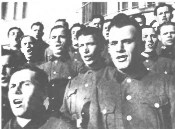
Група в Криниці. Проба хору.

Під час перебування в Криниці вояки вишколювались без крісів, але за цей недовгий час усі перейшли внутрішній вишкіл та службу, як рівнож впоряд та топографію. Хлопці, будучи свідомими свого призначення і відповідальності в ДУН, доклали всіх старань, щоб якнайкраще опанувати підставовий вишкіл, за цей час зжились з касарняно-військовим життям, тим більше, що більшість із них були колишні вояки інших армій.