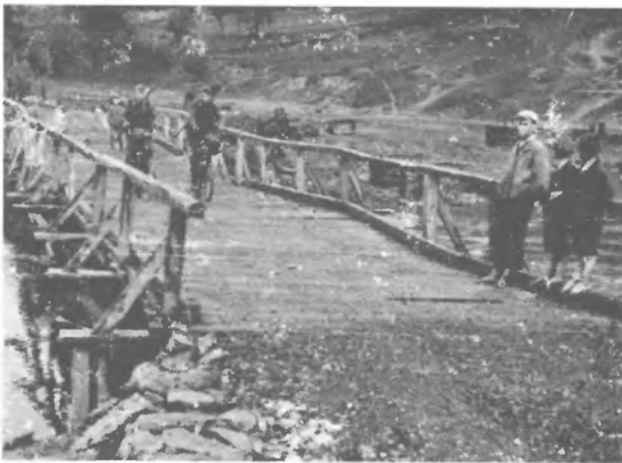
Охорона мостів. Розвідка на роверах, 4-та сотня.

Часто приходилось нашим відділам брати участь спільно з німецькими при очищенні лісів від партизан. Такі акції були небезпечними. Та поволі наші відділи почали розуміти партизанську війну. Головна сила партизан у зниканні. Зникання ворога робить його сильним, часто навіть тоді, коли у нього малі сили.