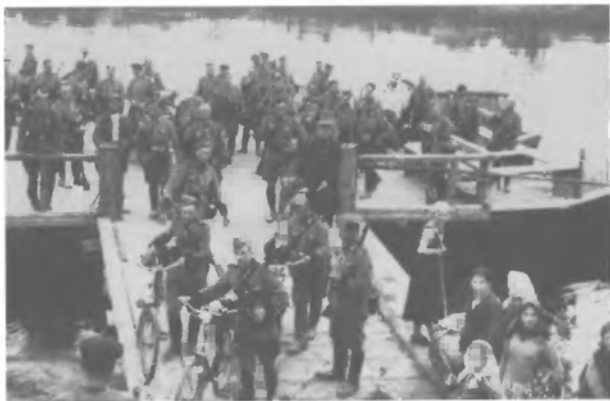
Переправа понтоном через ріку

розставлено кулемети і гранатомети. Ця фортеця стала справжньою "кількою в боці" бундючним партизанам, отже вони вирішили зліквідувати її цілком. Вони підтягнули більшу силу - 500 бійців, і заповіли цивільному населенню, що "до завтра тут нікого з фашистів не буде". Наступ почався під вечір, і завзятий бій тривав до ранку. Напасники соромно мусіли відступити з містечка, забираючи своїх численних убитих і ранених. Фортеця виявилась не до здобуття. Подібних випадків було більше.