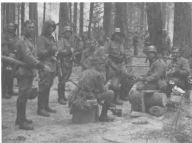
Відпочинок після зайняття ворожого табору, в околиці Вітебська.