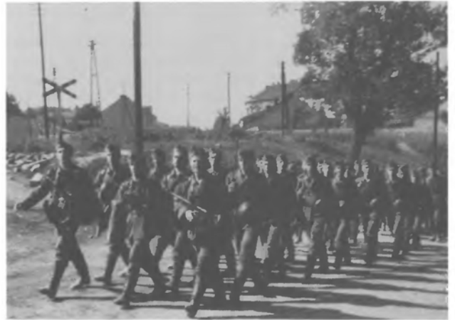
Повернення із вправ

Багато вже писалося про ту присягу, про те дуже добре знають і наші вороги, та це їм не перешкоджає у нападах і наклепах на нас просувати брехливу пропаганду, що: "Нахтігаль" 18 червня 1941 року в Радимно перед нападом на СРСР, їх капелян відобрав присягу "на вірність фюрерові і Великій Німеччині". (К. Е. Дмитрук, Свастика на суганах). Та, на жаль, і між нашими патріотами знаходяться такі, що в це вірять та ще й розносять, бо як же ж це можливо, що "їх німці годували, умундирували, озброїли і вишколили, та щоб вони присягали на вірність Україні, а не Німеччині?" Для переконання усім таким хай я наведу такий приклад.