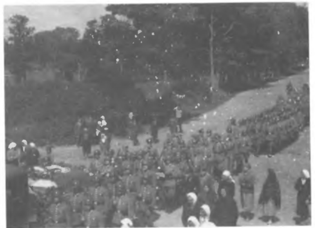
Повернення до штабу із акції. Везуть упавших друзів.

забирає своїх поляглих. Наші полягли всі. Санітарне авто догоряє. Незрозуміла нам одна річ - що полягли всі на середині поляни. Недавно переходили ми ту ж поляну з більшою силою і обминали її. Чому ж тепер переходили вони її серединою? Німці - Гоппе і другий - напереді, в сторону маршу. Чи ж би вони переконали наших, що немає чого боятись і тратити час на обминання поляни і самі заризикували йти через таку небезпечну поляну серединою? Це жахлива небезпека: всі були на поляні. Чому не обминули її - немає в кого довідатись, бо командуючі всі неживі.