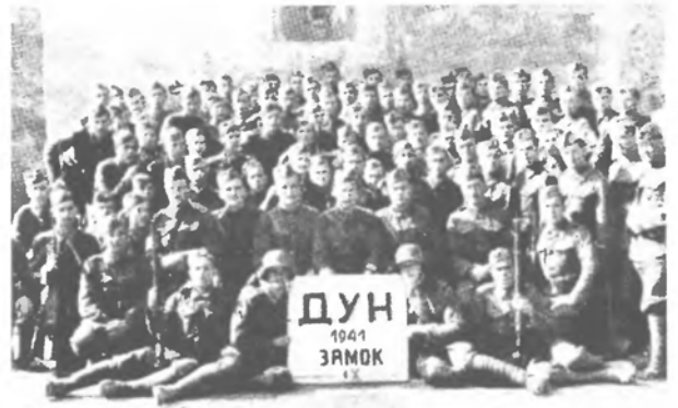
Частина Півд. Групи ДУН на вишколі в замку в За-вберсдорфі у вересні 1941 р.