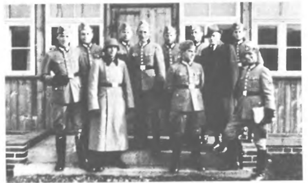
На Білорусі в штабі.

Найважчий був перший випад у багнисті лісі над Березиною. Коли кілька сотень підійшли до тих пралісів, то цивільне населення почало нас остерігати, що не перейдемо тих лісів, що там лежать дерева трьох "поколінь", повалені одне на одне, яких не можна вивезти навіть зимою. Ми увійшли в ті неперехідні ліси. Це ми вперше пішли назустріч партизанам і влізли в багна, яких досі не бачили і не знали. Зійтись мали при "В. Горі". Часто попадали по пояс у багна, часом рятував лише скок із пня на пень, чи перехід поваленим деревом. Там напевно у багатьох місцях не було ще людської ноги. Так ішли ми цілий день. Марш виключно за компасом. Такі кількадевні марші дали те, що ми ніде не наткнулись на ворога і лише набрали досвіду, як посуватись такими лісами. Отже, всупереч осторозі від населення, що то неперехідні ліси, ми таки перейшли їх.