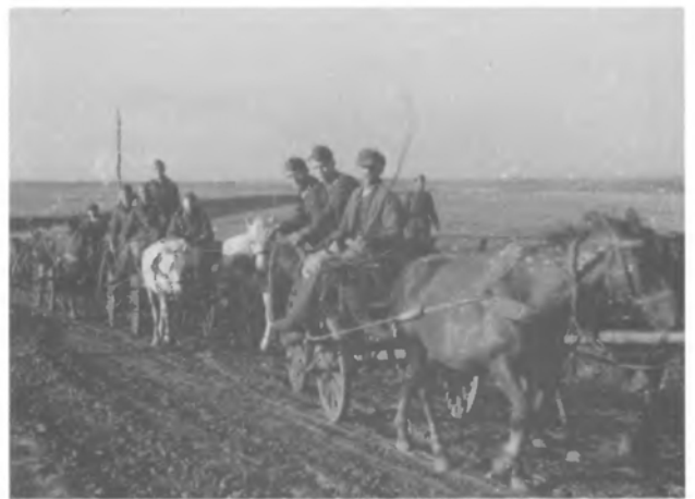
Третя "змоторизована" сотня

окопались, і почався позиційний бій. Наше завдання було утриматись до ранку, коли на допомогу мала прийти дивізія гірських стрільців.