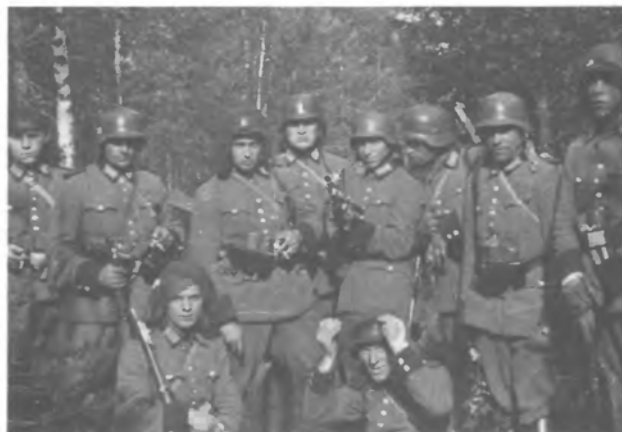
Після перечісування лісів, частина третьої чоти четвертої сотні. На шоломах спеціальні сітки проти комарів.

...Ми не мали телефонічного сполучення з штабом, а тому разом з раненими привезли перші вістку про сумну подію. Команда куреня переживає ті удари з болем душі. Тільки Моха прислухувався до нашого звітування з двозначною міною і відійшов не сказавши ні слова - не то вже потіхи чи признання, але хоч би поради щодо дальшого перебування на становищі. Та нічого дивного, він добре говорить по-польському, то й годі вимагати від нього симпатії до українців. По гутірці з мйр. Побігушим і сот. Шухевичем, які нас сердечно попрощали і підбадьорили, на дарунок - і то вояцький - вони вручили нам ще й легкий гранатомет, прекрасну зброю для нашого поземелля довкруги станиці."