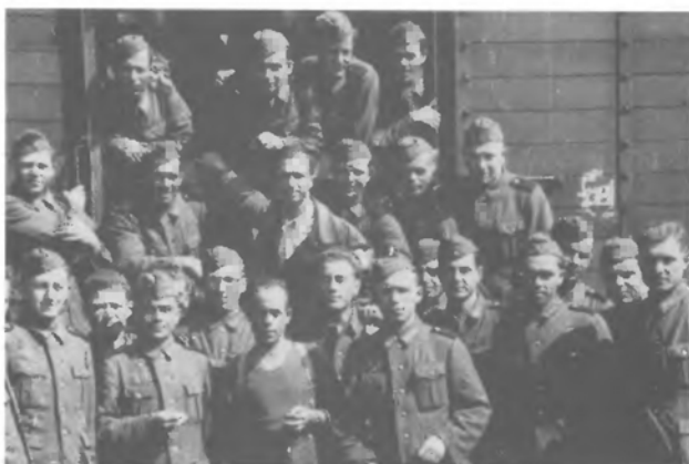
Повернення з України. Жмеринка, ладування до поїзду.