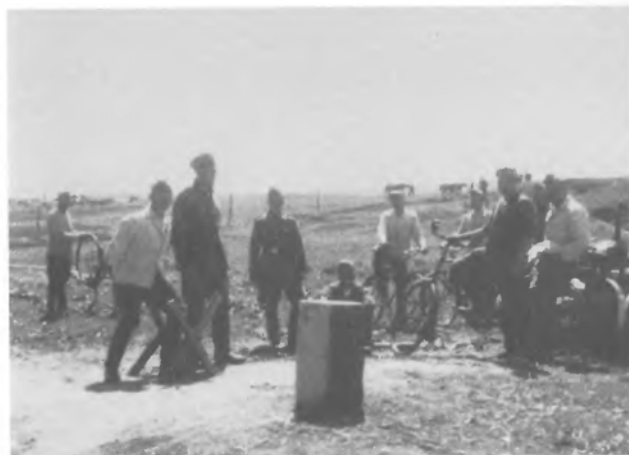
Група роверистів на розвідці