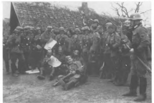
Білорусія, Бейчеково. Приготування до акції проти більшовицьких партизан.