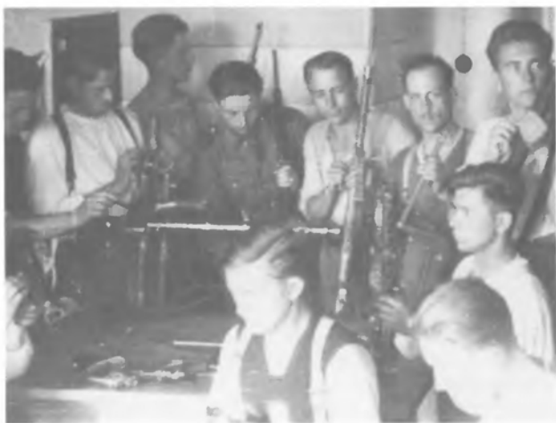
Рій з третьої сотні при чищенні зброї

Правда, усі ми були приготівані на те, що всіх нас відішлють до концентраційного табору, бо вони мали право покарати нас таким способом. На це вказувало те, що ми мусіли скласти зброю, нас відтягнули з фронту й повернули назад до Нойгаммеру. По дорозі задержали нас цілий тиждень в Кракові, бо в той час рішалась наша доля, чи залишити нас як військову одиницю надалі, чи відіслати до кацету, бо з Кракова до Освенціму не було вже далеко. Але нас перевезли назад до Нойгаммеру, пізніше до нас прилучено й другий курінь "Ролянд" та перемінено на шупполіцію. Думаю, що цього одного прикладу вистачає, щоб найбільшому ворогові українського самостійницького руху доказати правду про нашу присягу.