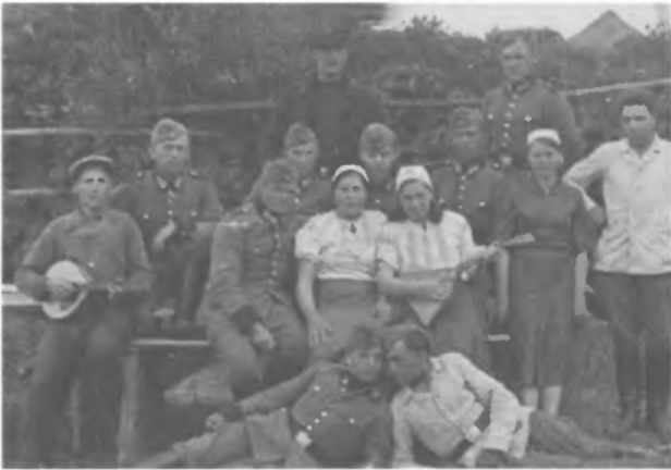
Співжиття з місцевим населенням