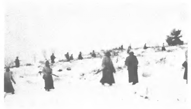
Білорусь Чота ДУН-у на розвідці