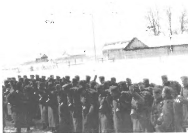
Франкфурт. Збірка до виїзду в Білорусію.

Важко описати настрій легіонерів. Це ж він був уже на Сході, і звітіля його стягнули, і знов завертають туди. Мала надія, щоб знову поїхати на рідні землі, коли саме з них легіон був стягнений.