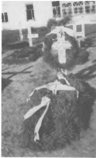
Штаб. Могили похоронених друзів.

З повищого опису читач зрозуміє, які невідрадні відносини були межі нашими стрільцями, підстаршинами і старшинами, наколи німецький командир, ме можучи дорівнювати нашим командирам під жодним оглядом, дихав до них ненавистю та часто шукав помсти. Тому не дивно, що відносини між нашим штабом і "авзіхтсоффіциром" гавптманом Мохою дуже погіршились під кінець 1942 року. Особливо завзявся Моха на майора Побігушого і сот. Шухевича. Цілі "томи" доносів на них виходили з канцелярії Мохи до штабу бригади. Справа ще більш загострилась, як сотня відмовилась виконувати наказ Мохи - асистувати панам із "Ві-Ко" (Віртшафтскоммандо) при здиранні контингенту (і то з голодного населення). Тоді сот. Шухевич заявив, що він не пошле своїм наказом жодної сотні до такої функції, тому що нас прислали сюди не грабувати, а воювати. Моха перешкодив у звільненні з поблизького табору наших полонених українців, 45 хлопців, що були забрані до совєтської армії.