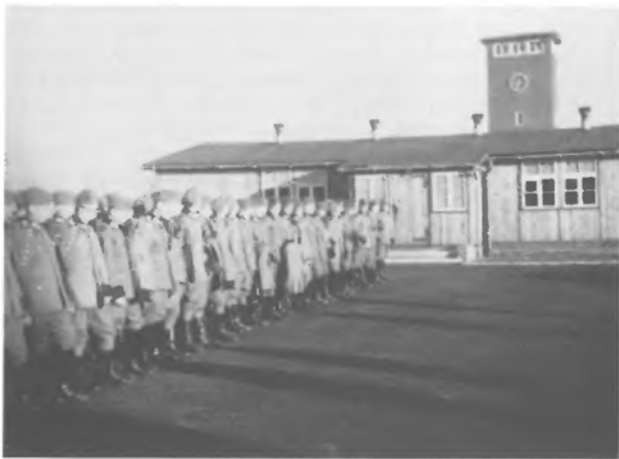
Франкфурт. - Збірка перед адміністративним будинком

Офіційна назва куреня була "Шуцманшафтбатальйон ч. 201". Кожний вояк куреня підписав особисте службове зобов'язання на один рік. Ніякої додаткової присяги не складено. До куреня призначено зв'язкового старшину - капітана поліції Моху та поліцейних підстаршин як надзорний персонал. Курінь умундировано у поліцейні зелені однострої, без ніяких відзнак.