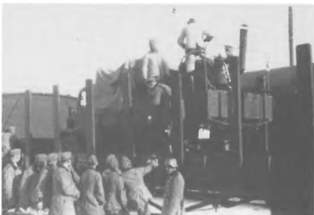
Повернення з України. Жмеринка, ладують кухні на поїзд.

Щораз більше напруженими ставали відносини з німецькими старшинами. У вечірніх дискусіях, що їх ми проводили на квартирі нашого штабового лікаря, ми одверто говорили, що німецька політика на Сході фальшива і що її продовження приведе до катастрофи.