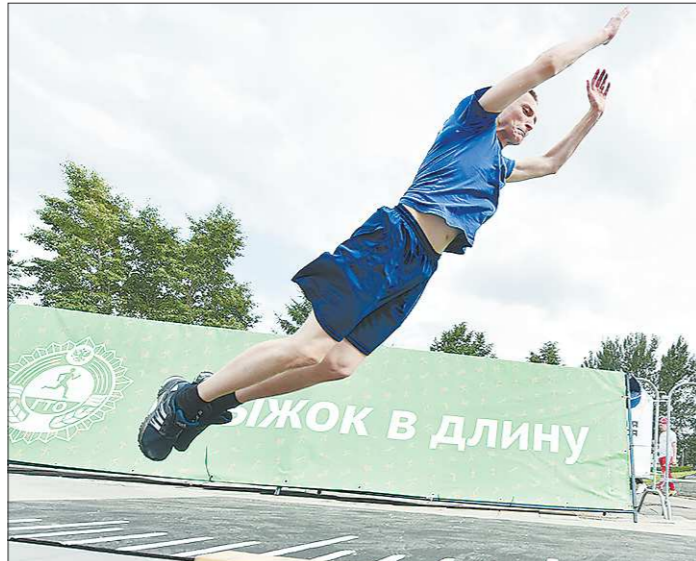
За полгода нормы ГТО сдали более 11 тысяч жителей Екатеринбурга

Достижение этих показателей планируется за счет развития массового спорта (сдача нормативов комплекса ГТО, площадки для воркаута и др.), поддержки региональных спортивных федераций (в области их 114), введения новых и модернизации уже существующих спортивных объектов.