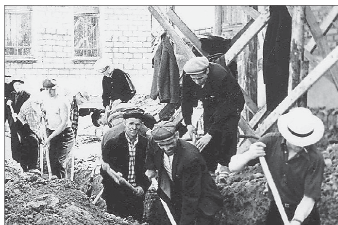
На строительстве конвертерного цеха НТМК. 1960-е годы