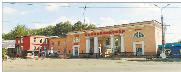
Одна из проходных завода названа в честь той самой комсомольской стройки

Более тридцати лет Центральный комитет ВЛКСМ шествовал над Нижнетагильским металлургическим комбинатом. За это время добровольцам по всей стране было выдано 15 тысяч комсомольских путёвок. Молодёжь строила дома, прокатные станы и самый первый в Советском Союзе конвертерный цех. В честь своих верных помощников тагильские металлурги назвали заводскую проходную Комсомольской.