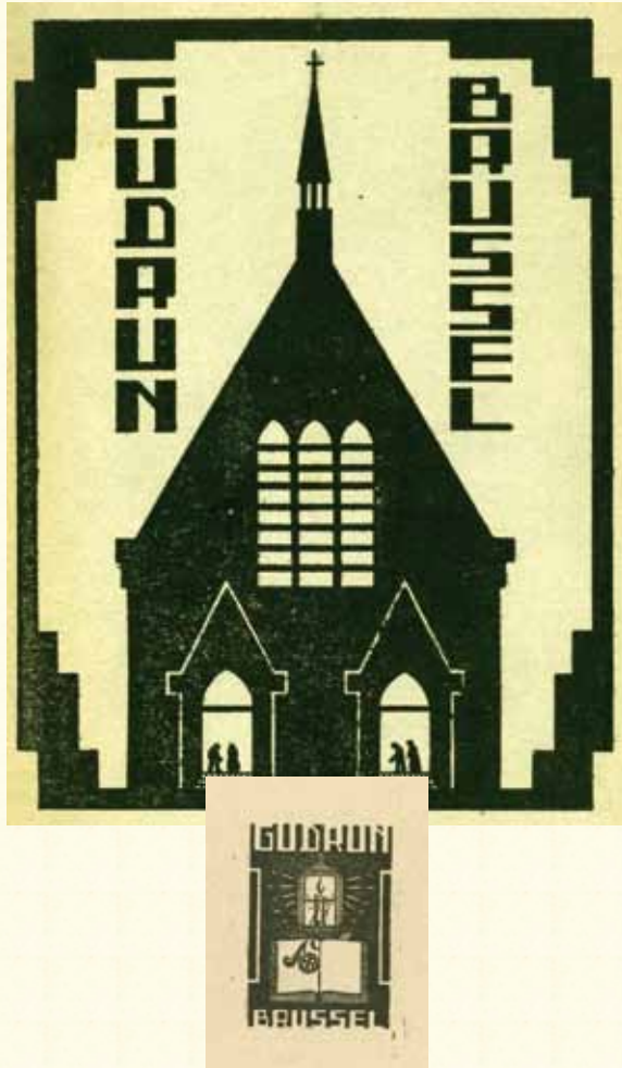
Voorpagina catalogus Gudrun Brussel en een ex-libris uit dezelfde publicatie [BE AMVB 009 II.09-17]