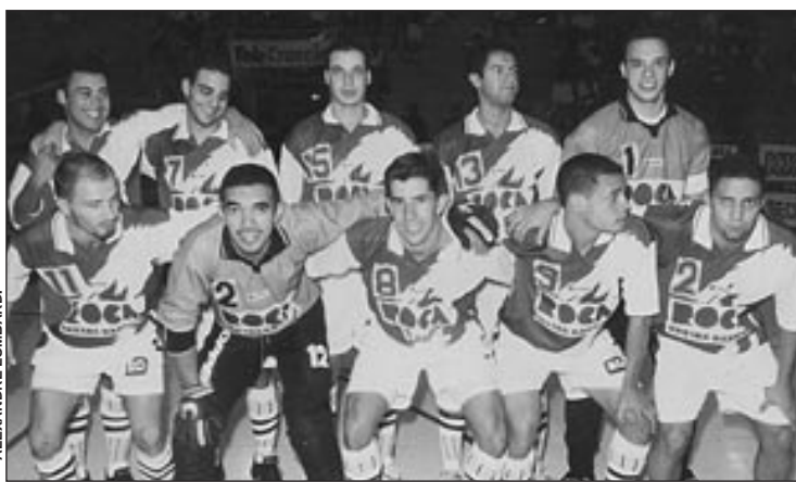
Em 2000, o título ficou com o Roca Cestas Básicas/Antonioni Buffet