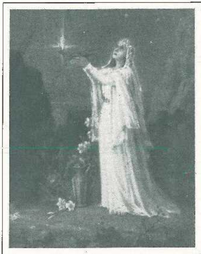
Ей, гряди, Господи Иисусе!

терпит нас, не желая, чтобы кто погиб, но чтобы все пришли к покаянию". Это ожидание возвращения Господа должно вовлечь нас в ревностное свидетельство о Нем, дабы все люди спаслись.