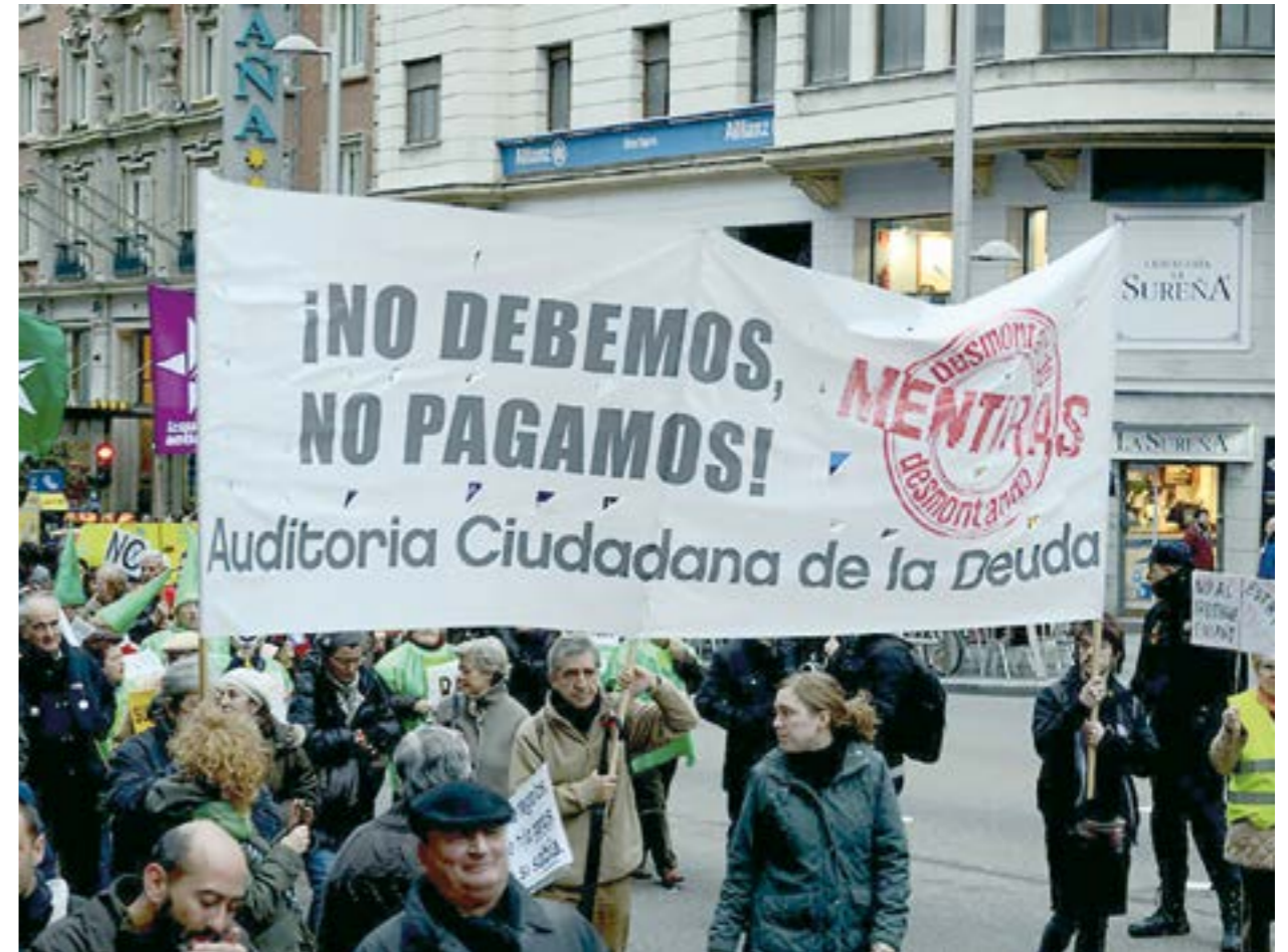
Auditar la deuda para acabar con el expolio de los recursos públicos, y determinar que parte es ilegítima y no la debemos pagar los ciudadanos. Que la paguen quienes la han generado.

Recortes Cero – Grupo Verde se compromete a: