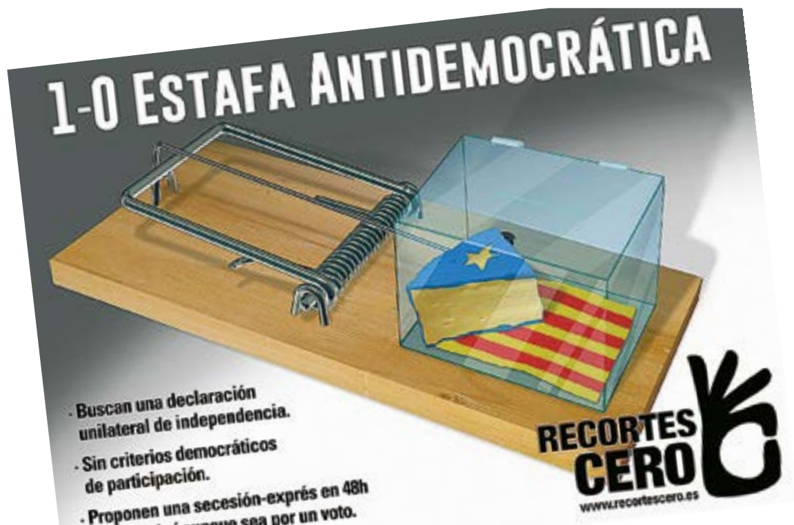
Cartel de la campaña de Recortes Cero "1-O: Estafa antidemocrática"