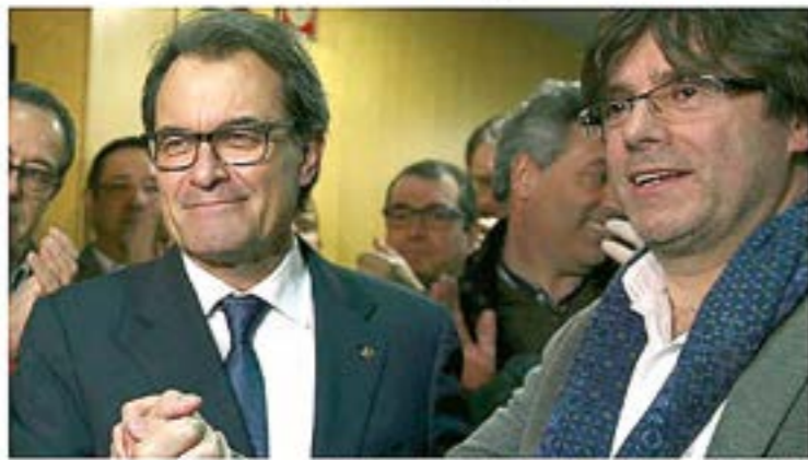
Puigdemont junto al todavía president Artur Mas, este sábado