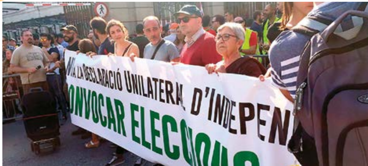
Concentración de Recortes Cero ante el Parlament de Catalunya el 27 de octubre, contra la aprobación de la Declaración Unilateral de Independencia.

el 38% del censo. Y en localidades como Hospitalet, la segunda más poblada de Cataluña, apenas llegó al 19% del censo.