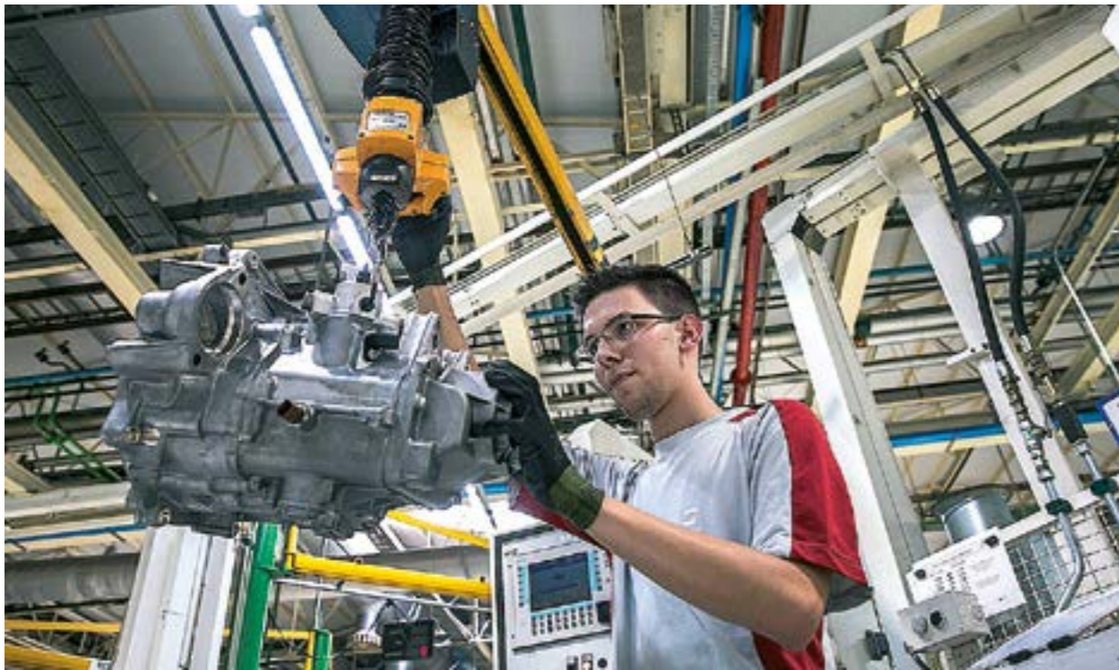
Cataluña ha perdido con la crisis tejido industrial equivalente a 14.000 millones de euros. A lo que hay que sumar el daño provocado por el "procés" y la salida de empresas.

Recortes Cero – Grupo Verde es la única candidatura que propone crear 400.000 empleos productivos y de calidad, vinculados a la reindustrialización, la innovación tecnológica y el desarrollo de las nuevas energías.