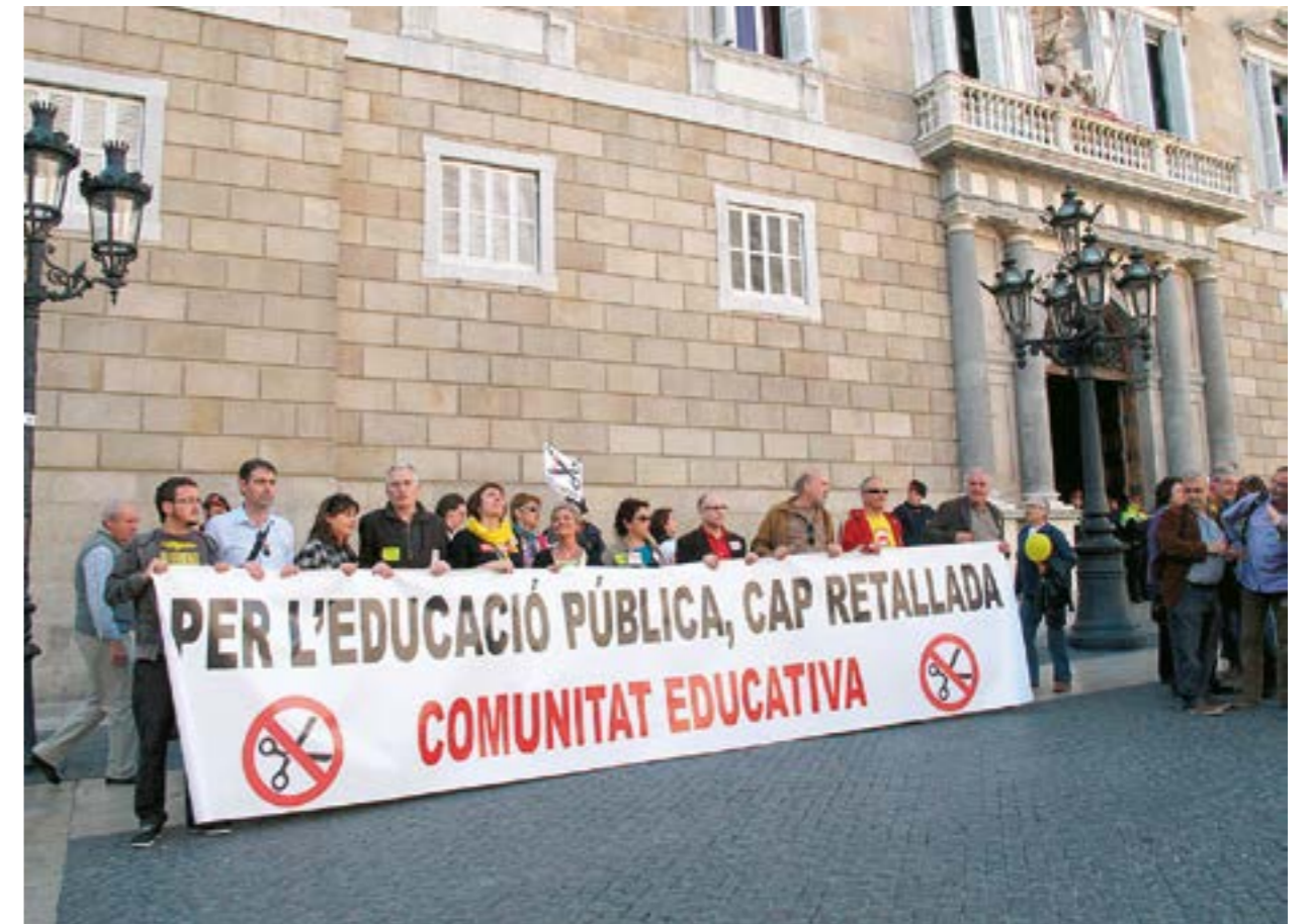
Manifestación ante la Generalitat contra los recortes en Educación.