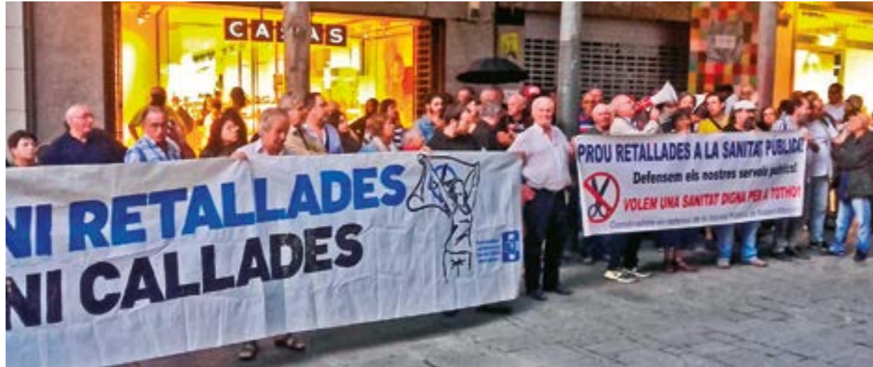
Los recortes en Sanidad han sido la punta de lanza de los recortes en Cataluña.