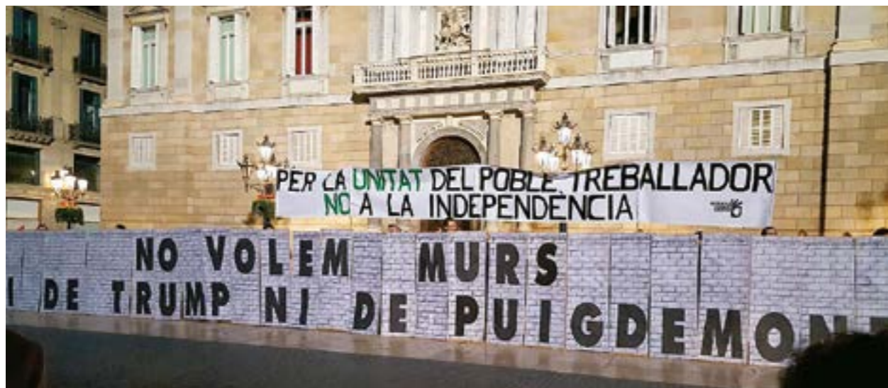
Concentración de Recortes Cero en la Plaça Sant Jaume de Barcelona, dentro de la campaña “No volem murs, ni de Trump ni de Puigdemont”

Once páginas publicadas, sufragadas con las aportaciones de los firmantes. Más de 5.000 firmas de importantes personalidades, pero también de luchadores, sindicalistas, activistas sociales y 60 organizaciones políticas y sociales.