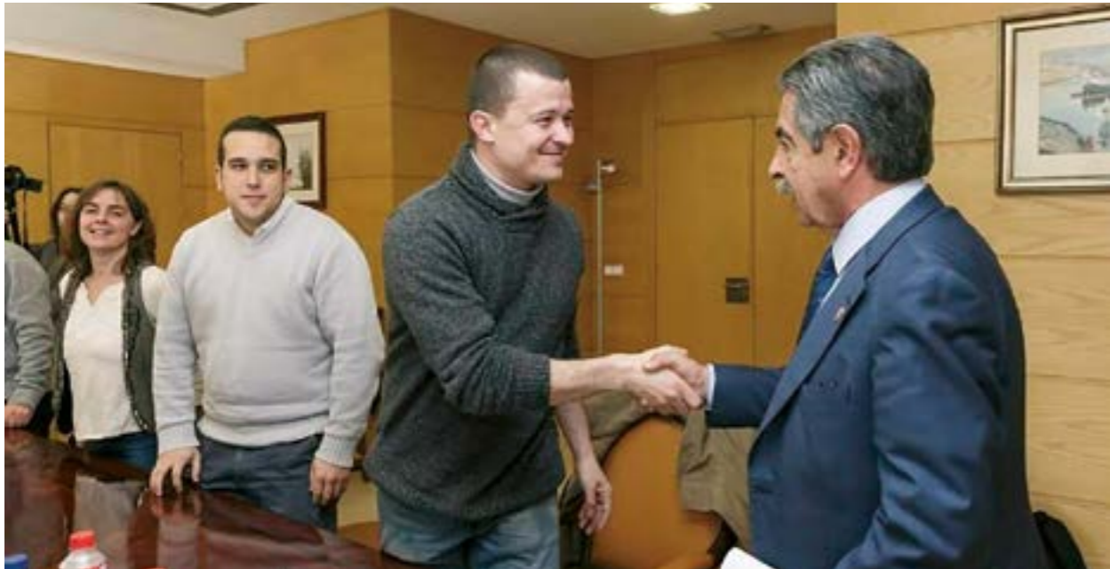
El jefe de campaña de Recortes Cero – Grupo Verde, Joanen Cunyat, coportavoz de la MERP, saludando al presidente de Cantabria Miguel Ángel Revilla en la firma de apoyo al blindaje constitucional de las pensiones.

Recortes Cero – Grupo Verde es la única candidatura de izquierdas que el 21D propone que se garanticen 1.000 euros mensuales de pensión a todos los pensionistas catalanes.