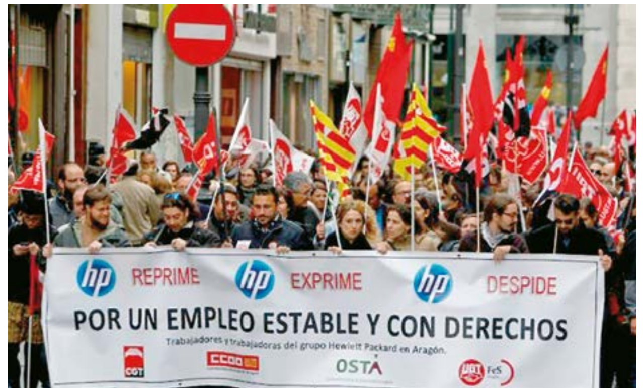
No se puede crear empleo productivo, estable, de calidad y con derechos sin invertir lo que cuesta crear empleo industrial (50.000 euros por empleo).

Queremos que vuelvan las empresas que se han ido por el "procés" y recuperar la industria catalana es el mejor camino. ■