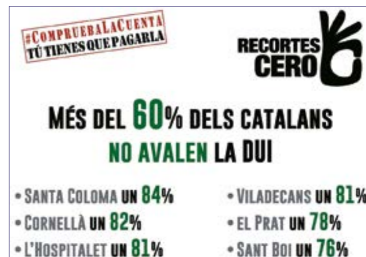
Pancarta de la campaña de Recortes Cero “Comprueba la cuenta. Tú tienes que pagarla”, desmontando las mentiras de Puigdemont y Junqueras tras el 1-O.