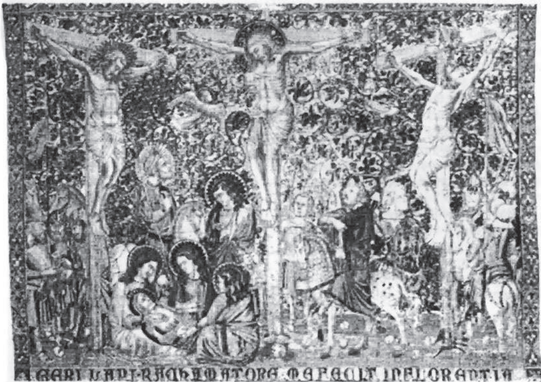
Part central del "frontal florentí" (s. XIV) fet per Geri Lapi... (Museu Històric de la Seu).

"Forum Iudicum" traduït al català, que es conserva a la Biblioteca de Montserrat, el qual, en haver estat fet el segle XII es tracta de l'escrit més antic que ens ha arribat en la nostra llengua.