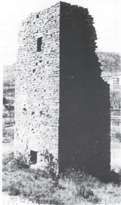
La torre dels comtals segons una fotografia de 1958.

Les seves parets no són verticals per fora, sinó una mica inclinades cap endins, inclinació que s'accentua cap a l'alçada del trespol del segon pis. Aquesta inclinació fa que el gruix, d'1,30 m. a la base, sigui de mig metre, només al cim, minva de gruixària aconseguida, a més que per la dita inclinació, per un graó que hi ha dins l'alçada del segon pis, on descansava l'embigat del trespol.