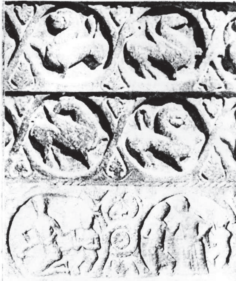
Detall del Claustre de Ripoll.

Resumint, foren dues formes de fer, i que hem volgut comentar, perquè en certa manera Suger i Bernat foren el zenit i el nadir de l'ornamentació i del simbolisme en el s. XII, i en certa manera també són els paradigmes de les dues tendències actuals relatives a la simbologia. Els Bernats que menyspreen i infravaloren el simbolisme, i els Sugers que el magnifiquen en grau superlatiu. En el terme mitjà deu haver-hi el bon camí, ... i aquest serà el que intentarem seguir.