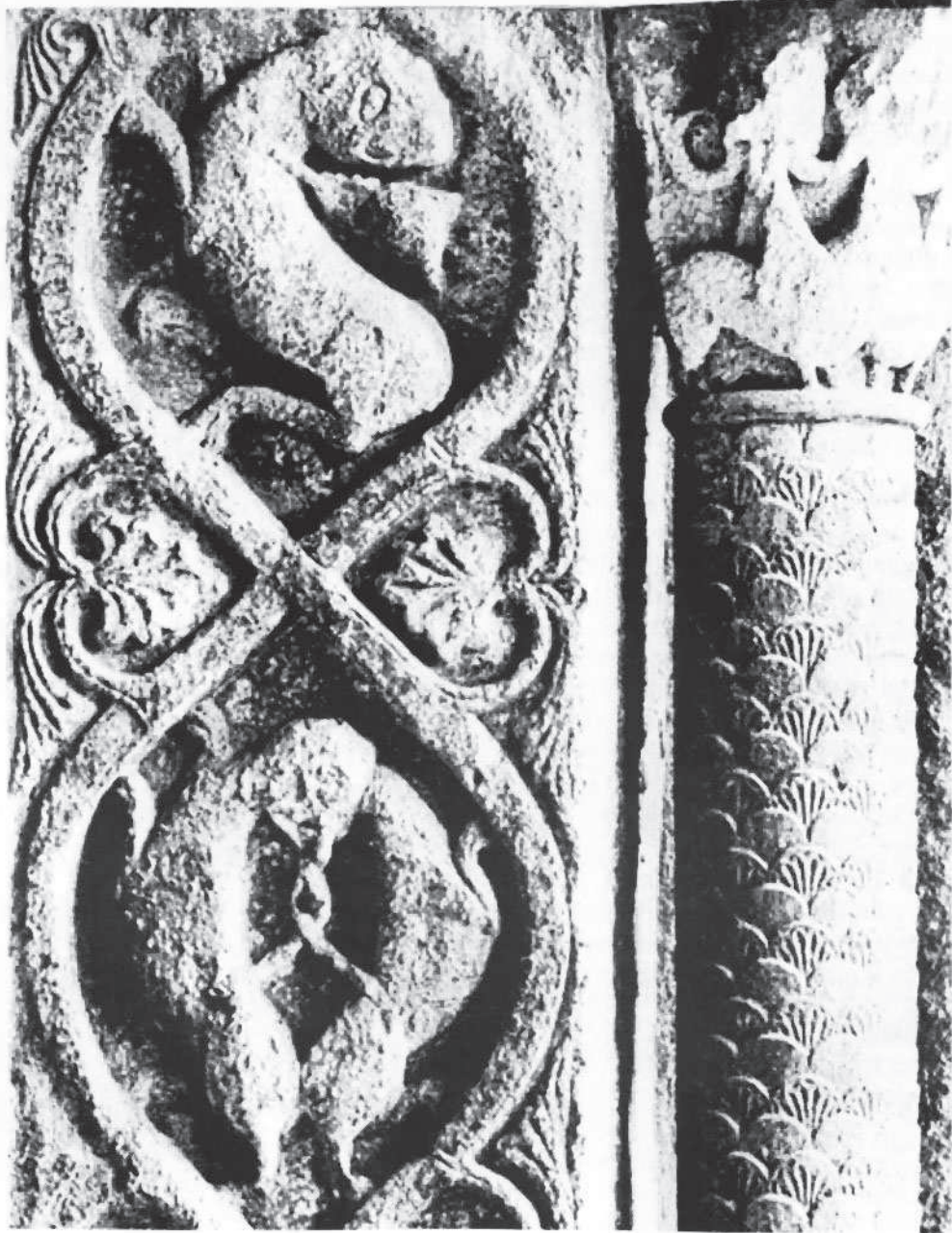
Detall del Claustre de Ripoll.