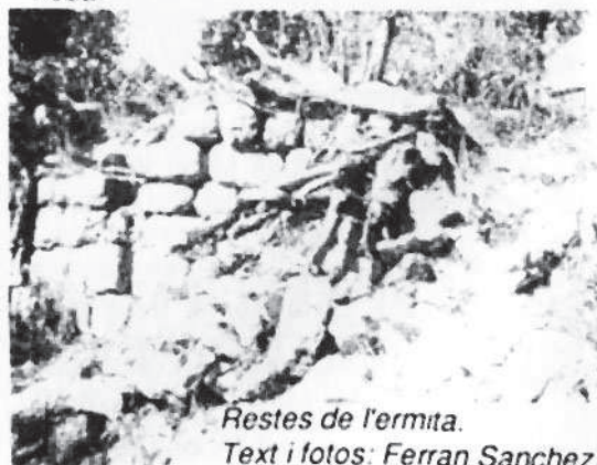
Restes de l'ermita.

Lloc desavinent i escabrós sembrat d'abundants romanalles de la guerra, especialment de llaunes de conserva car el front s'establí allí des de la primavera a finals de 1938, el pujol de Sant Julià encara conserva alguns panys de paret i és una generosa mirada de la serra de Sant Mamet, Vall d'Ager i Montsec d'Ares amb la Roca Regina a l'altra ribera de la Noguera Pallaresa.