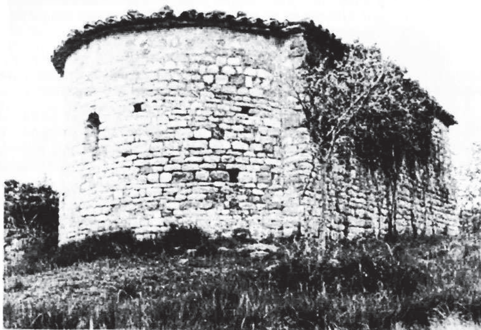
Sant Vicenç de Fontanella Mun. de Castellfollit del Boix