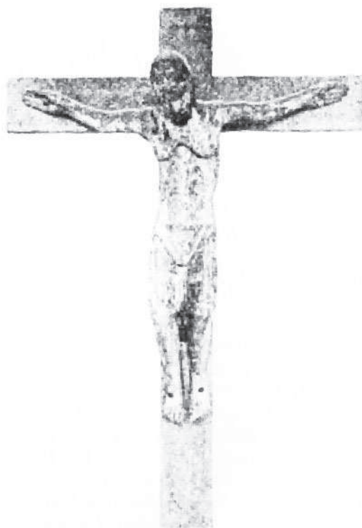
Crucifix romànic del s. XII (Museu Històric de la Seu).

Pel que fa a pintures de tema o origen bagenc, podem observar la coneguda pintura de la Mare de Déu de Montserrat, atribuïda a Juan Andrés Ricci, del Museu de Montserrat, i una tela representant Sant Ignasi de Loiola a Barcelona, obra que es conserva a l'edifici de la Cova de Sant Ignasi de Manresa i que, com l'anterior, és del segle XVII.