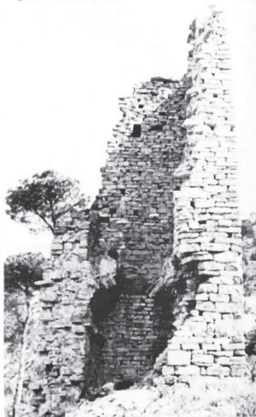
Interior de la torre el 1958

L'existència de tres portals, accessibles els de dalt només amb escales de fusta o de corda, fa creure que els baixos eren un refugi de lliure accés als vianants rerassagats, que no podien arribar a Manresa abans de ser tancats els portals, al capvespre, i que els pisos de dalt eren per als guardes de la torre.