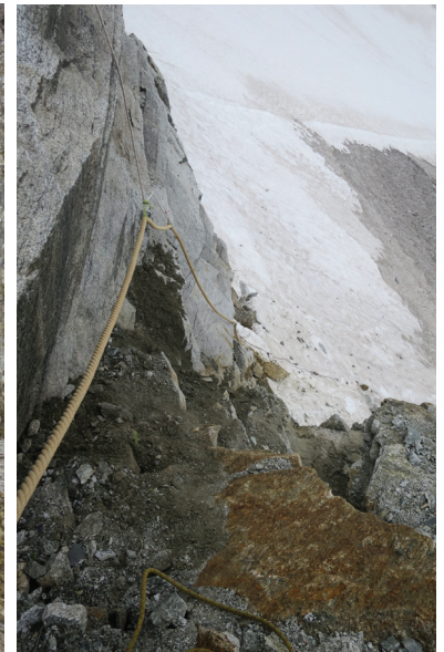
Fixseiltransport und Einrichten der Undri Bächlilicken. 13. Juli 2017

Abgelegt unter: http://www.gruebenhuette.ch/news.html