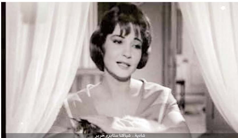
شادية .. شباكتنا ستايره حرير