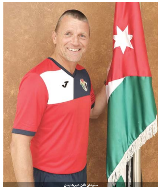
ستيفان فان ديرهايدن