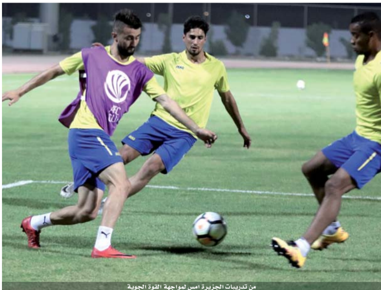
من تدريبات الجزيرة أمس لمواجهة القوة الجوية