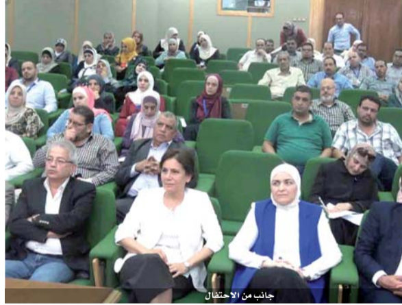
جانب من الاحتفال

عمان - بترا طالبت وزيرة الطاقة والثروة المعدنية المهندسة هالة زواتي موظفي الوزارة بانجاز معاملات المواطنين والرد عليها في مدة أقصاها ثلاثة أيام من تاريخ استلام المعاملة. طالبت وزيرة الطاقة والثروة المعدنية المهندسة هالة زواتي موظفي الوزارة بانجاز معاملات المواطنين والرد عليها في مدة أقصاها ثلاثة أيام من تاريخ استلام المعاملة.