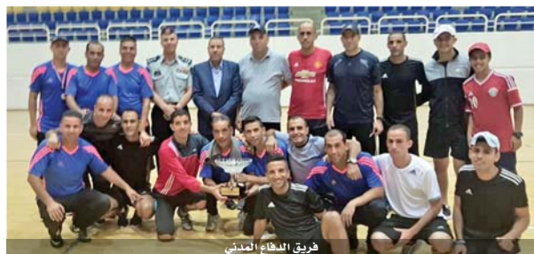
فريق الدفاع المدني

ظفر فريق الدفاع المدني ببطولة قدامى لاعبي الدفاع المدني بخماسيات كرة القدم، التي اقيمت في الصالة الرياضية في مدينة الملك عبدالله الثاني بالقوسمة، بعد فوزه على فريق امانة عمان في المباراة النهائية