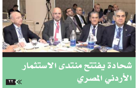
شهادة يفتتح منتدى الاستثمار الأردني المصري