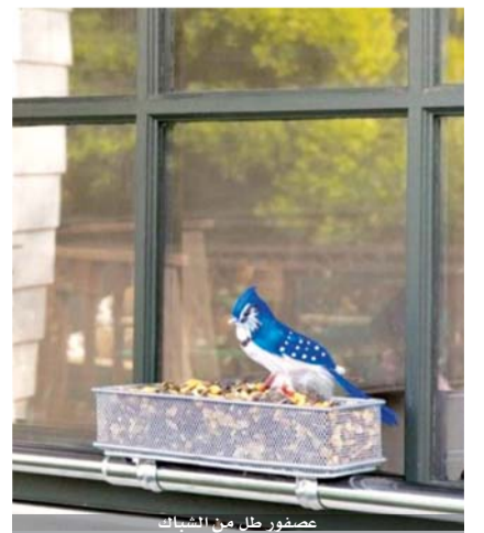
عصفور طل من الشبايك