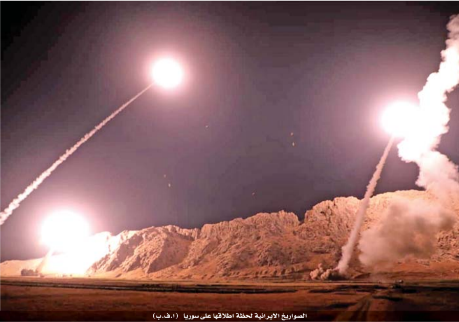
الصواريخ الإيرانية لحظة إطلاقها على سوريا