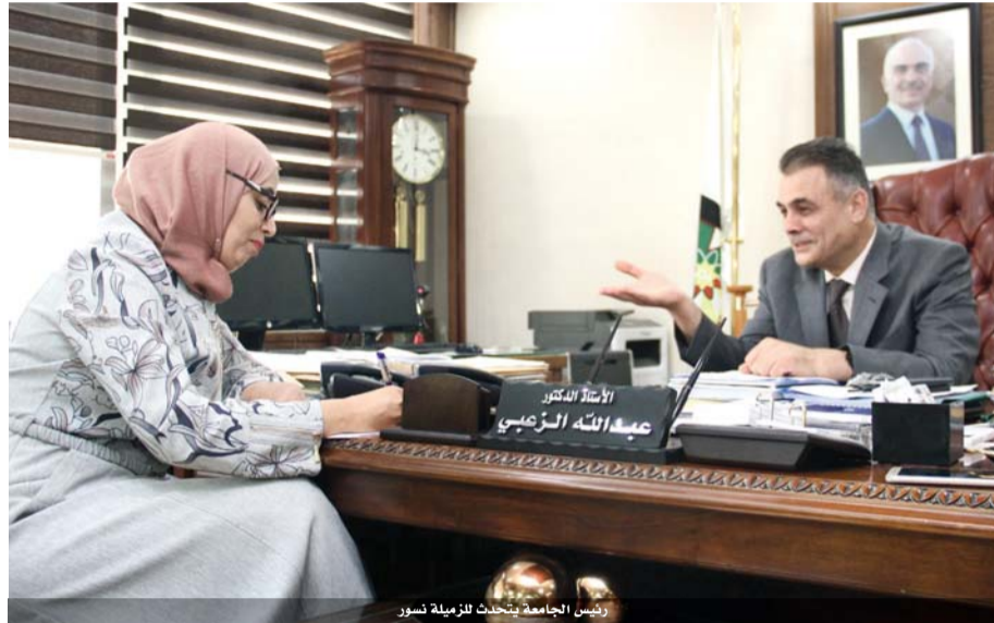
رئيس الجامعة يتحدث للزميلة تسور

وكذلك إقامة فعاليات للمسنين تتضمن قضاء يوم عائلي سعيد بينهم وتناول غذاء جماعي وكذلك إقامة جلسات حوارية وأمثال شعبية