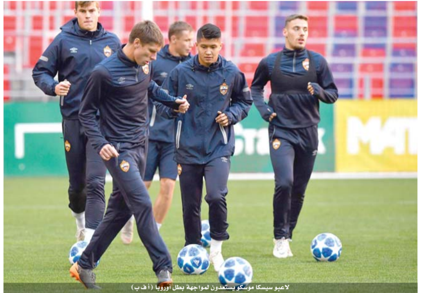
لاعب سيسكا موسكو يستعدون لمواجهة بطل أوروبا

السبت، اضطرت مدربه جولن لوبيتيجي لاستبداله. ومع انخفاض عدد «النجوم» في صفوفه وعدم تعويض انتقال رونالدو بضم لاعب من طينة كبيرة، يجد ريال نفسه يعتمد بشكل متزايد على مجموعة من اللاعبين الشباب، منهم ماركو أسنسيو وإيسكو، وماريانو دياز (٢٥ عاما) العائد هذه السنة من ليون، وداني سيبايوس (٢٠ عاما) الذي دخل بدلا من بايل في مباراة أتلتيكو.