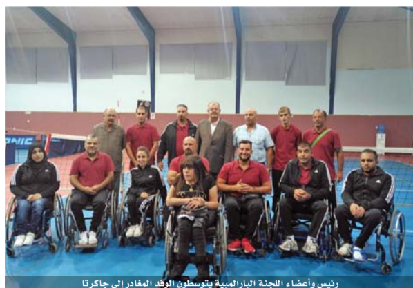
رئيس وأعضاء اللجنة البارالمبية يتوسطون الوفد المغادر إلى جاكرتا