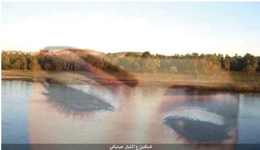
شبايكن ع النيل عنيكى

من الشبايك وانا خدي على الشبايك انا والشوق وناره الحلوة بستناك . و كذلك عبرت شادية عن واقع حالها : م الصبحية وانا في الشبايك مستنتية .. تهل عليا . أما وصف الرجل لعلاقته مع الشباييك فلقد اتسم