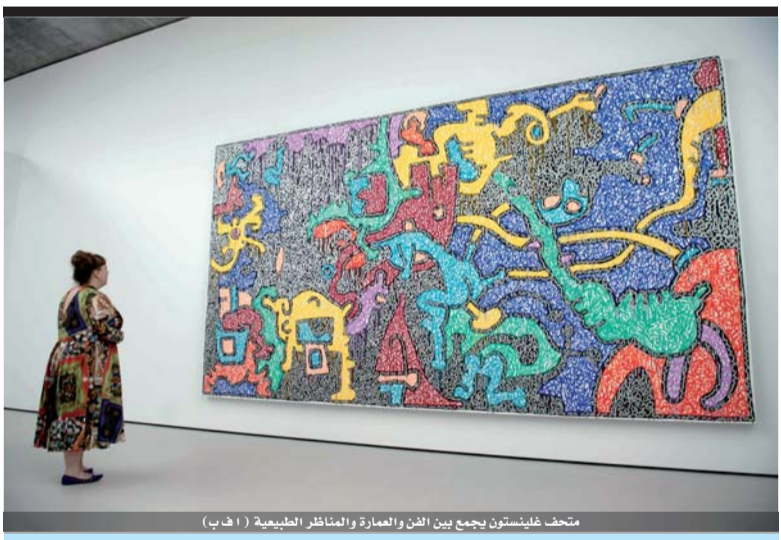
متحف غلينستون يجمع بين الفن والعمارة والمناظر الطبيعية

عمان - خالد الخوجا علمت «الرأي» ان مستشفى الامير حمزة شكل لجنة تحقيق للكشف عن سرقة سرير طبي قيمته اكثر من الف دينار من امام بوابة المستشفى. وقال مصدر مطلع في المستشفى ان السرير تم سرقة وتحميله من قبل مواطنين في بكب حيث تم كشف السرقة من خلال الكاميرات التي بيئت نوعية البكب ورقمه حيث يجري ملاحقته امنيا .