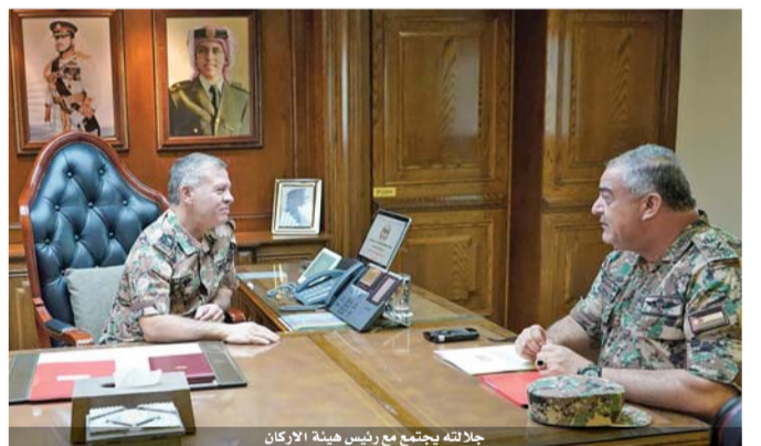
جلالته يجتمع مع رئيس هيئة الأركان