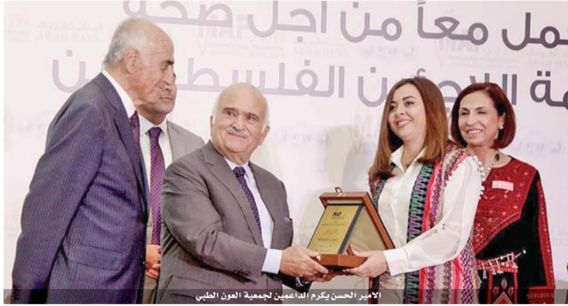
الأمير الحسن يكرم الداعمين لجمعية العون الطبي