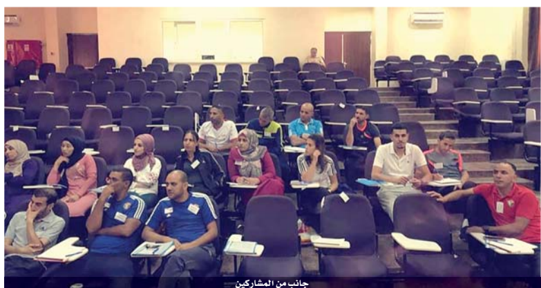
جانب من المشاركين

على مستوى المملكة لعام المنصرم الى جانب اعداد خطة البطولات المحلية للعام الدراسي الحالي .