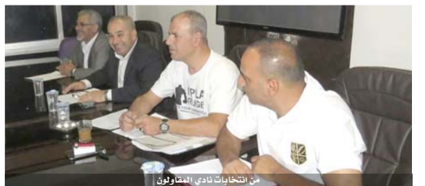
من انتخابات نادي المقاولون