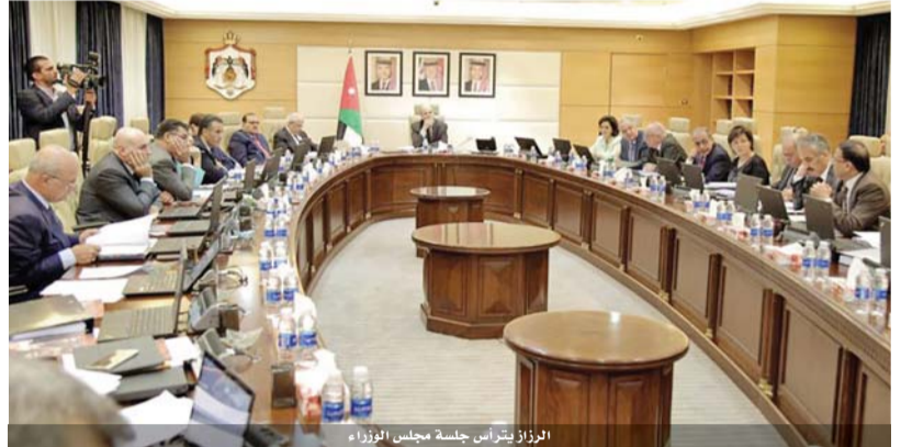
الرؤساء يترأس جلسة مجلس الوزراء