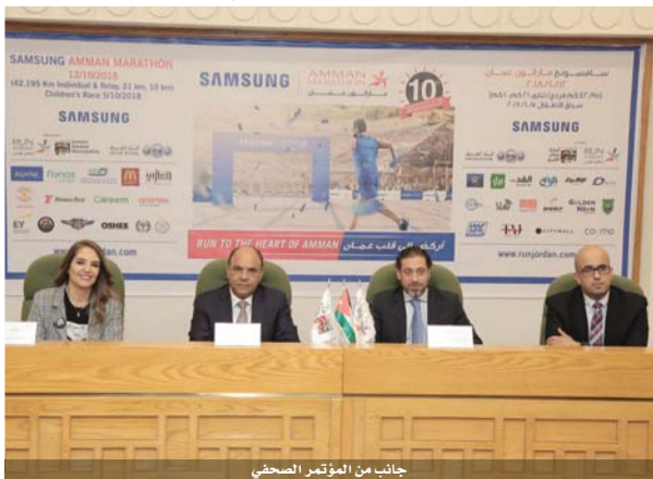
جانب من المؤتمر الصحفي

أهمية كبرى للفعاليات الداعمة للعمل الخيري، إذ تعمل الجمعية على دعم المبادرات الإنسانية من خلال تخصيص جزء من ريع التذاكر لدعم جهود عدد من الجهات الخيرية التي تخدم قطاعات مختلفة.