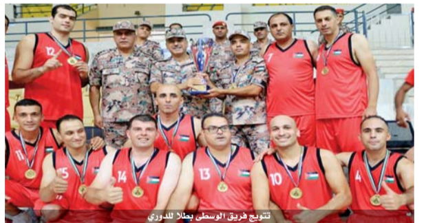
تتويج فريق الوسطى ببطولة الدوري

بتتويج الفرق الفائزة بحضور مدير الاتحاد الرياضي العسكري العميد جهاد قطيشات، حيث سلم الوسطى كأس البطولة والميداليات الذهبية والشمالية الميداليات الفضية. وحل فريق سلاح المدفعية في المركز الثالث، والشرقية رابعاً وسلاح الجو خامساً. وحسب الناطق الاعلامي للاتحاد العسكري تتواصل البطولات العسكرية يوم ٧ الشهر الحالي بانطلاق دوري كرة اليد.