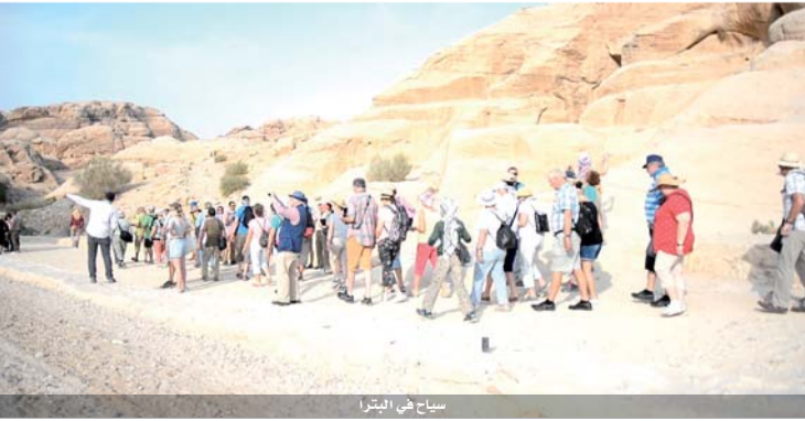
سياح في البترا

بلغ مجموع زوار مدينة البترا الأثرية خلال شهر ايلول الماضي نحو (٥٣٠٢١ زائراً) من مختلف الجنسيات وفقا