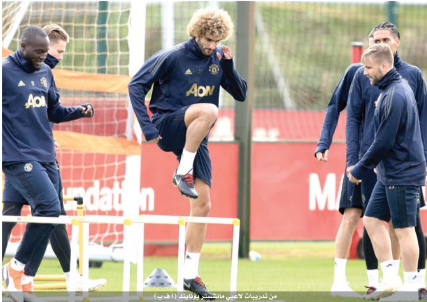
من تدريبات لاعبي مانشستر يونايتد