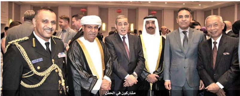
مشاركين في الحفل

حصة شركة البوتاس العربية، وتم إدراج إحدى مصانع الملائس والأزياء الصينية العاملة في الأردن في بورصة ناسداك كأول شركة أردنية بل وعربية تدرج في هذه البورصة.