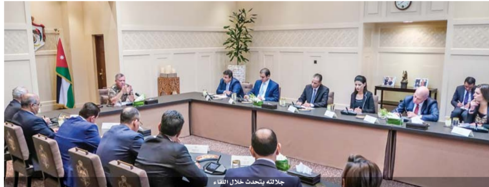
جلالته يتحدث خلال اللقاء

شدد جلالته الملك عبدالله الثاني على ضرورة تطبيق القانون على الجميع بحزم ودون تردد أو محاباة لكائن من كان، وقال «لا يوجد أحد أكبر من البلد». وقال جلالته، خلال لقائه في قصر الحسينية أمس رؤساء تحرير صحف يومية وكتابا صحفيين وإعلاميات، إن إنفاذ القانون واجب على جميع المؤسسات المعنية، ومن يتخاذل البعض أو يطال أقرباء لهم لا يتم احترام القانون. في ذلك «ستكون مشكلته معي أنا». وأضاف جلالته تحدث كثيرا عن سيادة القانون، وأن الأوان أن يدرك الجميع أن سيادة القانون وترسيخ هبة الدولة أولوية حتى نمضي إلى الأمام، وهذه رسالة واضحة مني للجميع.