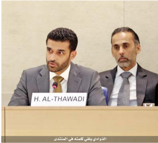
الذواذي يلقى كلمته في المنتدى

ألقى حسن الذواذي، الأمين العام للجنة العليا للمشاريع والإرث، كلمة افتتاحية أمس الاثنين خلال فعاليات اليوم الأول من الدورة العاشرة للمنتدى الاجتماعي لعام ٢٠١٨ والذي يُنظمه مجلس حقوق الإنسان التابع للأمم المتحدة في مدينة جنيف السويسرية. ويُشكل المنتدى الذي يُعقد سنوياً منصة حوارية تفاعلية حرة لممثلي المجتمع المدني والهيئات الحكومية لمناقشة التحديات التي تواجه تطبيق حقوق الإنسان حول العالم. وتنظم نسخة هذا العام تحت شعار «توظيف الرياضة والقيم الأولمبية في احترام حقوق الإنسان والمحافظة عليها». وقد سلط الذواذي الضوء على دور الرياضة خاصة كرة القدم وقدرتها على التقريب بين الشعوب، حيث قال: «تحتي بطولة كأس العالم لكرة القدم كل أربعة أعوام بمكانة هذه اللعبة باعتبارها اللغة الأكثر انتشاراً بين شعوب العالم، حيث تابع نسخة هذا العام من البطولة في روسيا ما يزيد عن ٣,٤ مليار شخص، أي ما يعادل أكثر من نصف سكان الكرة الأرضية. هذه الطاقة الكامنة في لعبة كرة القدم والتأثير الذي تملكه على مختلف الفئات المجتمعية يمنحنا فرصة استثمارها لتعزيز التنمية بكافة مجالاتها، وهي الرؤية التي لطالما حملتها دولة قطر لهذه البطولة بوصفها محفزاً ودافعاً لعملية التنمية على المستويين المحلي والإقليمي».