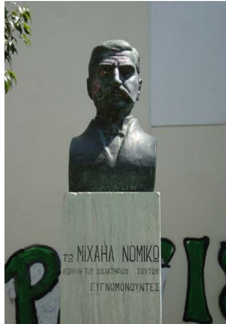
Η προτομή του Μιχαήλ Νομικού