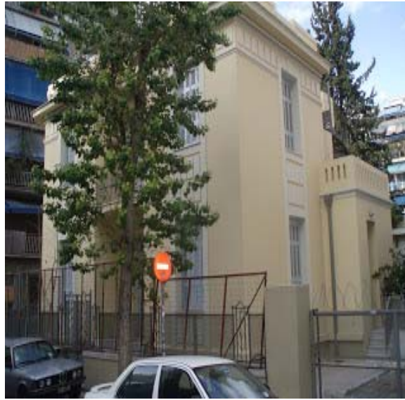
Το σπίτι της Λέλας Καραγιάννη

Ενεκεν, ο Δήμος Αθηναίων, 8-9-1987». Το κτίριο έχει ήδη ανακαινιστεί και πρόκειται να στεγάσει υπηρεσία του Δήμου Αθηναίων.