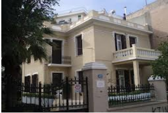
Το Ίδρυμα Γληνού