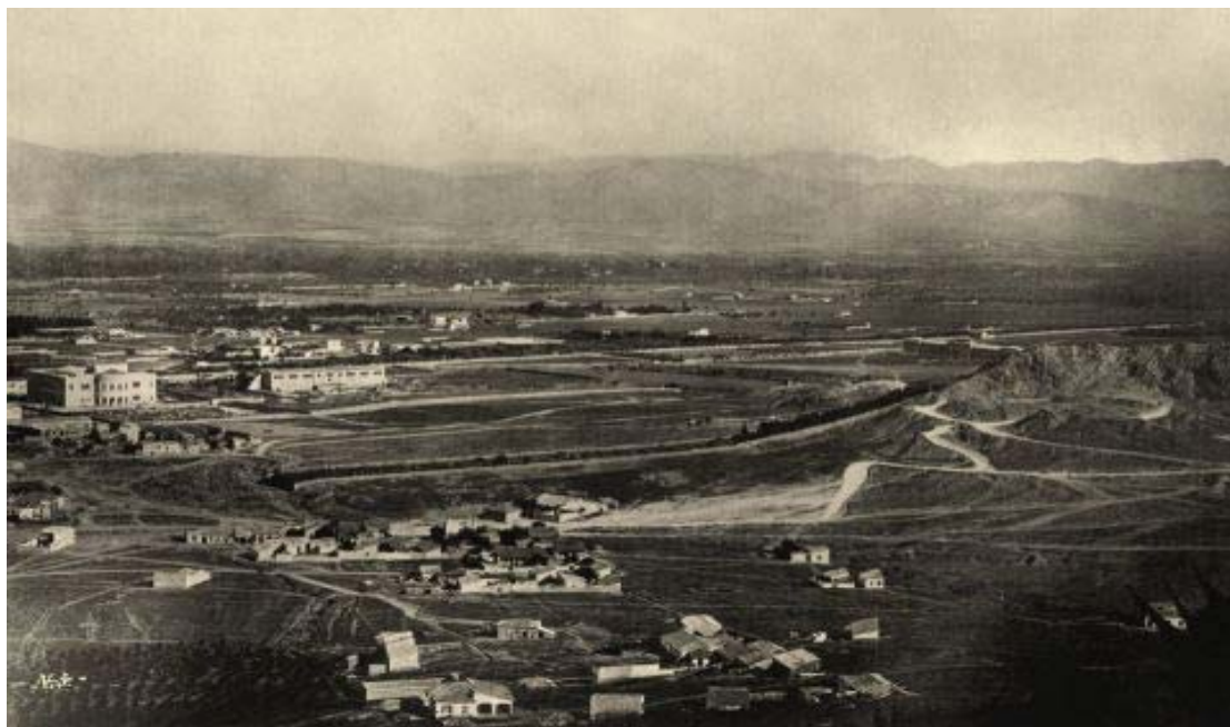
Τα Πατήσια στα τέλη του 19 ου αιώνα. Διακρίνονται από αριστερά τα κτίρια του Πολυτεχνείου και του Μουσείου και η οδός Πατησίων.

Στα τέλη του 19 ου αιώνα τα Πατήσια ήταν ένα απομακρυσμένο προάστιο των Αθηνών γεμάτο ελαιώνες, αμπέλια, κήπους με πεύκα και οπωροφόρα δέντρα και λίγες εξοχικές επαύλεις που ανήκαν σε πλούσιους Αθηναίους. Συνδέθηκαν με τη γιορτή της Άνοιξης, καθώς κάθε Πρωτομαγιά οι Αθηναίοι πήγαιναν να «πιάσουν τον Μάη» στην πλατεία Ανθεστηρίων (μετέπειτα Αγάμων, νυν Αμερικής).