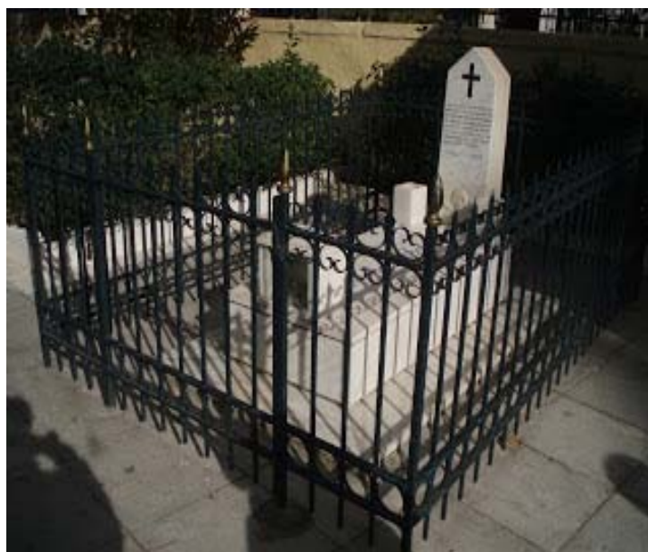
Το μνημείο των αγωνιστών της Επανάστασης του 1821

Πάνω στον τάφο διαβάζουμε την επιγραφή: «□λέξανδρος □ζερώφ, πρέσβης Ρωσίας 1843, συλλέξας □πέθετο □στ□ □λλήνων □ρώων μαχητ□ν 1821-1829 πεσόντων ε□ς μάχας □ν Γαλασί□ □τικ□ς □π□ρ πίστεως κα□ πατρίδος».