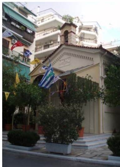
Το εκκλησάκι του Αγίου Νικολάου στην οδό Νάξου