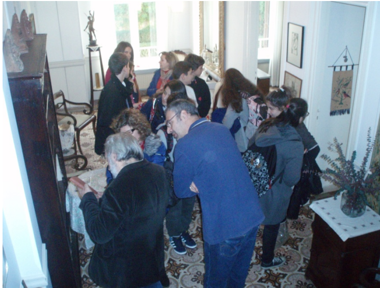
Επίσκεψη μαθητών στο Ίδρυμα Γληνού