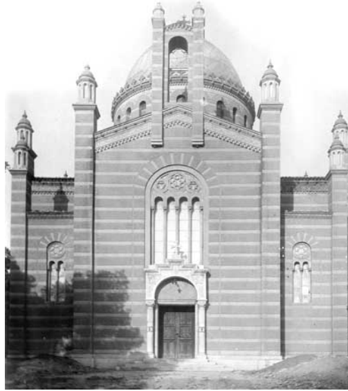
Ο Άγιος Λουκάς

Είναι έργο του Γερμανού αρχιτέκτονα Ερνέστου Τσίλλερ, ο οποίος ήρθε στην Αθήνα το 1861 και έχτισε πολλά δημόσια και ιδιωτικά κτίρια. Ο ναός κτίστηκε πάνω στα ερείπια παλαιότερης Μονής του Αγίου Λουκά. Οι εργασίες ανέγερσής του ξεκίνησαν το 1864 και τα εγκαίνιά του έγιναν το 1870. Ο ρυθμός του ναού είναι εγγεγραμμένος σταυροειδής με τρούλο και το τέμπλο κατασκευάστηκε σε σχέδια του Τσίλλερ, όχι από μάρμαρο, αλλά από γύψο, όπως και τα κιονόκρανα των τεσσάρων μεγάλων μαρμάρινων πεσών που στηρίζουν τον τρούλο.