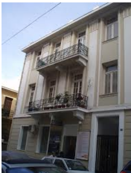
Το σπίτι του Καραγάτση στην οδό Σπάρτης 14.

Ο Μιχάλης Καραγάτσης (1908-1960) ήταν ένας από τους σημαντικότερους συγγραφείς της «Γενιάς του '30». Σπούδασε νομικά και πολιτικές επιστήμες στη Γκρενόμπλ της Γαλλίας. Έγραψε σημαντικά έργα όπως Η Μεγάλη Χίμαιρα , Γιούγκερμαν , Ο κίτρινος Φάκελος , το Δέκα κ.ά.. Έμενε στην οδό Σπάρτης, στην πλατεία Αμερικής.