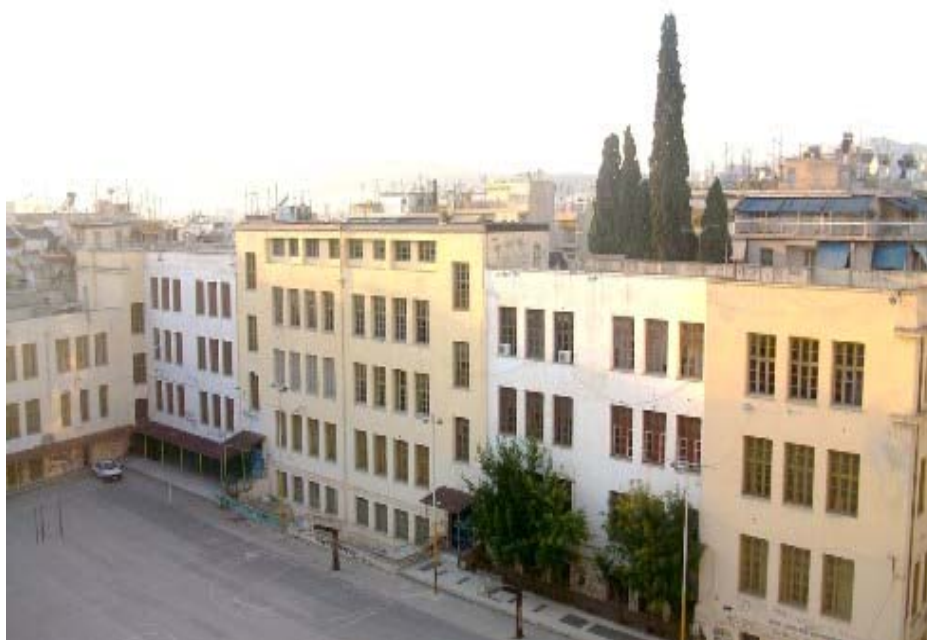
Άποψη του 8 ου Γυμνασίου-Λυκείου Αθηνών

πρώτοι μαθητές του 8 ου Γυμνασίου ήταν ενθουσιασμένοι γιατί το κτίριο ήταν καινούργιο, μοντέρνο, με μεγάλες και ηλιόλουστες αίθουσες. Διέθετε επίσης εργαστήρια φυσικής, χημείας, ξυλουργικής, χειροτεχνίας, θέατρο με σκηνή, αυλαία και παρασκήνια, υπόστεγο γυμναστήριο, σχολικά λουτρά, μαγειρείο, αποθήκες τροφίμων και πολύ μεγάλο προαύλιο. Το 1934 στο προαύλιο του σχολείου, ο αρχιτέκτονας Νικόλαος Μητσάκης σχεδίασε ένα παρεκκλήσι σε μοντέρνα γραμμή, που αφιερώθηκε στους αρχαγγέλους Γαβριήλ και Μιχαήλ, κατά την επιθυμία του Μιχαήλ Νομικού. Το παρεκκλήσι αγιογραφήθηκε από τον ζωγράφο Σπύρο Παπαλουκά. Στο 8 ο Γυμνάσιο φοίτησαν προσωπικότητες με σημαντική προσφορά στην πολιτική, πνευματική και καλλιτεχνική ζωή του τόπου όπως: ο Κωνσταντίνος Καραμανλής, ο Ανδρέας Εμπειρικός, ο Τάσος Αθανασιάδης, ο Κορνήλιος Καστοριάδης, ο Αλέκος Σακελλάριος, ο Φιλοποίμην Φίνος, ο Χρύσανθος Μποστάντζόγλου, ο Τάσος Βουρνάς, ο Μίνως Βολονάκης, ο Μπάμπης Δρακόπουλος, η Μαρία Φαραντούρη, ο Παντελής Βούλγαρης, ο Γιάννης Ζουγανέλης, ο Θάνος Μικρούτσικος, ο Δημήτρης Μητροπάνος και πολλοί άλλοι. Το 8 ο Γυμνάσιο συνεχίζει μέχρι σήμερα τη λειτουργία του προσφέροντας μόρφωση και αγωγή στους νέους της περιοχής των Πατησίων.