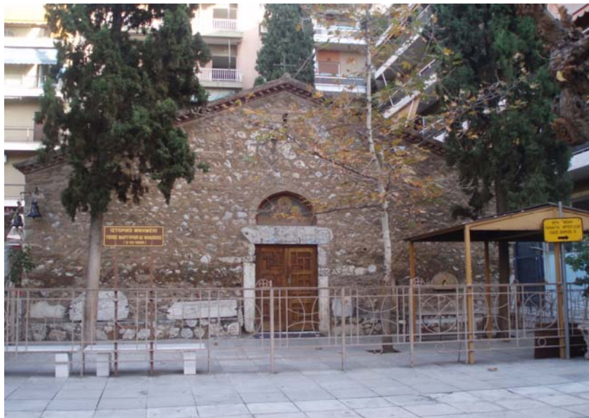
Ο Άγιος Ανδρέας της οδού Λευκωσίας

Δημιουργήθηκε από την Αγία Φιλοθέη στα χρόνια της Τουρκοκρατίας (16 ος αι.). Σε αυτό μαρτύρησε η Αγία Φιλοθέη, στις 3 Οκτωβρίου 1588. Έξω από το ναό, στα δεξιά της εισόδου του, σώζεται η κολώνα, όπου η Αγία Φιλοθέη βασανίστηκε από τους Τούρκους. Το εκκλησάκι αναστηλώθηκε το 1942 από τον Αναστάσιο Ορλάνδο και αργότερα αγιογραφήθηκε από τον ζωγράφο Φώτη Κόντογλου.