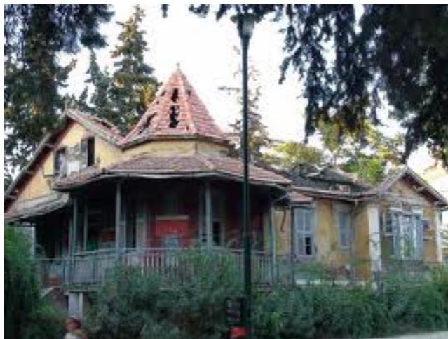
Πρωτότυπο κτίσμα μέσα στο κτήμα Δρακοπούλου με φανερά τα σημάδια της εγκατάλειψης

Το 1882 ιδρύθηκε το εργοστάσιο εριουργίας της εταιρείας «Σ. Βεζάνης και Σελάς» από τον Δημήτρη Βεζάνη, ο οποίος σπούδασε κλωστοϋφαντουργία και πολιτικές επιστήμες στην Ευρώπη. Ήταν ένας από τους πρώτους που έθεσαν τα ζητήματα της οκτάωρης εργασίας, της αργίας της Κυριακής και εισηγήθηκε τον θεσμό των κοινωνικών ασφαλίσεων. Μετά τον θάνατό του στην επιχείρηση τον διαδέχθηκε ο γιός του Σωτήρης Βεζάνης. Το 1922 η επιχείρηση πουλήθηκε στην Ομόρρυθμη Εταιρία Κ. & Α. Δρακοπούλου, που την μετέτρεψε σε βαμβακούργια. Δίπλα στο εργοστάσιο ο Δρακόπουλος έχτισε μια έπαυλη και λίγα μέτρα πιο κάτω ένα κτίριο γραφείων και ένα βοηθητικό κτίριο σε νεοκλασικό ρυθμό. Το εργοστάσιο σταμάτησε τη λειτουργία του περίπου στα μέσα της δεκαετίας του 1950. Ο Δρακόπουλος πέθανε το 1977 σε ηλικία 97 ετών, αφήνοντας όλη την ακίνητη περιουσία του στον Ελληνικό Ερυθρό Σταυρό. Δυστυχώς όμως, σήμερα τα κτίσματα του κτήματος είναι εγκαταλειμμένα και ερειπωμένα.