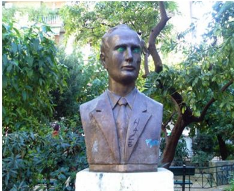
Η προτομή του Θάνου Σκούρα

Βρίσκεται στη συμβολή των οδών Κελαινούς και Θάσου και είναι αφιερωμένη στην μνήμη των μελών της οργάνωσης ΠΕΑΝ (Πανελλήνιος Ένωσις Αγωνιζομένων Νέων) που ανέπτυξε σημαντική αντιστασιακή δράση την περίοδο της Κατοχής (1941-1944). Στο κέντρο της πλατείας υπήρχε μία χάλκινη προτομή του προέδρου της ΠΕΑΝ Θάνου Σκούρα, ο οποίος συνελήφθη και εκτελέστηκε από τους Γερμανούς το 1943. Δυστυχώς η προτομή αυτή εκλάπη πρόσφατα από αγνώστους.