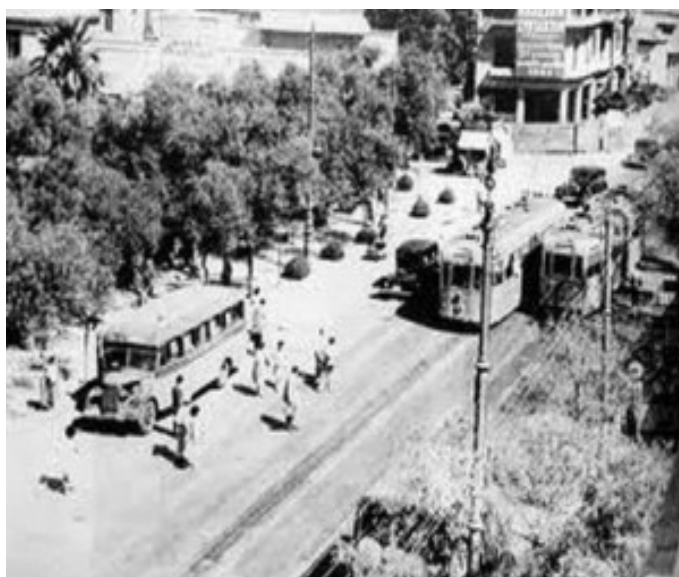
Η πλατεία Αμερικής

Η αρχική της ονομασία ήταν «πλατεία Ανθεστηρίων» γιατί οι Αθηναίοι γιόρταζαν εκεί την Πρωτομαγιά. Το 1887 μετονομάστηκε σε «πλατεία Αγάμων», μάλλον γιατί ήταν χώρος ερωτικών συναντήσεων ανύπαντρων ζευγαριών. Το 1927, με απόφαση του δημοτικού συμβουλίου, μετονομάστηκε σε «πλατεία Αμερικής» προς τιμήν των Ηνωμένων Πολιτειών Αμερικής για τον φιλελληνισμό που επέδειξαν κατά την Επανάσταση του 1821.