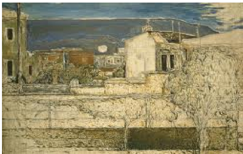
«Σπίτια στου Κυπριάδη» πίνακας του Σπύρου Παπαλουκά (1938)

«Γενιάς του '30». Μεταξύ αυτών οι: Φώτης Κόντογλου, Σπύρος Παπαλουκάς, Ουμβέρτος Αργυρός, Σπύρος Βικάτος, Γιώργος Βακαλό και πολλοί άλλοι.