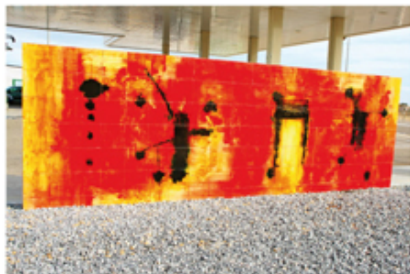
CABEZO EFÍMERO BAJO UNA NUBE ETERNA Jorge Fin (2006)

Esta obra del artista valenciano Ángel Haro tiene unas medidas de 2 x 6 metros y está compuesto por 140 piezas en cerámica pintada y cocida en los talleres Martín Lario de Lorca. Ángel Haro nunca ha buscado lo fácil, sólo, lo que su inquietud le ha dictado hacer; por lo tanto, sus obras adquieren una gran personalidad.