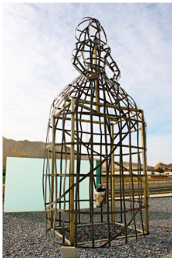
SOMBRAS IGNEAS Ángel Haro (2006)

Situado en la "Isleta de las Artes", este mural cerámico está colocado estratégicamente junto al mural de Jorge Fin para poder ser contemplados desde la autovía de San Javier - Murcia.