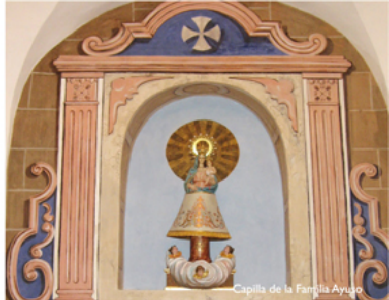
Capilla de la Familia Ayuso

El 16 de Octubre de 1908 la ermita pasa de ser dependiente de la parroquia de Torre-Pacheco a constituirse en rectoría con pila bautismal.