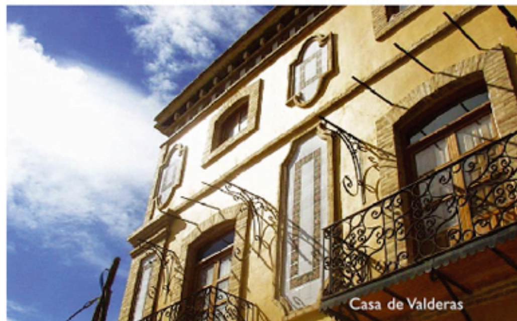
Casa de Valderas

La Hacienda de Roldán , cuya casa probablemente fue la primera edificación del pueblo (a mediados de 1600) y de dónde toma éste su nombre, perteneció a las familias del Conde del valle San Juan y al Marqués de Rozalejo.