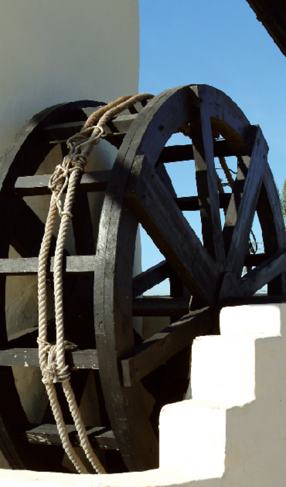
Molino de la Hortichuela