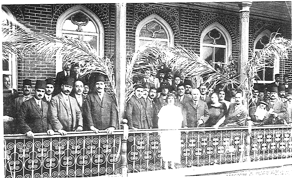
בית-החינוך לעיוורים בבגדאד (התצלום משנת תרצ"ה)

החינוך של הקהילה ונבחר כראש הקהילה החילונית הראשון ב-1932, על-פי חוק העדה החדש. 49