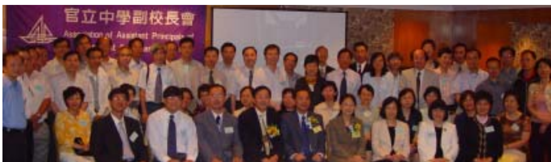
主辦機構與議會委員(講者)合照