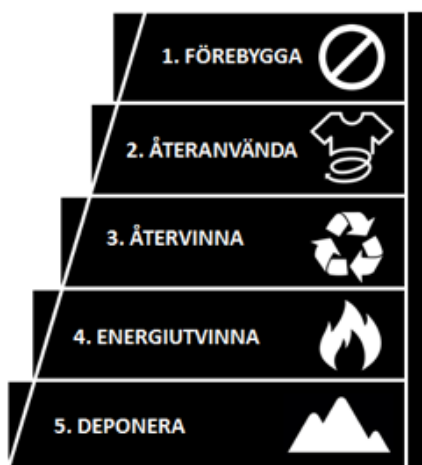
Figur 1. Avfallshierarkin, modellen som styr svensk och europeisk avfallshantering. Illustration: Nils Johansson

Vidare läsning: Europaparlamentet och Europeiska Unionens Råd (2008/98/EC); Naturvårdsverket (2015); Hultman och Corvellec (2012); Zapata Campos, Eriksson-Zetterquist och Zapata (2014)