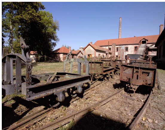
Figure 2, la Briqueterie de Ciry, près de Montceau, où un chantier d'insertion a permis de former plusieurs centaines de professionnels du bâtiment et de restaurer une usine historique qui est devenue une antenne de l'écomusée sur l'industrie céramique

Il s'agit d'une structure dont le langage est l'exposition, couvrant la totalité d'un territoire plus ou moins cohérent, utilisant le patrimoine global de ce territoire et l'expertise de ses habitants. C'est un instrument culturel pour le développement du territoire, selon un processus continu impliquant la communauté locale, les collectivités politiques et les institutions administratives et scientifiques et un certain nombre de professionnels.