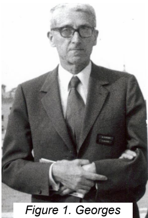
Figure 1. Georges Henri Rivière

La Conférence générale de l'icom en 1971 se tenait un an avant la première conférence des Nations Unies sur l'environnement (Stockholm 1972). De là est venue l'idée de revendiquer un rôle important pour les musées de sciences naturelles dans l'éducation à l'environnement, à l'écologie. Créé à la demande du ministre français de l'environnement, le mot écomusée devait refléter ce souci et en particulier désigner les "maisons" de parcs naturels régionaux alors en voie de création en France.