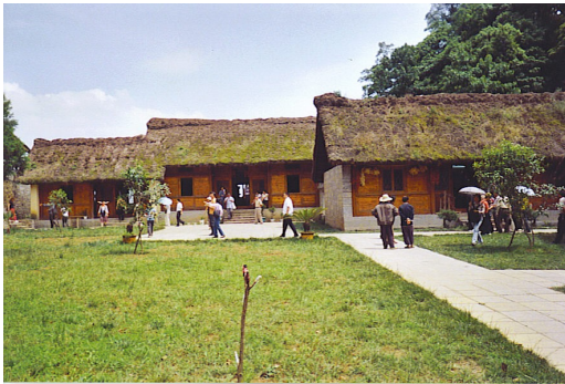
Figure 4. Ecomusée de So Ga (Chine)

En Chine, une initiative de l'administration centrale relayée par plusieurs provinces a mené à la création d'un vaste réseau d'écomusées (une quarantaine à ce jour), selon un modèle unique, au service des cultures et des patrimoines des minorités ethniques et pour répondre à l'afflux de touristes chinois qui risquaient de porter atteinte à l'intégrité culturelle de ces minorités.