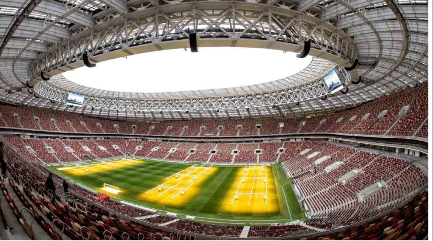
အဖွင့်ပွဲစဉ်နှင့် ဗိုလ်လုပွဲယှဉ်ပြိုင်မည့် ပရိသတ် ၈၁၀၀၀ ဆုံ လွန်နန်ကီကွင်းကြီး။

၂၀၁၄ ခုနှစ် အောက်တိုဘာလအတွင်းမှာ ခရစ်အန်ဂါဦးဆောင်တဲ့ စိစစ်ရေးအဖွဲ့အစည်းက စိန့်ပီတာစဘတ်၊ ဆိုချို၊ ကာဇန်နဲ့ မော်စကိုမြို့တွေမှာရှိတဲ့ ကွင်းတွေကို သွားရောက်စစ်ဆေးခဲ့ပြီး တိုးတက်မှုများစွာ ရှိလာတယ်ဆိုတာကို ထောက်ခံချက်ပေးခဲ့ပါတယ်။ ၂၀၁၅ ခုနှစ် အောက်တိုဘာ ၈ ရက်မှာတော့ ပြိုင်ပွဲကျင်းပမယ့် ကွင်း ၁၂ ကွင်းကို အတည်ပြုကြေညာနိုင်ခဲ့ပြီး