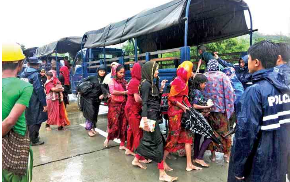
အစ္စလာမ်ဘာသာဝင် ၁၀၄ ဦးအား ငါးခုရပြန်လည်လက်ခံရေးစခန်းသို့ မော်တော်ယာဉ်များဖြင့် ပို့ဆောင်ရေး ဆောင်ရွက်ပေးစဉ်။