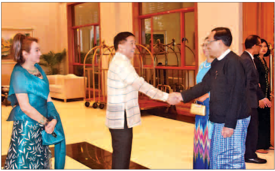
ပြည်ထောင်စုဝန်ကြီး ဦးကျော်တင်နှင့်ဇနီး ဖိလစ်ပိုင်သမ္မတနိုင်ငံ လွတ်လပ်ရေးနေ့ အထိမ်းအမှတ်ဧည့်ခံပွဲသို့ တက်ရောက်ရာ ဖိလစ်ပိုင်သံအမတ်ကြီးနှင့်ဇနီးတို့က ကြိုဆိုနှုတ်ဆက်စဉ်။

လွတ်လပ်ရေးနေ့အထိမ်းအမှတ်ကိတ်ကို လှီးဖြတ်ပေးကြသည်။ ထို့နောက် ပြည်ထောင်စုဝန်ကြီးနှင့်ဇနီး၊ သံအမတ်ကြီးနှင့်ဇနီးတို့က ဧည့်ခံပွဲသို့ တက်ရောက်လာကြသူများနှင့် အတူ မှတ်တမ်းတင်ဓာတ်ပုံရိုက်ကြသည်။ ယင်းနောက် ဧည့်ခံပွဲသို့ တက်ရောက်လာကြသူများအား သံအမတ်ကြီးနှင့် ဇနီးတို့က ညစာစားပွဲဖြင့် တည်ခင်းဧည့်ခံသည်။ ဧည့်ခံပွဲအခမ်းအနားသို့ ညှိနှိုင်းကွပ်ကဲရေးမှူး(ကြည်း) ရေ (လေ) ဗိုလ်ချုပ်ကြီး မြထွန်းဦးနှင့်ဇနီး၊ နေပြည်တော်တိုင်းစစ်ဌာနချုပ်တိုင်းမှူး ဗိုလ်ချုပ်မြင့်မော်နှင့်ဇနီး၊ ဌာနဆိုင်ရာ အကြီးအကဲများနှင့် ဖိတ်ကြားထားသူများ တက်ရောက်ကြသည်။ သတင်းစဉ်