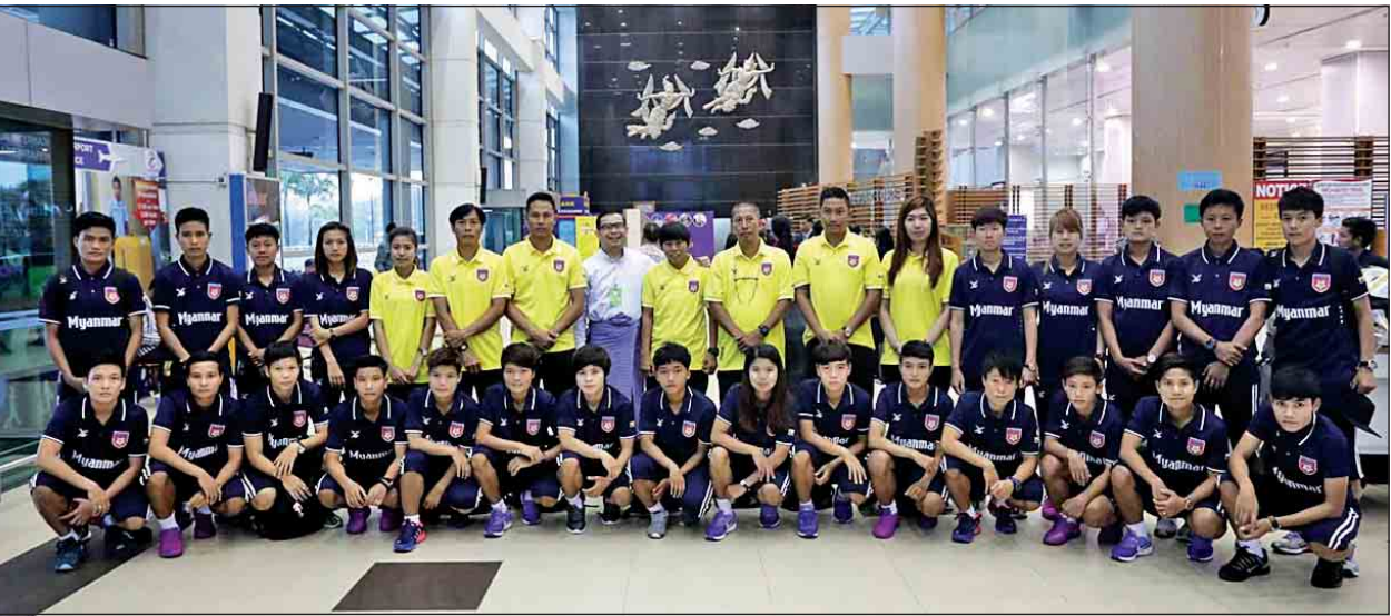
မြန်မာ့လက်ရွေးစင်အမျိုးသမီးအသင်း ထိုင်းနိုင်ငံသို့ မထွက်ခွာမီ ရန်ကုန်အပြည်ပြည်ဆိုင်ရာလေဆိပ်၌ တွေ့ရစဉ်။

ကြရန် G-7 နိုင်ငံခေါင်းဆောင်များအနေဖြင့် ကတိပြုကြောင်း၊ အထူးသဖြင့် လက်ရှိပေါ်ပေါက်နေသော နေရပ်စွန့်ခွာသွားသူများကိစ္စတွင် လူသားချင်း စာနာထောက်ထားမှုအကူအညီများအား လွယ်ကူအဆင်ပြေချောမွေ့စွာ ပေးအပ်နိုင်ရေးနှင့် ၎င်းတို့ဆန္ဒအလျောက် သိက္ခာရှိရှိ ဘေးအန္တရာယ် ကင်းစွာဖြင့် စာမျက်နှာ ၄ ကော်လံ ၅ သို့ *