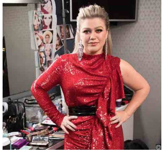
သူ့ရဲ့ပိုက်ဆံအိတ်ကို ယခုထက်ထိ ပေါ့ပါးနေစေတဲ့ အကြောင်းအရင်းတစ်ခု ဖြစ်ခဲ့ပြန်ကြောင်းနဲ့ ဒီလိုနည်းနဲ့ ကိုယ်အလေးချိန်လျှော့ချရတာဟာ တကယ့်ကို အကုန်အကျ များကြောင်းလည်း ဆိုပါတယ်။

တေးသံရှင် ကယ်လီကလော့ခ်ဆန်ဟာ လတ်တလောမှာတော့ ယခင်ထက် ပိုမိုပိုန်လာတာကို တွေ့ရပါတယ်။ ဒီလို ကိုယ်အလေးချိန်လျှော့ကျသွားတာ ကတော့ သူ့ရဲ့စားသောက်မှုပုံစံကို အနည်းငယ်ပြောင်းလဲလိုက်တာကြောင့် ဖြစ်တယ်လို့ သူက ဆိုပါတယ်။ သူ့ရဲ့ သန့်ရှင်းတဲ့စားသောက်မှုပုံစံနဲ့ ကိုယ် အလေးချိန်လျှော့ချတဲ့ အစီအစဉ်ကြောင့် သူ့ရဲ့ပိုက်ဆံအိတ်ဟာ ယခင်ကထက် ပိုမိုပေါ့ပါးလာခဲ့ကြောင်းလည်း ကလော့ခ်ဆန်က မီဒီယာတွေနဲ့ တွေ့ဆုံစဉ် ပြောကြားခဲ့ပါတယ်။ သူ့စားတဲ့ အစားအစာတွေဟာ အလွယ်တကူဝယ်ယူဖို့ ခက်ခဲကြောင်းလည်း တစ်ပါတည်း ထုတ်ဖော်ပြောကြားခဲ့တာဖြစ်တယ်လို့ အေ့စ်ရှိုးဘစ်ဇ်ဒေါ့ကွန်းရဲ့ ရေးသားဖော်ပြချက်တွေအရ သိရပါတယ်။ “Because of You” တေးသံချင်းရဲ့ တေးသံရှင် ကယ်လီကလော့ခ်ဆန် အနေနဲ့ ပိုန်လာတာတွေ့ရတာကြောင့် မီဒီယာတွေက သူ့ကို လေ့ကျင့်ခန်း ပြုလုပ်ပြီး ဝိတ်ချနေတာလားလို့ မေးမြန်းခဲ့ရာ သူက အစားအသောက်ကိုသာ ပြောင်းလဲဆင်ခြင်ခဲ့တာဖြစ်ကြောင်း ပြန်လည်ဖြေကြားခဲ့ပါတယ်။ ဒီလို စားသောက်ပုံပြောင်းလဲလိုက်တာဟာ ကိုယ်အလေးချိန်လျှော့ချတာထက် သူ့ရဲ့ကျန်းမာရေးပြဿနာတွေ ပိုမိုကောင်းမွန်လာစေဖို့ရာ ဖြစ်တယ်လို့လည်း သိရပါတယ်။