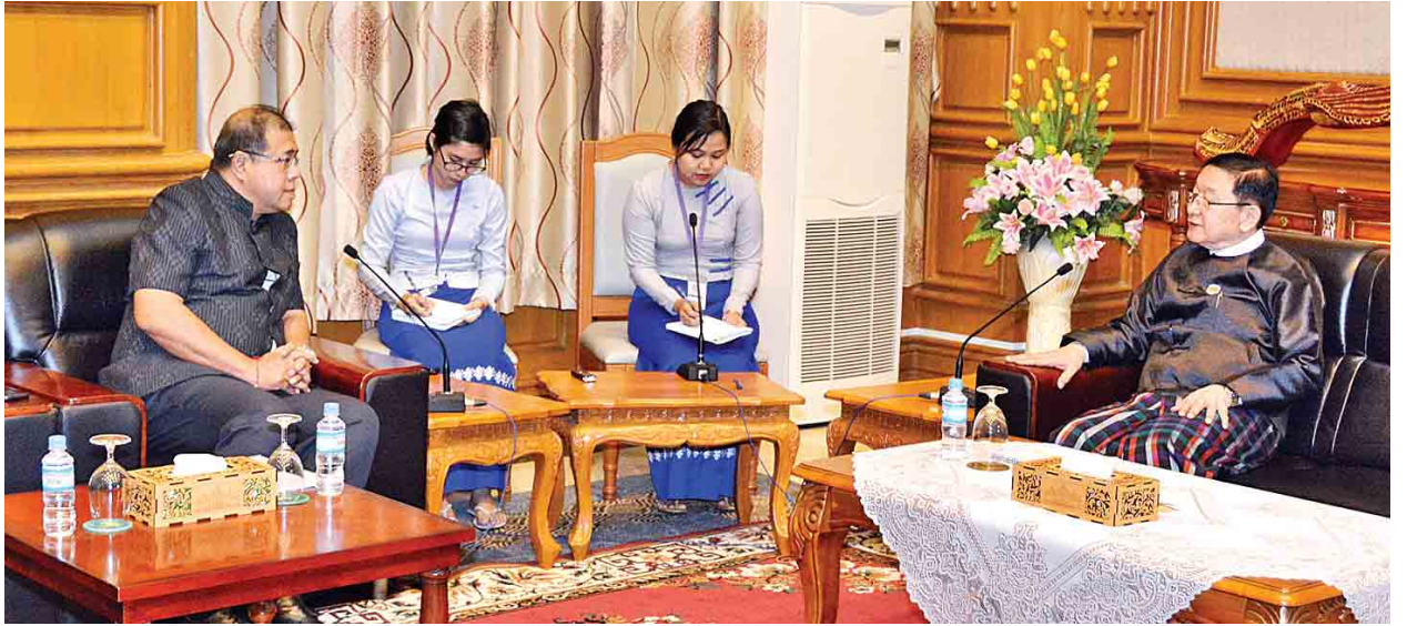
ပြည်သူ့လွှတ်တော်ဥက္ကဋ္ဌ ဦးတီခွန်မြတ် မြန်မာနိုင်ငံဆိုင်ရာ ထိုင်းနိုင်ငံ သံအမတ်ကြီး H.E.Mr.Jukr Boon-Long အား လက်ခံတွေ့ဆုံသည်။