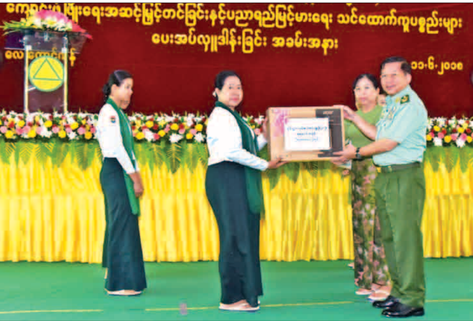
မူလတန်းမှ အလယ်တန်း၊ နဝမတန်းအထိ အောင်ချက်မြင့်မားသော်လည်း တက္ကသိုလ်ဝင်တန်းတွင် အောင်ချက်များစွာ လျော့နည်းသွားခြင်းမှာ မည်သည့်အတွက်ကြောင့်ဖြစ်သည်ကို အဖြေရှာရန်လိုကြောင်း၊ နှစ်စဉ်အတန်းမှန်မှန်အောင်မြင်သွားစေရန်အတွက် ဆရာ ဆရာမများအနေဖြင့် ကျောင်းသား ကျောင်းသူများအား အမှန်တကယ်တတ်ကျွမ်းအောင် သင်ကြားပေးရန်လိုအပ်သကဲ့သို့ ကျောင်းသား

ရန်ကုန် ၅၆ ၁၁ တပ်မတော်ကာကွယ်ရေးဦးစီးချုပ် ဗိုလ်ချုပ်မှူးကြီး မင်းအောင်လှိုင်သည် ယနေ့နံနက်ပိုင်းတွင် ရန်ကုန်တိုင်း ဒေသကြီး ဒဂုံဆိပ်ကမ်းမြို့နယ် မြန်မာ့သားကောင်း စစ်မှုထမ်းဟောင်းအိမ်ရာ (လေးထောင့်ကန်)အနီးရှိ အခြေခံပညာအထက်တန်းကျောင်း ဇာတိမာန်ခန်းမ၌ ပြုလုပ်သည့် အမှတ်(၁)စိုက်ပျိုးမွေးမြူရေးရပ်ကွက် ကျောင်းပွဲ၊ ပြီးရေး အဆင့်မြှင့်တင်ခြင်းနှင့် ပညာရည်မြှင့်မားရေး သင်ထောက်ကူပစ္စည်းများ ပေးအပ်လှူဒါန်းခြင်း အခမ်းအနားသို့ တက်ရောက်အမှာစကား ပြောကြားသည်။ တပ်မတော်ကာကွယ်ရေးဦးစီးချုပ်က ၂၀၁၄ ခုနှစ်မှ ၂၀၁၈ ခုနှစ်အထိ ငါးနှစ်တာကာလအတွင်း တက္ကသိုလ်ဝင်တန်းစာမေးပွဲ ဖြေဆိုသူ ၃၂၈၂၅၂ ဦးရှိပြီး အောင်မြင်သူ ၁၁၄၈၇၁ ဦးရှိကာ စာမေးပွဲကျွန်းသူ ၂၁၃၄၄၅၁ ဦးရှိသည်ကို တွေ့ရသဖြင့် ကျွန်းသူ များပြားသည်ကို တွေ့ရှိရကြောင်း၊ တက္ကသိုလ်ဝင်တန်းတစ်ခုတည်းအတွက် ငါးနှစ်တာကျွန်းမှုများကို အခြေခံ၍ ကျောင်းသားတစ်ယောက် စားသောက်စရိတ်အပါအဝင် နေ့စဉ်ပျမ်းမျှ ကုန်ကျစရိတ် ငွေကျပ် ၁၂၀၀ ခန့်ဖြင့် တွက်ပါက ကျောင်းတက်ရက် ၁၈၀ ရက် ငါးနှစ်တာ ကာလအတွက် ငွေကျပ် ၅၇၆ ဘီလီယံကျော်ရှိပြီး တစ်နှစ် ၃၆၅ ရက်အတွက်ဆိုပါက ငွေကျပ် ၁၁၅၀ ဘီလီယံခန့် ကျောင်းသားမိဘများက သုံးစွဲကုန်ကျခဲ့သည်ကို တွေ့ရကြောင်း၊ သို့ဖြစ်၍ ကျောင်းသားတိုင်း စာအမှန်တကယ်တတ်မြောက်ရန်နှင့် နှစ်စဉ်အတန်းမှန်မှန်တက်ရန် အရေးကြီးကြောင်း၊