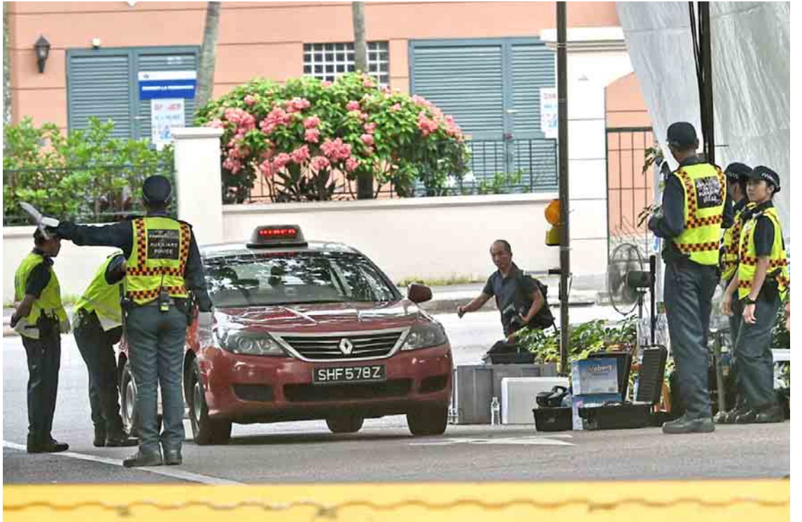
ထိပ်သီးအစည်းအဝေးမကျင်းပမီ စင်ကာပူ၌ လုံခြုံရေးတင်းကျပ်ထားစဉ်။