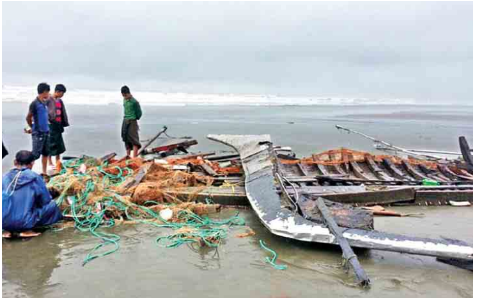
ဝမ်းဗိုက်ထက်ခြမ်းကွဲ ဖျက်စီးနေသော စက်လှေအပျက်အစီးများကို တွေ့ရစဉ်။