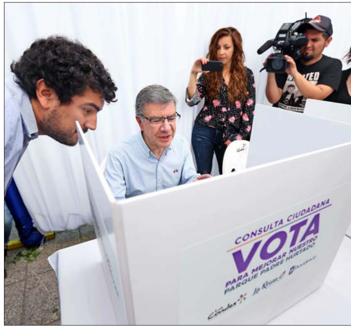
El alcalde de Las Condes, Joaquín Lavín, explicó ayer el proceso de consulta ciudadana sobre el plan de mejoramiento para el parque Padre Hurtado.

vín explicó en terreno el proceso de consulta ciudadana.