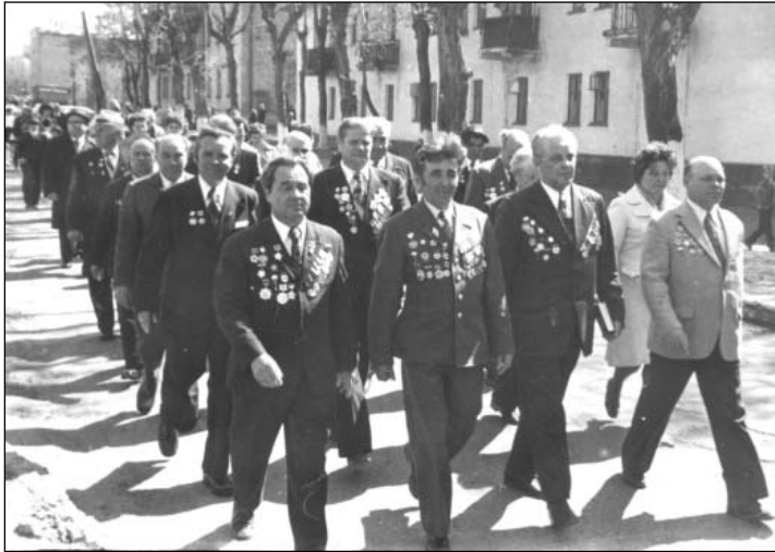
Шествие колонны участников Великой Отечественной войны 1941 – 1945 гг. по ул. Героев Свири в Железнодорожном районе Ульяновска. Май 1980 г.