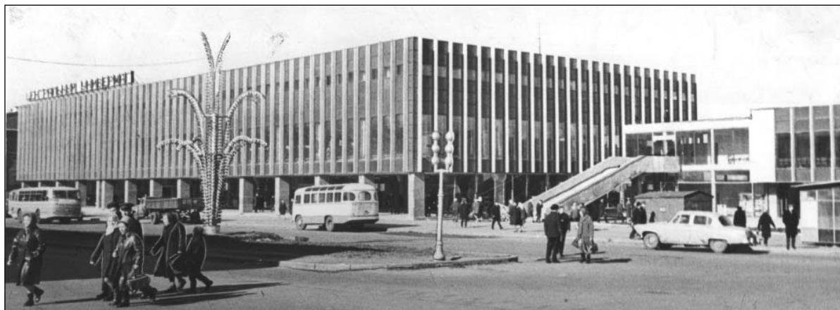
Здание Ульяновского Дома торговли. 24 апреля 1970 г.