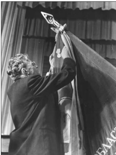
Член Политбюро ЦК КПСС М. И. Суслов во время награждения Ульяновской области орденом Ленина. 13 мая 1966 г..