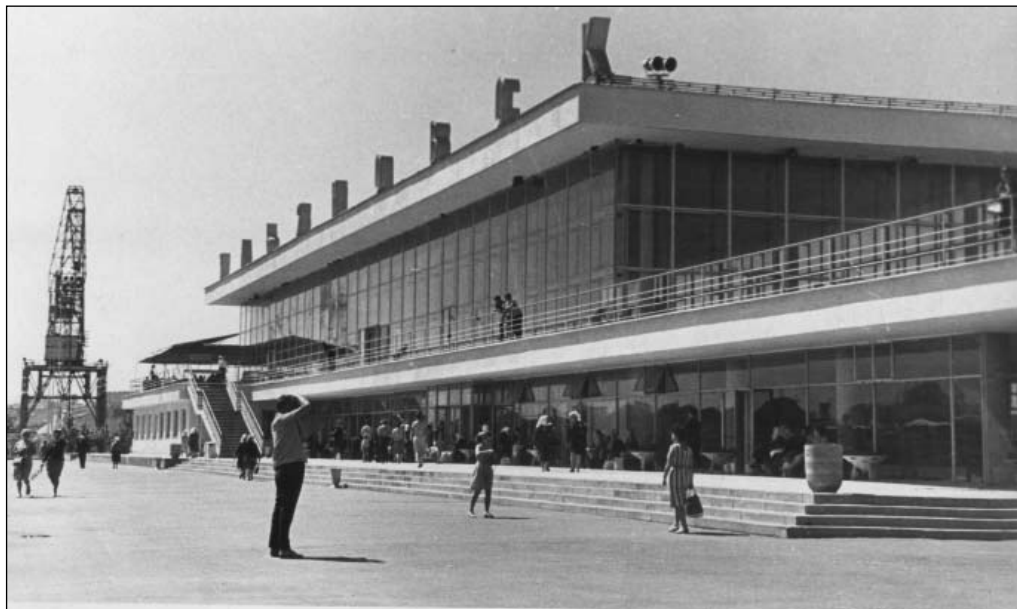
Здание Ульяновского аэропорта. 1970 г.