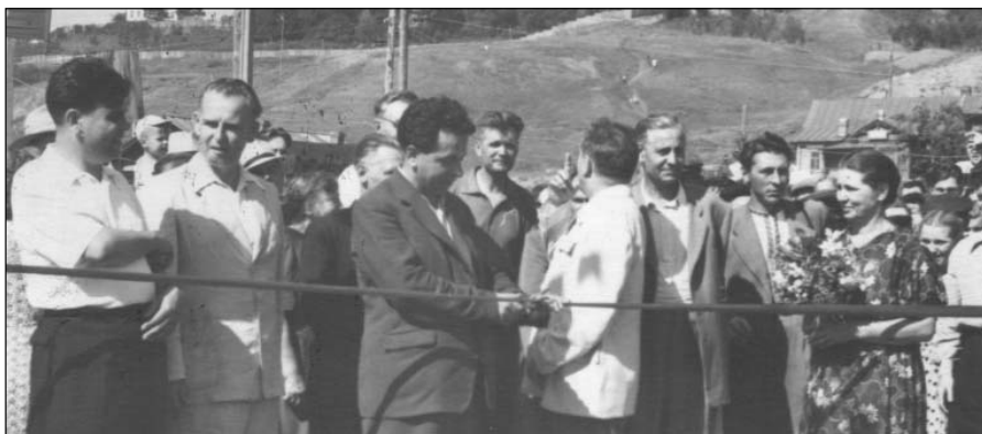
Открытие автогужевого моста через р. Волга. 10 августа 1958 г.