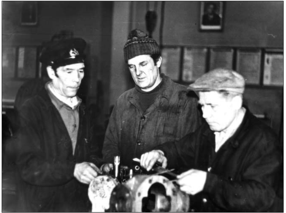
Группа слесарей дизель-агрегатного цеха Ульяновского локомотивного депо. 15 февраля 1986 г.