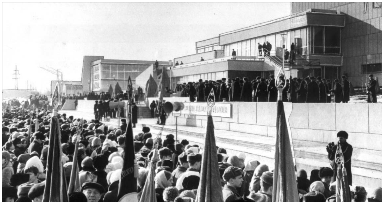
Торжественный митинг, посвящённый открытию нового здания областного Дворца пионеров и школьников в г. Ульяновске. 11 марта 1970 г.