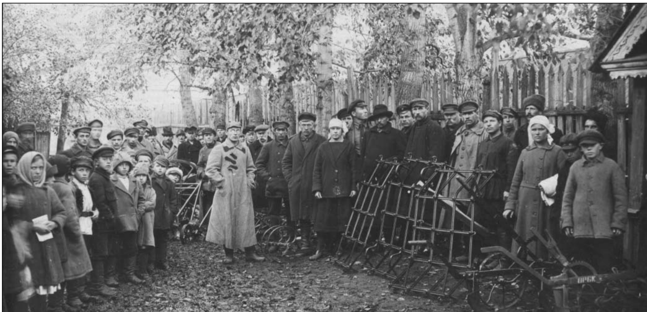
Выставка сельскохозяйственного инвентаря. Карсунский уезд. Октябрь 1926 г.