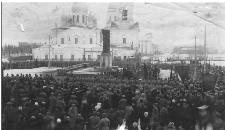
Митинг в честь открытия памятника К. Марксу в Симбирске. 7 ноября 1921 г.