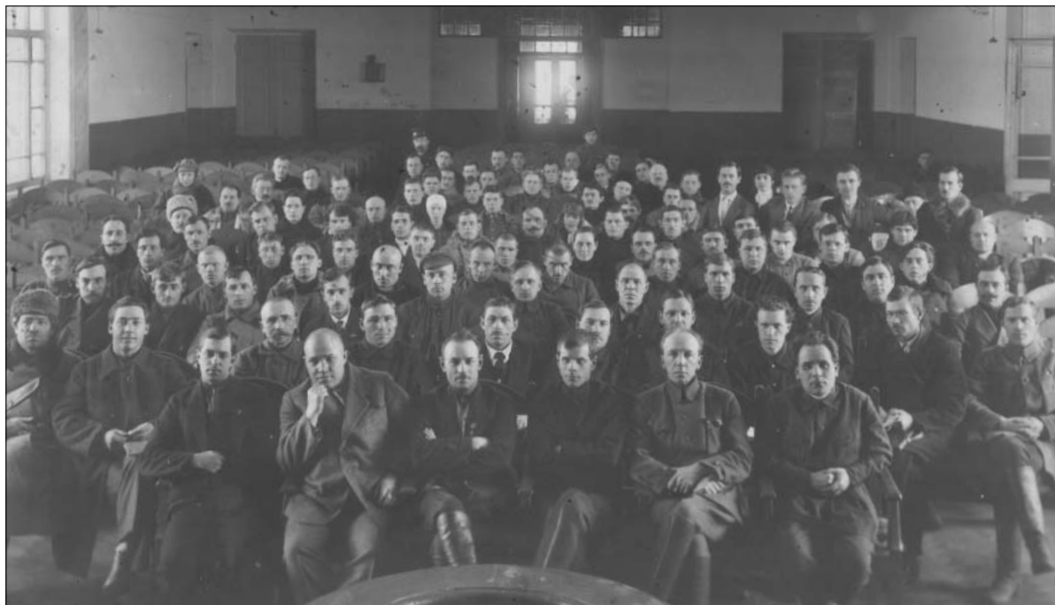
Пленум Симбирского губисполкома. 1924 г.