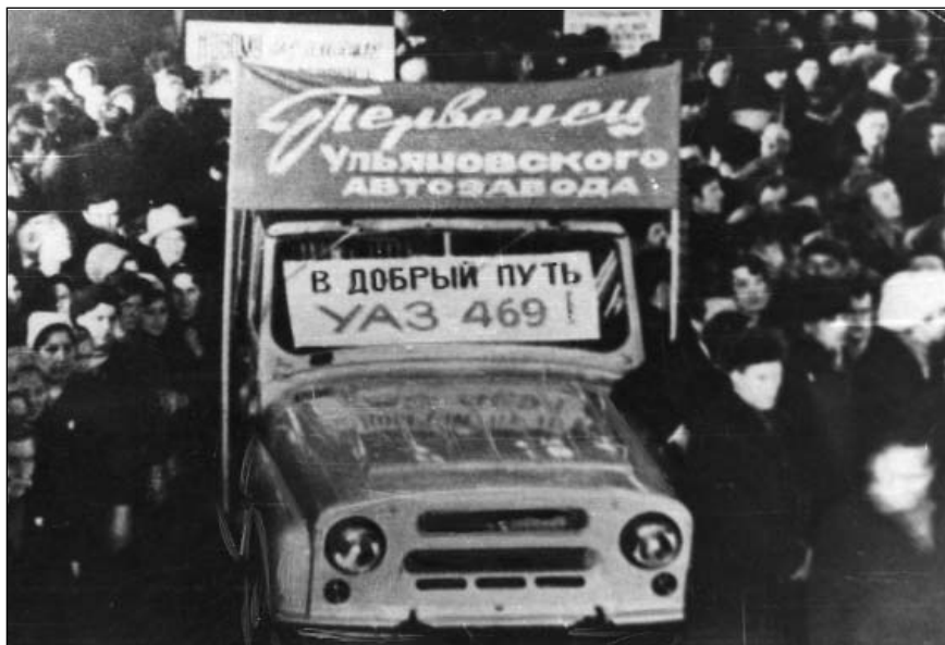
Выход с конвейера Ульяновского автомобильного завода первого автомобиля УАЗ-469. Декабрь 1972 г.