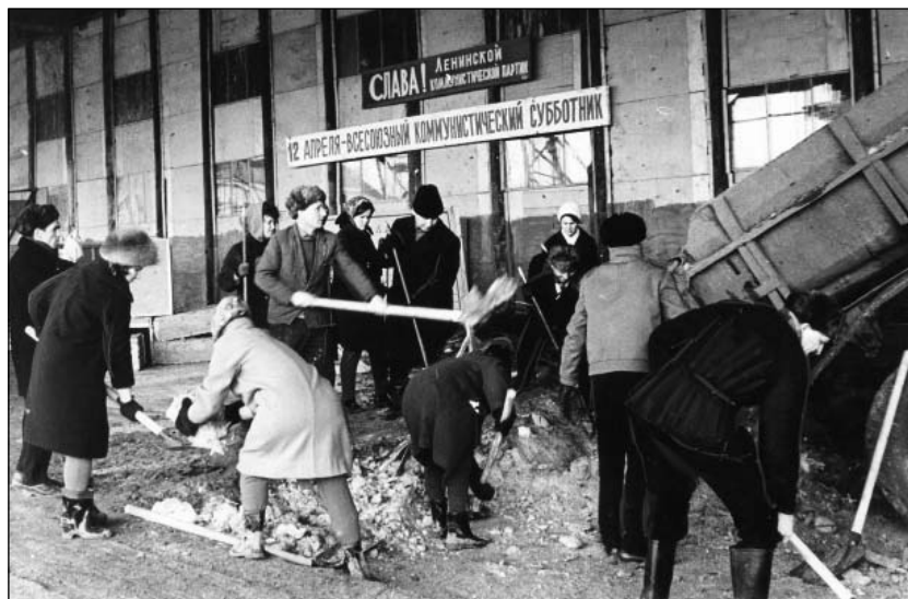
Всесоюзный коммунистический субботник на строительстве Ленинского Мемориала. 12 апреля 1969 г.