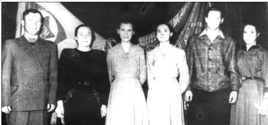
Бригада коммунистического труда Ульяновского завода малолитражных двигателей. 1958 г.