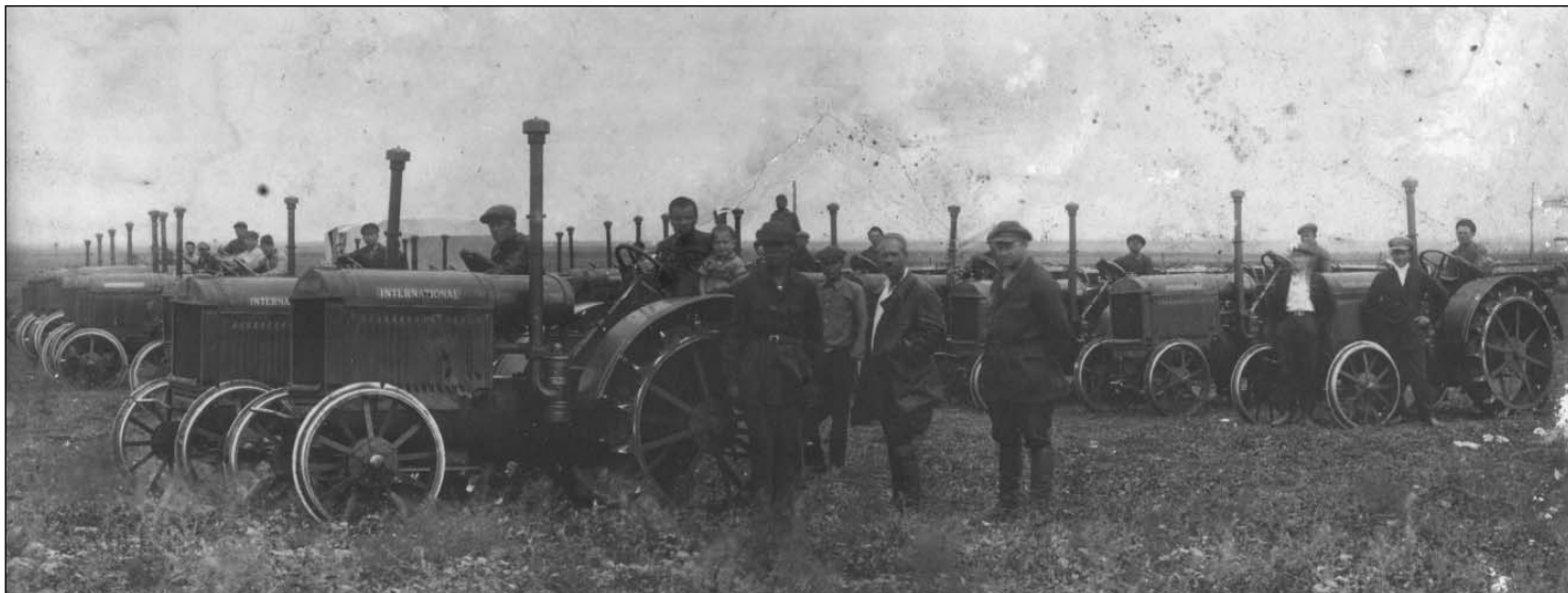
Трактористы Якушкинской машинно-тракторной станции. 1930 г.