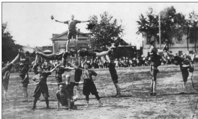
Показательные выступления спортсменов в г. Симбирске. 1920 г.