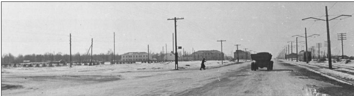
Первый трамвай в Киндяковке. 1957 г.