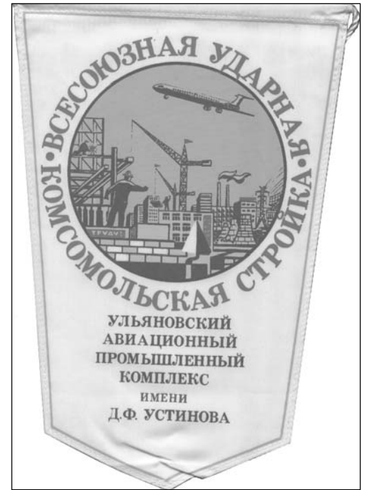
Вымпел Всесоюзной ударной комсомольской стройки

Демонстрация трудящихся, посвященная годовщине Октябрьской социалистической революции 1984 г.