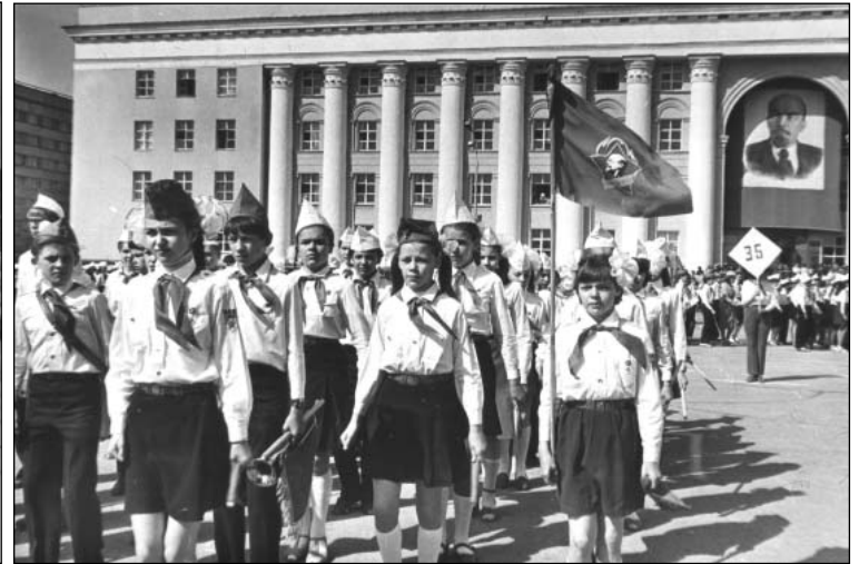
Участники парада пионеров, посвящённого 113-й годовщине со дня рождения В. И. Ленина