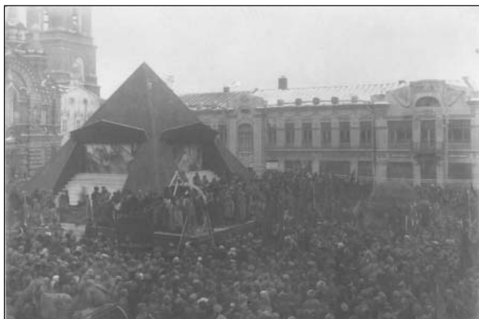
Митинг на ул. Гончарова в г. Симбирске, посвященный празднованию годовщины Октябрьской революции. 7 ноября 1919 г.