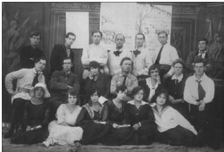
Творческий коллектив драматического театра Симбирского патронного завода. Август 1922 г..