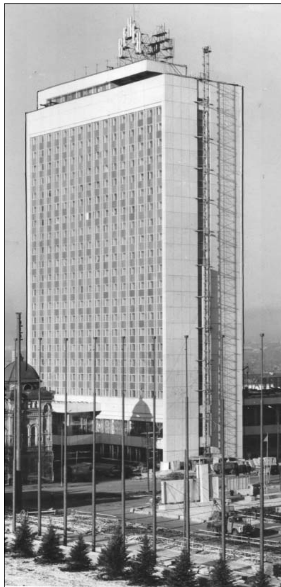
Здание гостиницы Венец. Март 1970 г.