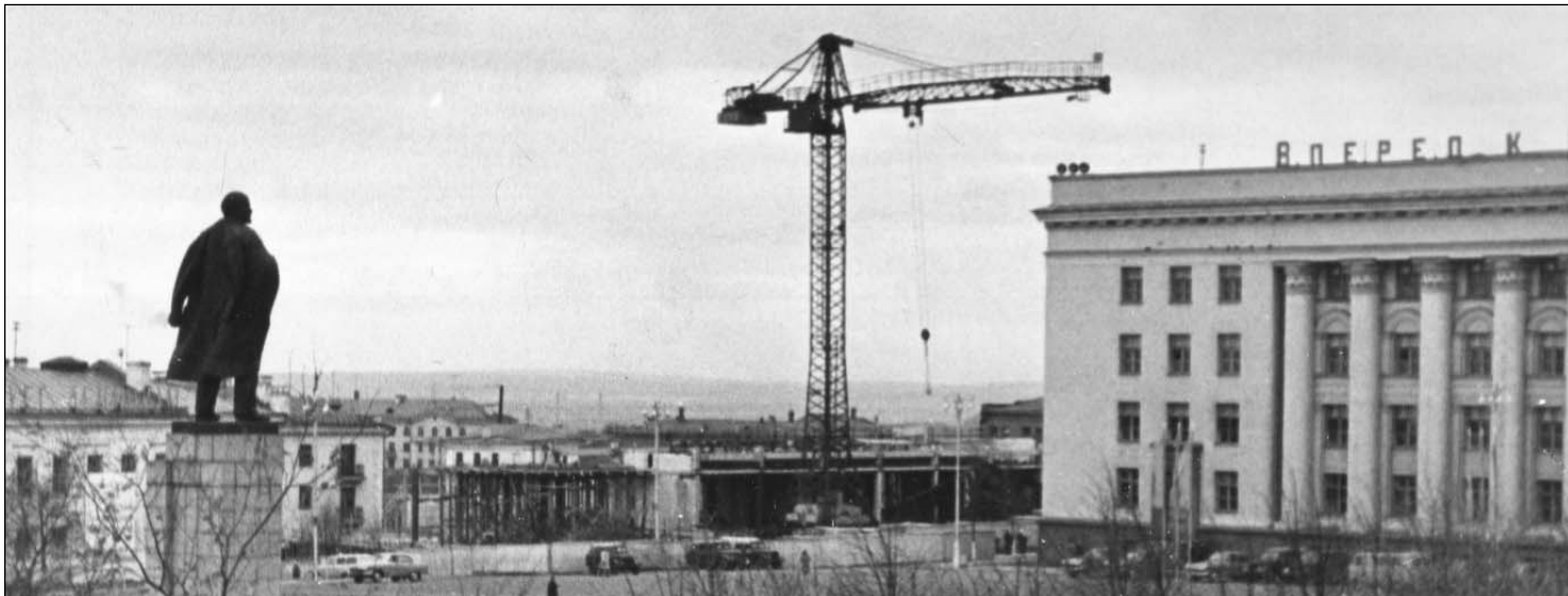
Строительство гостиницы Советская в Ленинском районе г. Ульяновск. 1966 г.