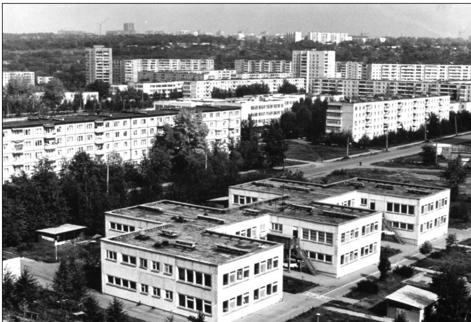
Бригада совхоза Волжанска Ульяновского района. Август 1988 г.