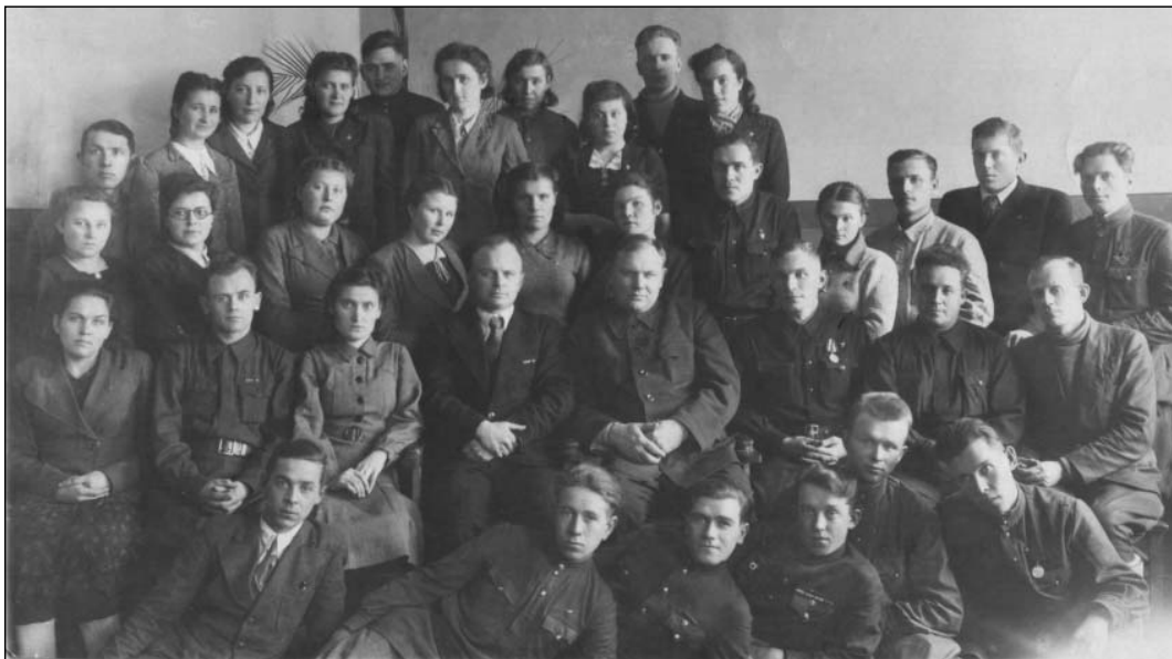
Аппарат Ульяновского обкома ВКПб.