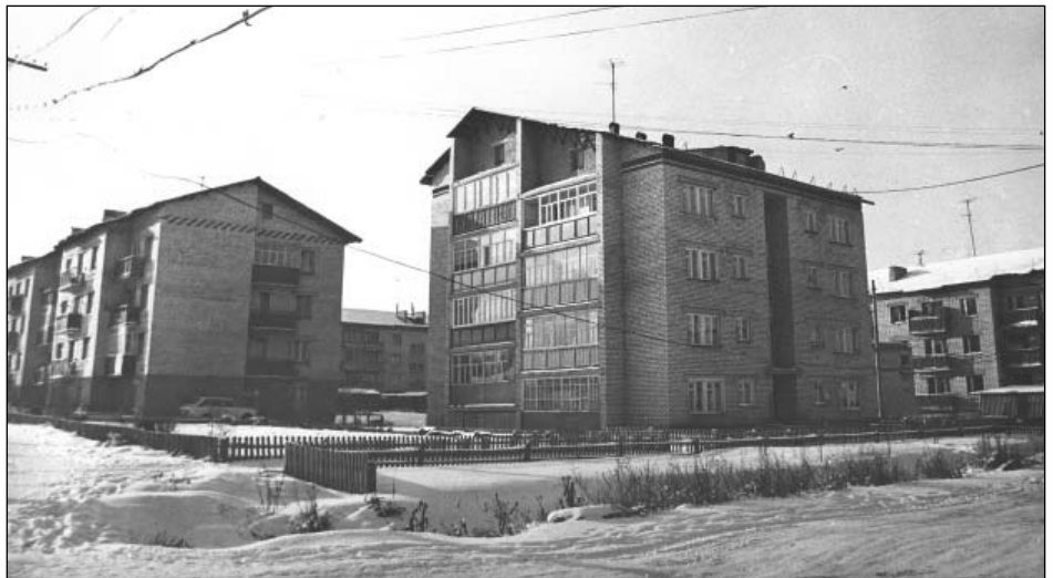
Новые дома по ул. Куйбышева в р.п. Карсун. 1989 г.