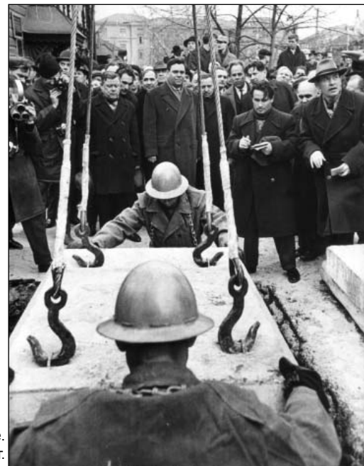
Закладка Ленинского Мемориала в г. Ульяновске. 22 апреля 1967 г.