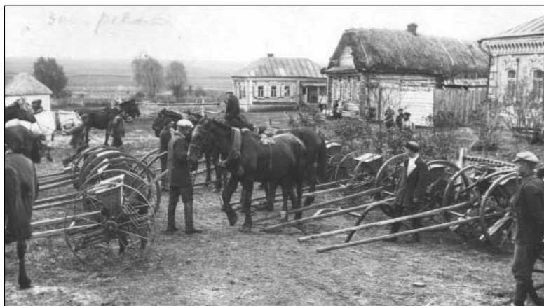
Смотр готовности колхоза к весенне-полевым работам. 1932 г.