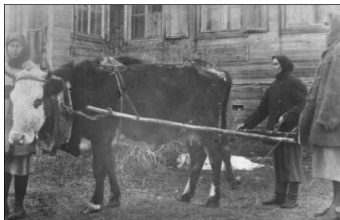
Колхозница с запряжённой для работы коровой. 1933 г.