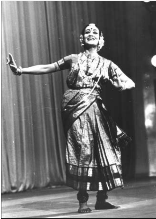
Выступление танцовщицы – участницы фестиваля Индии в СССР Судхарани Радхуладхи в Большом зале Ленинского Мемориала. 15 июля 1987 г.