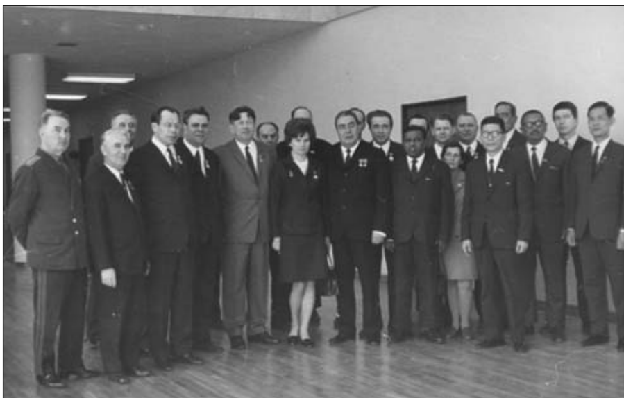
В. Н. Терешкова среди руководителей Ульяновской области в г. Ульяновске.