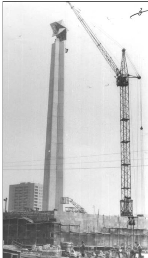
Строительство Обелиска Вечной Славы в г. Ульяновске. Апрель 1975 г.