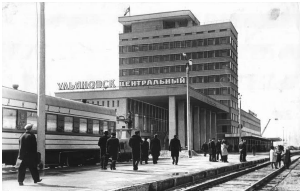
Новое здание Железнодорожного вокзала Ульяновск - Центральный. 10 апреля 1970 г.