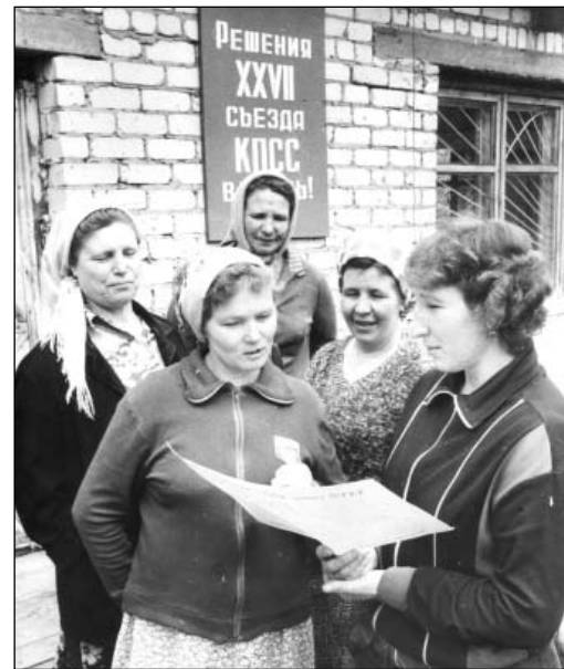
Работницы животноводческой фермы совхоза Енганаевский Чердаклинского района Ульяновской обл. изучают документы 27 съезда КПСС. Март 1986 г.