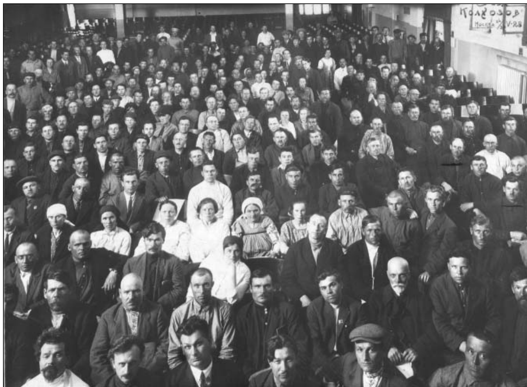
Группа делегатов 3-го Всероссийского съезда колхозов. 24 мая 1928 г.