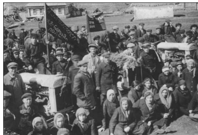
День первой борозды в Языковском совхозе. Апрель 1930 г.