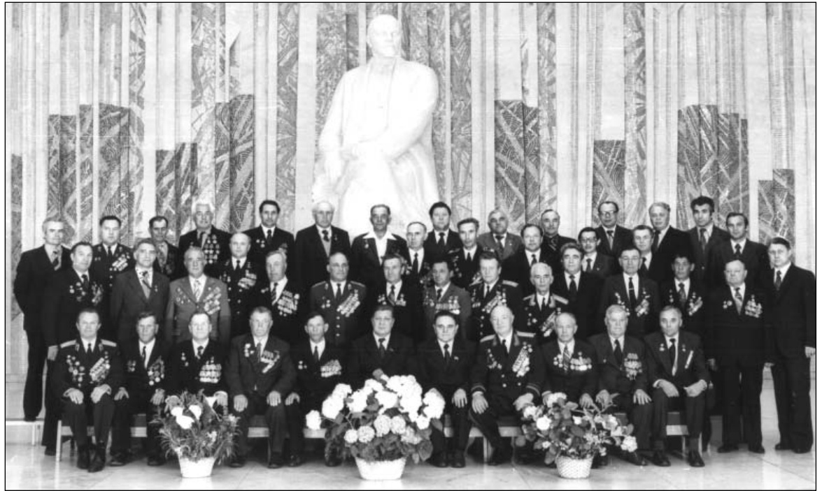
Группа Героев Советского Союза и кавалеров трёх орденов Славы среди членов бюро Ульяновского обкома КПСС. Май 1980 г.