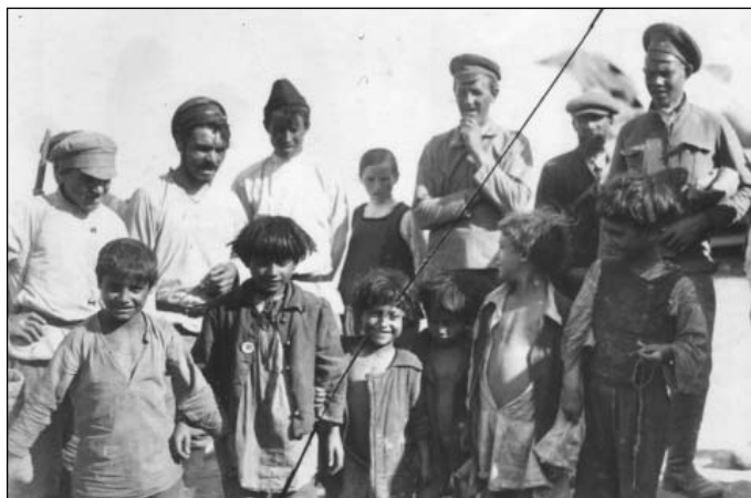
Группа детей г. Симбирска. 1920 г.