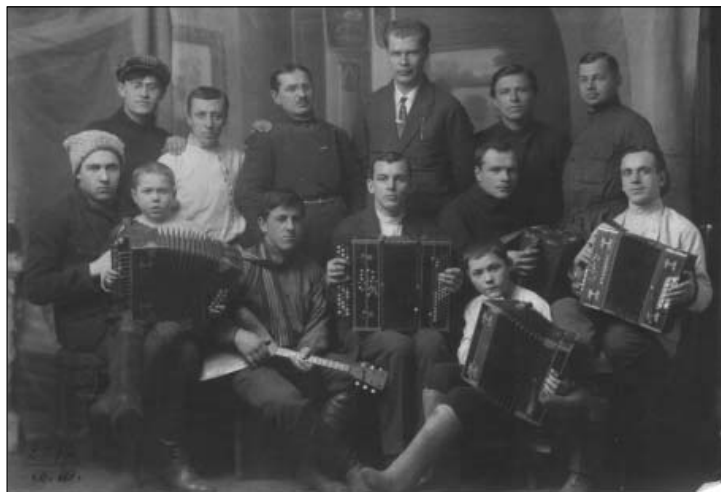
Группа гармонистов г. Ульяновска. 1926 г..