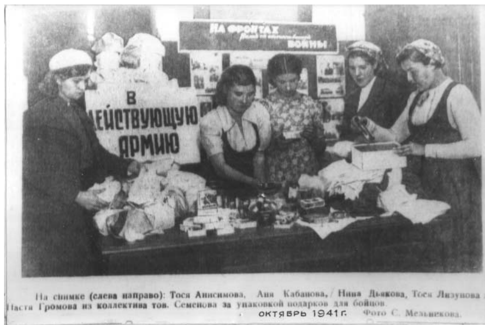
Упаковка подарков в действующую армию. Октябрь 1941 г.