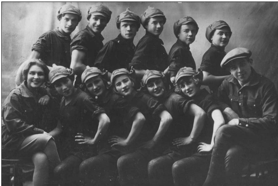
Участники концертной группы школы им. К. Маркса г. Ульяновска. Июль 1930 г.