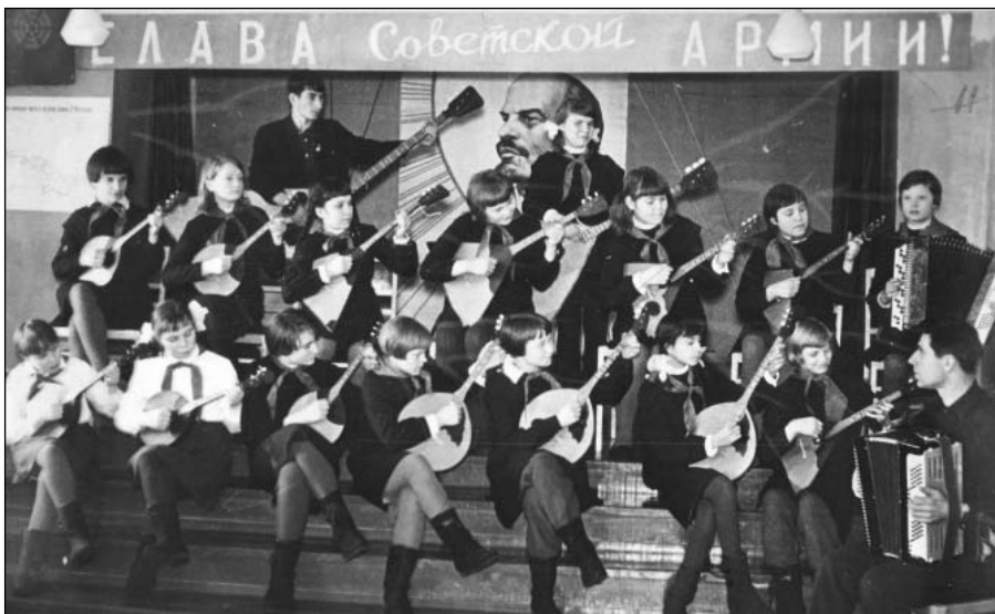
Выступление музыкального ансамбля детского дома им. А. Матросова. Село Ивановка Ульяновской области. 1977 г.