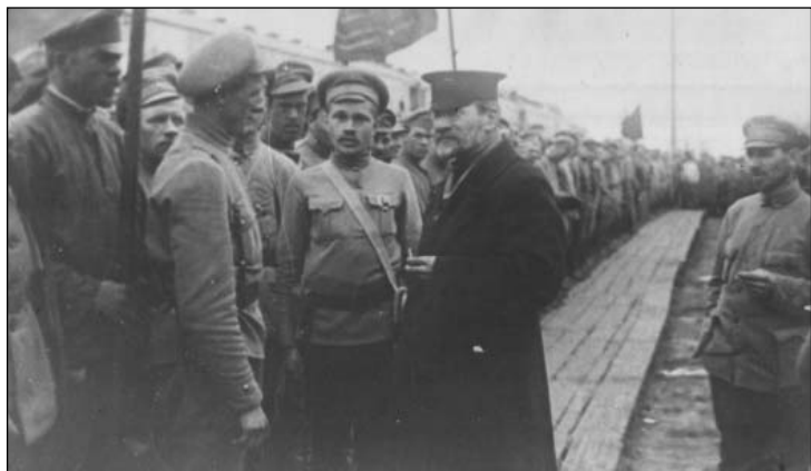
Председатель ВЦИК М. И. Калини в группе красноармейцев на станции г. Алатырь Симбирской губернии. Май 1919 г.