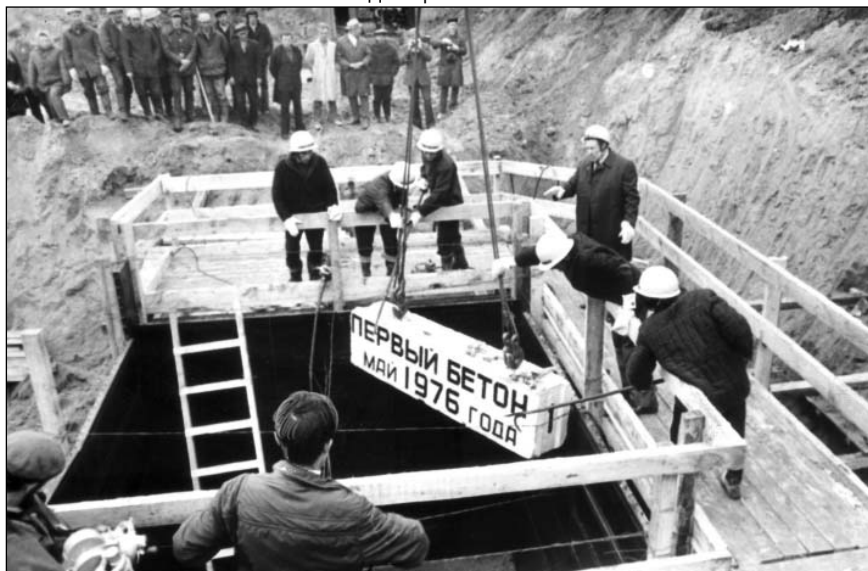
Закладка Ульяновского Авиационно-промышленного комплекса (УАПК) в Заволжском районе г. Ульяновска. Май 1976 г.