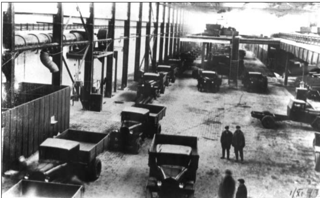
Главный конвейер Автомобильного завода. 1947 г.