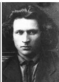
ВАРЕЙКИС Иосиф Михайлович февраль 1918 – август 1920