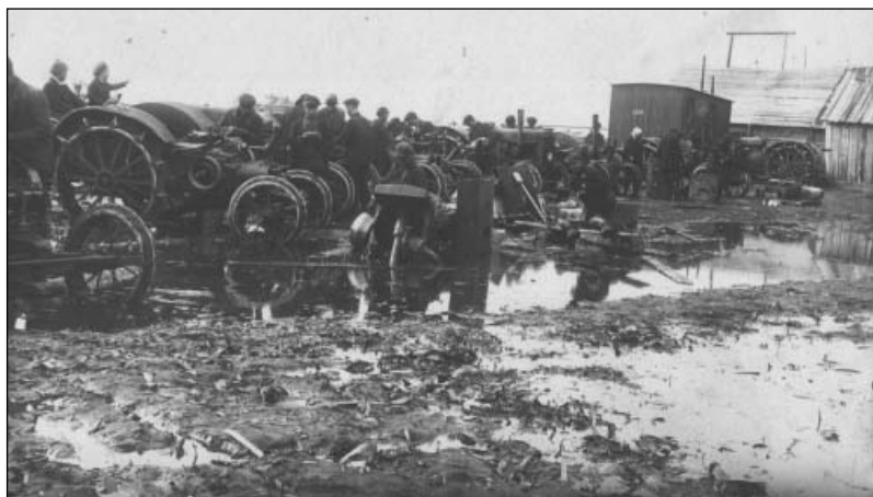
Выровская машинно-тракторная станция. Ремонт тракторов. 1930 г.