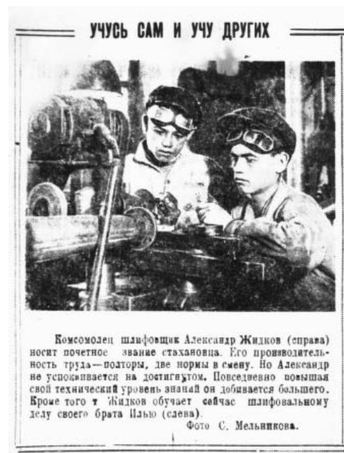
Учусь сам – учу других.