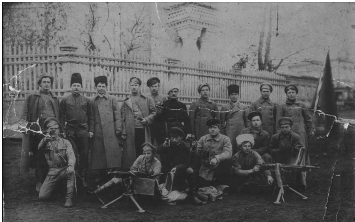
Красноармейцы в с. Промзино Симбирской губернии. 1919 г.