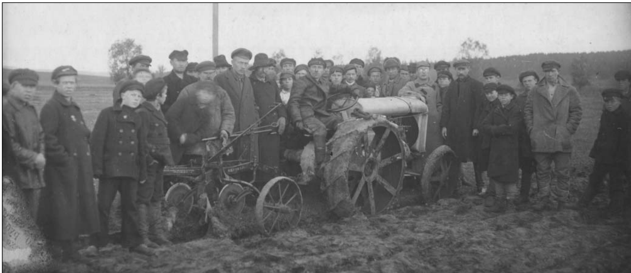
Сельскохозяйственная выставка в с. Жадовка Карсунского уезда. Первый трактор Фордзон. Октябрь 1926 г.