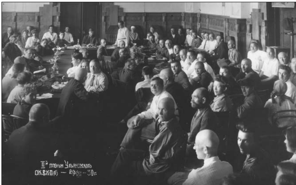
Пленарное заседание Ульяновского окружкома ВКПб. 29 июля 1930 г.