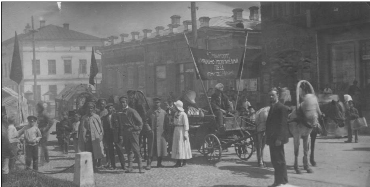
Выдача пайка голодающим детям в Симбирске. Май 1920 г.