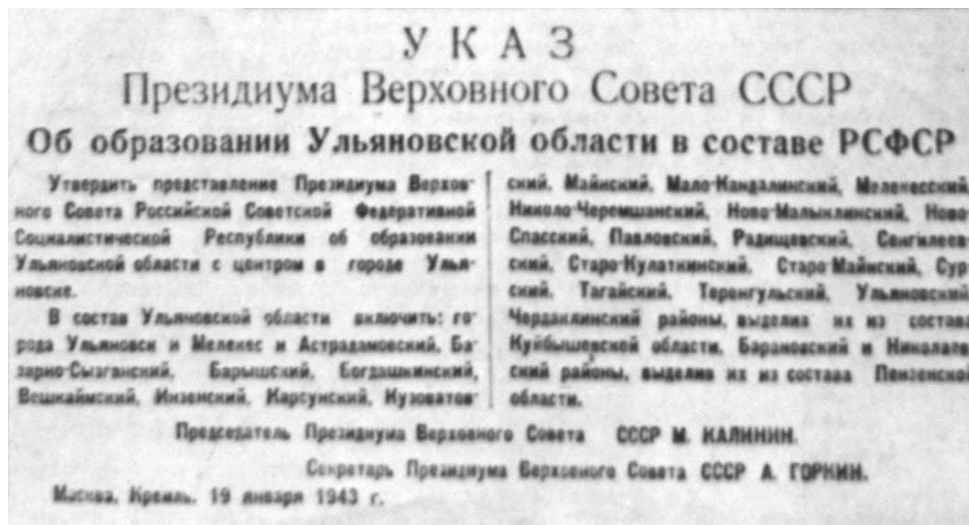
Первая полоса газеты Ульяновская правда с Указом Президиума ВС СССР об образовании Ульяновской области.