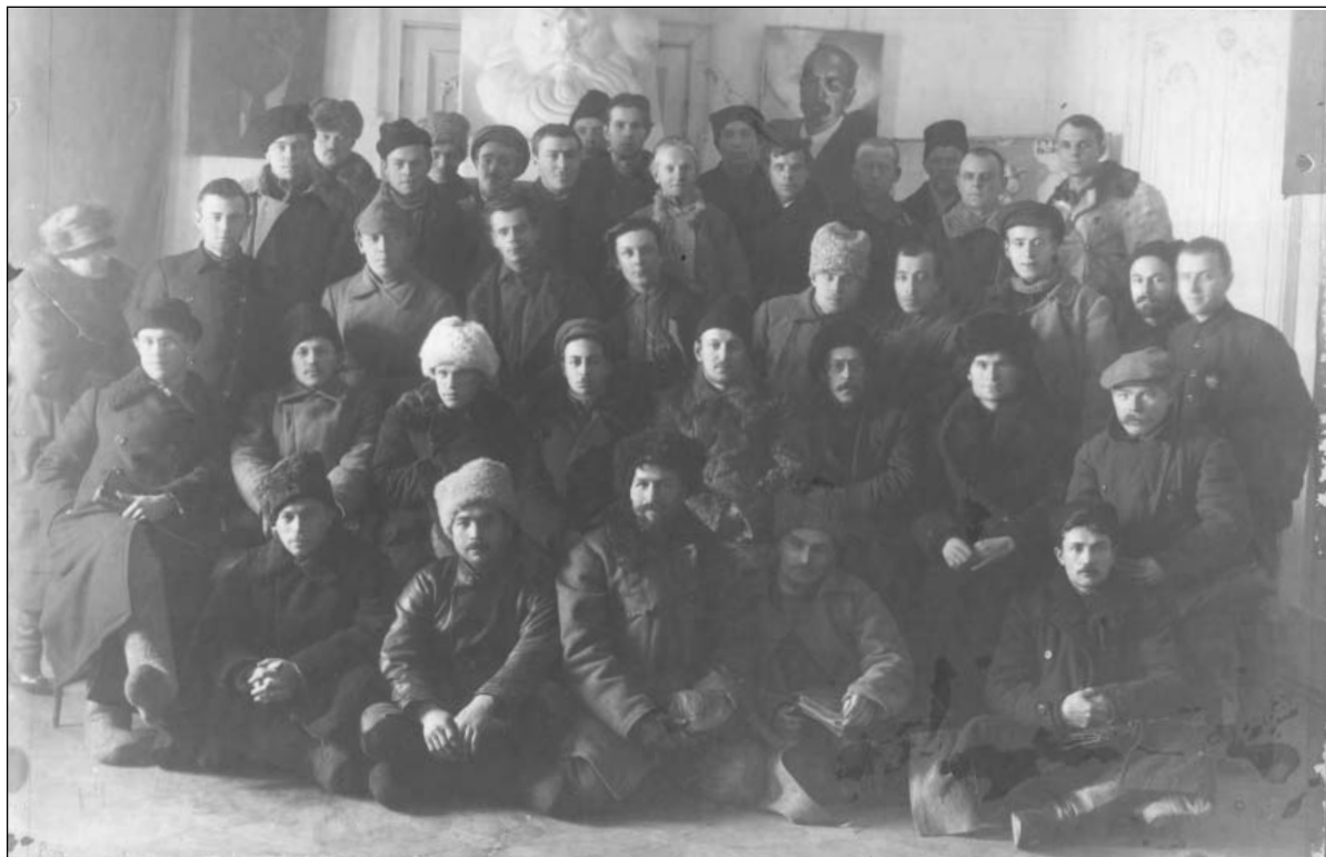
Делегаты 8 губернской партийной конференции. 20 ноября 1921 г.