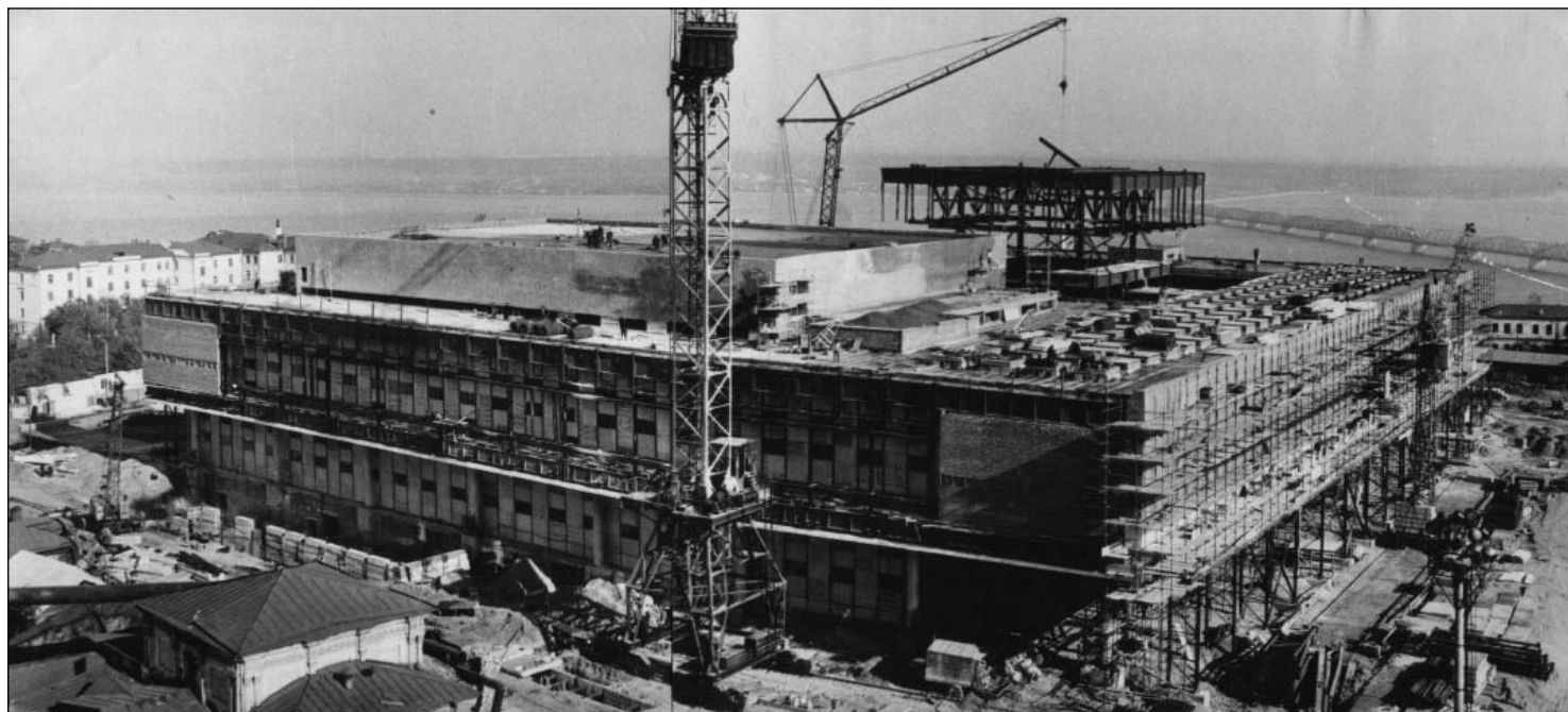
Строительство Ленинского Мемориала в г. Ульяновске. Март 1969 г.