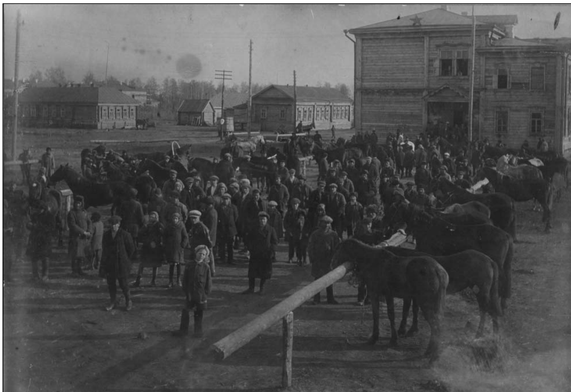
Майнская районная сельскохозяйственная выставка. Октябрь 1932 г.