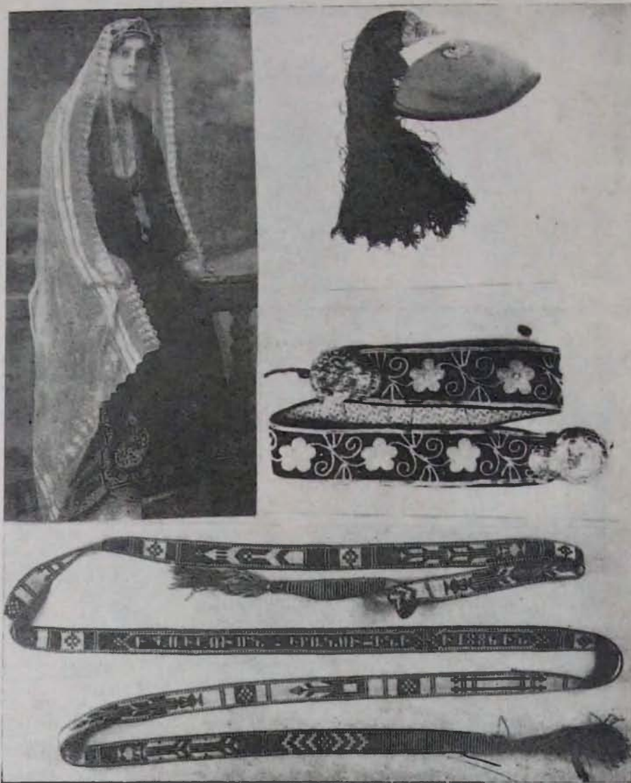
Նկ. 8. Կնոջ տարազ, Ղենիճական, XX դ. սկիզբ