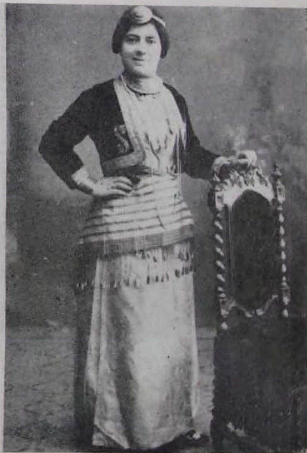
Նկ. 4. Կնոջ տարազ, Տրապիզոն, XIX դ. վերջ