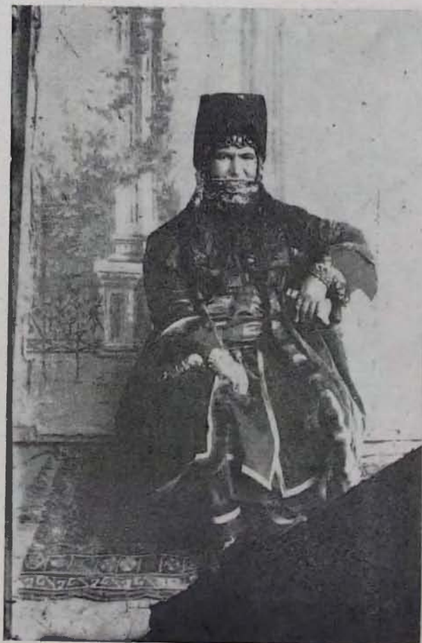
Նկ. 3. Կնոջ տարազ, Գողթն, XIX դ. վերջ