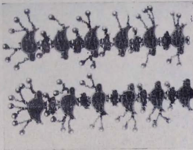
Նկ. 7. Շամշիկ, կնոջ վերնազգեստի զարդ, արծաթ, Վասպուրական, XIX դ. վերջ