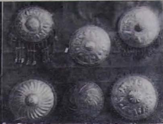
Նկ. 5. Կեօիկ զլխազարդ, արծաթ, Սյունիք, XIX դ. Նկ. 6. Գլխի թասեր, արծաթ, Վասպուրական, XIX դ. վերջ