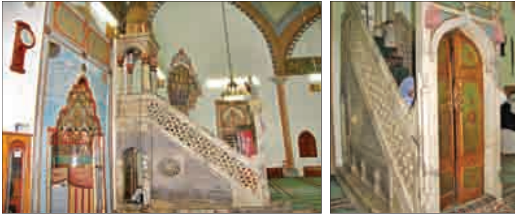
Şekil 16. Minber.

Kuzey cephede kare planlı harim bölümünün ortasında yer alan mermer mihrap ve mihrabın hemen doğusunda yer alan mermer minber, İstanbul'dan getirilen mermerden yapılmıştır (Beksaç 1992: 363) Özgün mermer minberinin kapısı abanoz ağacından yapılmış olup, hatayi motiflerle bezelidir (Şekil 16). Beksaç (1992: 363), Bekiriye Camii adlı makalesinde, Osmanlı valisi için bir mahfil ve altı porfir sütun tarafından taşınan bir kürsü inşa edildiğini belirtmektedir. Caminin güneydoğu ana beden duvarına bitişik olan mahfil günümüze kadar korunmuş olup, anılan makalede belirtilen kürsü günümüzde mevcut değildir.