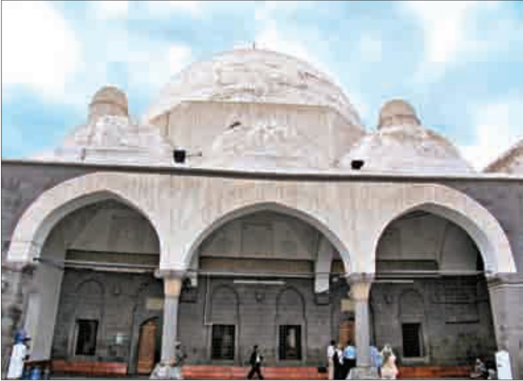
Şekil 5. Camii güney cephesi (Avlu kuzey görünüşü).

Avlu portalinin kuzeyinde bir türbe bulunmaktadır. Bu türbenin arkasında ise günümüzde etrafı tamamen yüksek duvarlarla çevrili 19 mezarın bulunduğu harap bir hazire yer almaktadır. Bu haliyle Bekiriye Camii, güneyde avlu, kuzeyde yol, batıda hazire ve doğuda sonradan yapının ana beden duvarına eklenen, günümüzde ise kadınların ibadet etmesi için ayrılmış, kuzeydeki yol aracılığı ile caminin dışından ulaşılan bir mekân ile çevrelenmiştir. Avlunun kuzeyinde caminin üç kubbeli son cemaat bölümü, güneyinde su deposu ve abdest alma bölümü ve hamam olduğu düşünülen dört kubbeli bir yapı, batısında taş kapı ve doğusunda revaklı bir bölüm bulunmaktadır (Şekil 5-6).