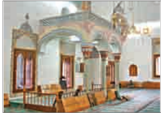
Şekil 15. Müezzin mahfeli.