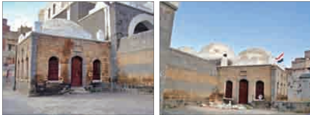
Şekil 18. Avlu duvarının kuzeyinde yer alan türbe (solda) ve güneyinde yer alan yapı (sağda).