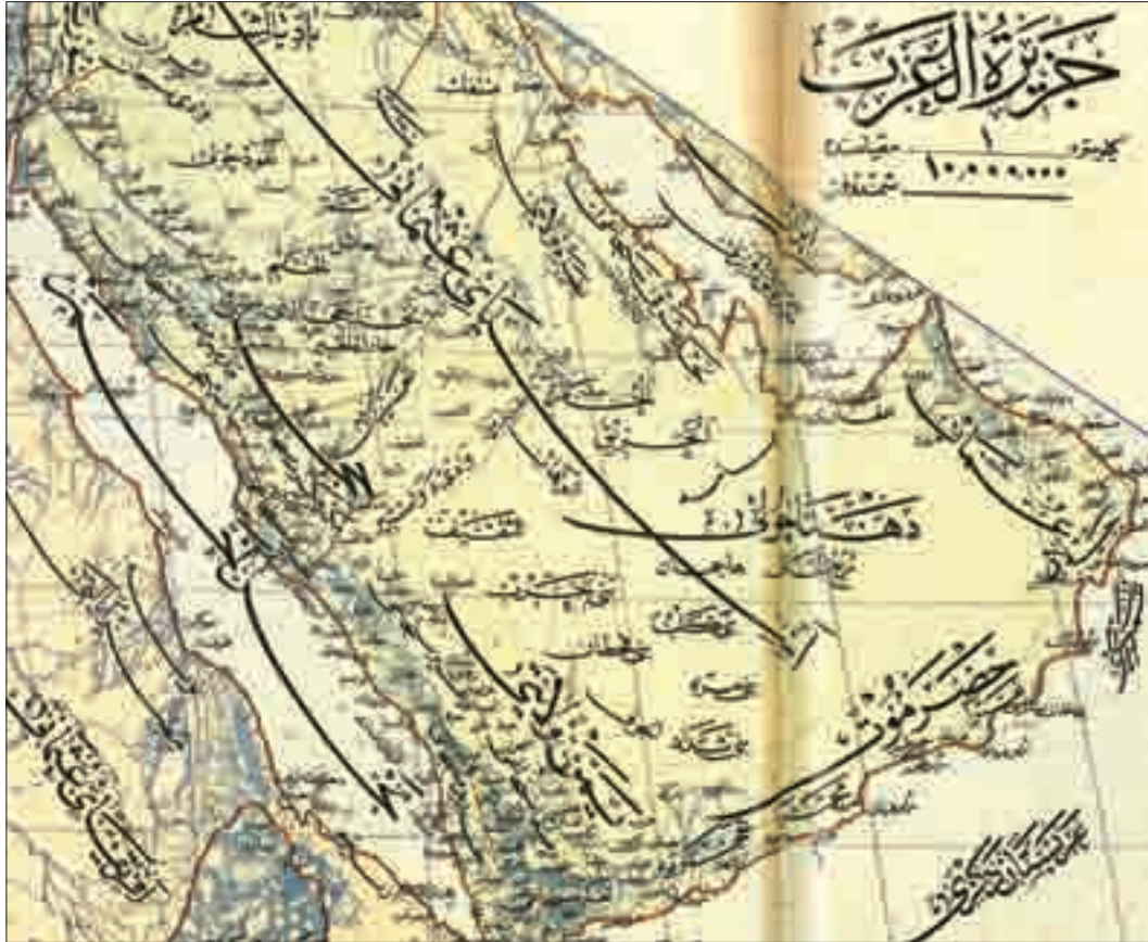
Şekil 1. Osmanlı idaresi döneminde Hicaz ve Yemen Vilayetlerini gösteren harita (Tekin ve Baş 2003: 105).

Bekiriye Camii, Osmanlı idaresi döneminde dört sancağa ayrılan Yemen Vilayetinin, Yemen Sancağında yer alan Sana' kazasında bulunmaktadır (Tekin ve Baş 2003: 107). Arabistan yarımadasının güneybatısında yer alan Yemen Vilayeti, kuzeyde Hicaz Vilayeti, doğuda Arabistan Çölü ve güneyde Aden Bölgesi ile sınırlıdır (Şekil 1).