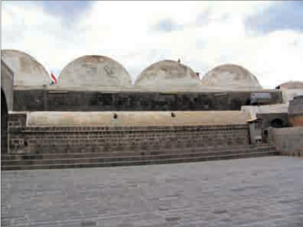
Şekil 6. Avlu güney görünüşü: abdest alma muslukları ve arkada hamam olduğu düşünülen bölüm.

Caminin minaresine ise avlunun doğusunda yer alan revaklı bölümün arkasında uzanan bir geçit aracılığı ile ulaşılmaktadır. Minare klasik Osmanlı üslubunun dışında yerli mimari üslup, malzeme ve teknikte yapılmıştır (Şekil 7). Yerli tuğla işçiliği minarede kendisini göstermektedir. Minare kaidesi, tuğla malzeme işçiliği ile bezeli hat yazılarıyla dikkat çekicidir. 6,00 m. x 5,30 m. en-boy ölçülerindeki minare kaidesi, camii ana beden duvarlarının dışında avlunun doğusunda yapıdan ayrı tek bir kütle olarak inşa edilmiştir. Bu da klasik Osmanlı üslubunun dışındaki bir özelliktir. Beksaç (1992: 363), minarenin, cami yapı grubuna avludan girişin sağlandığı batı cephesi esas alınarak özellikle yapıdan ayrık ve doğu yönünde inşa edildiğini, bu sayede harim ana kubbесinin son cemaat kubbeleriyle birlikte birinci plana çıkarılmasının sağlandığını ve avlu yapı grubunun bir kat daha ihtişamlı görünüm kazandığını, belirtmektedir (Şekil 8). Böylece, Bekiriye Camii; avlulu mekânsal düzenlemesi, üç kubbeli son cemaat yeri ve merkezi kubbeli ana ibadet mekânı ile Osmanlı dönemi mimari özelliklerini yansıtmakta ve avlunun doğu yönünde yer alan çok süslü, tuğla işçilikli minaresi, son cemaat kubbeleri iç yüzeyinde gözlenen tuğla malzeme ile yapılan süslemeler ve avlu giriş portali kubbесini çevreleyen palmet süslemeler ile arabesk etkinin gözlemlendiği yerel ve Osmanlı sentezini içermektedir.