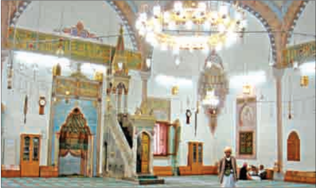
Şekil 10. Harim kuzey cephe.