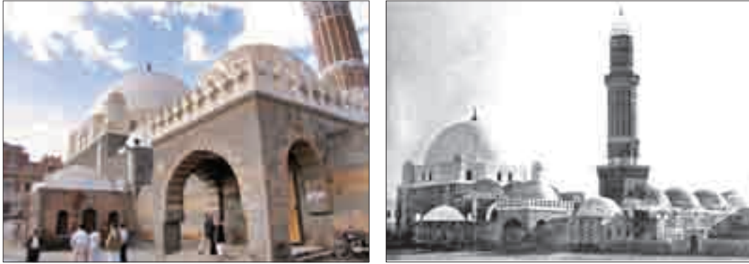
Şekil 8. Yapı grubunu gösteren fotoğraflar.

Yapı 1872 yılında, ciddi ve büyük ölçekli bir restorasyon müdahalesi geçirmiştir. Harim bölümü zemin kotunun yükseltilmesi bu dönemdeki bir müdahaledir 55 . Avlu taş kapısındaki onarım kitabesinden de anlaşılacağı üzere, son yıllarda bakım onarım çalışmaları devam etmiştir. Mermer sütunlu ve bezemeli alçı mihrabın bu son yıllardaki onarım sırasında yağlı boya ile boyandığı düşünülmektedir.