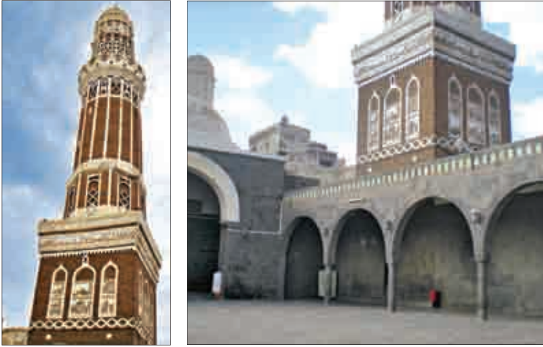
Şekil 7. Camii minaresi.