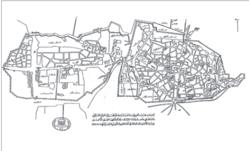
Şekil 2. 1874 tarihli Sana' şehri haritası (Bilge 2009: 88).

Hâlâ Yemen Beglerbegisi olan Hasan dâme ikbâlehu varub vâsıl olunca [ya kadar] Vilâyet-i Yemen'i kemâkân hıfz ve hırâset babında bezl-i maktûr idüb ve mumâileyh hâlâ varan adamlarına mu'âvenet eyleyüb ve ahâlî-yi Vilâyet'le hüsn-i zindegânî idüb ve mevâcib ve defterlerin ve sâyir mâle müte'allık olan umurları müşârunileyh Hasan dâme ikbâlehu ile bizzat mülakat idüb müşâvere eylesin emr idüb büyürdüm ki: Vusul buldukda, mumâileyh varub vâsıl olunca Vilâyet'in hıfz ve hırâsetinde kemâkân bezl-i maktûr idüb ve mumâileyhin hâlâ irsal olunan adamlarına mu'âvenet idüb ve Vilâyet halkıyla hüsn-i zindegânî üzere olub ve mavâcib ve defterlerin ve sâyir mâle ve ahvâl-i memlekete müte'allık olan hususları mumâileyhle bizzat müşâvere etmeden bu canibe teveccüh etmeyesin". 5 Cemaziyülevvel 988 /18 Haziran 1580 (Yavuz 2003: 167).