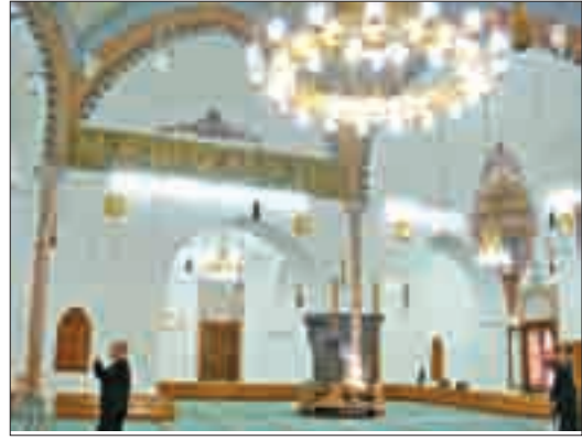
Şekil 11. Harim içi güney cephe. Şekil 12. Harim doğu cephe.