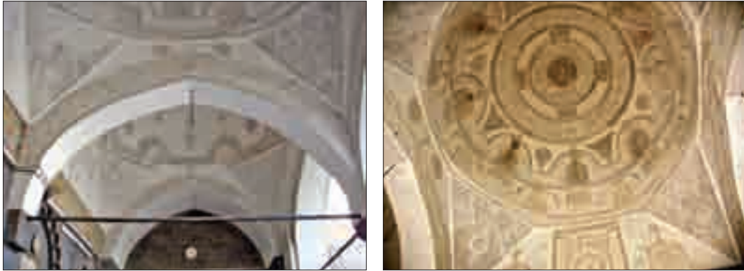
Şekil 17. Camii son cemaat bölümü.

Son cemaat bölümü üç adet kubbe ile örtülüdür (Şekil 5). Bu kubbeleri ortada iki adet sütun ve yan duvarlar arasında yer alan kemerler ile yan duvarlar taşımaktadır. Dışta tüm kubbe yüzeyleri sıvalıdır. Son cemaat bölümü 6,65 m. x 20,00 m. en-boy ve 10,70 m. kubbe yükseklik ölçülerindedir. Harime güney cephede dışta sivri kemerli içte ise dikdörtgen frizli iki adet portal niteliğindeki kapıdan girilir. Ancak günümüzde bu kapılardan sadece batıdaki kapı kullanılmaktadır. Son cemaat bölümünde kubbe içlerinde, kasnaklarda, pendentifler ve beden duvarlarında bulunan yerel tuğla işçiliği ile yapılan bezemeler günümüzde beyaz badana ile kapatılmıştır (Şekil 17).