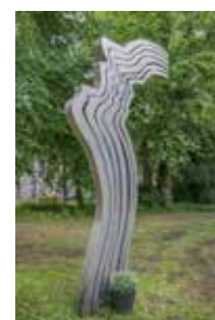
2004 Moord op Theo van Gogh