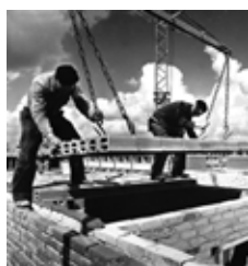
1951 Wederopbouw, start bouw Westelijke Tuinsteden