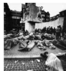
1969 Amsterdam hippiecentrum; soms wel duizend Damslapers op en rond de Dam