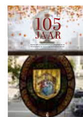
2018 105 jaar IGC, het jubileumnummer komt uit