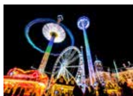
2017 Voor de laatste keer kermis op de Dam

Dit alles lezende, hebben wij zomaar het idee dat deze en meer onderwerpen de komende eeuw onze geesten zullen laten gedijen.