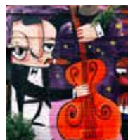
2008 De IGC Jazz Club gaat los