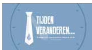
2018 Versoepeling dresscode: tot 17 uur welkom zonder das en in nette jeans #geenbloot