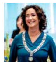
2018 Amsterdam krijgt zijn eerste vrouwelijke burgemeester #FemkeHalsema