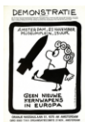
1981 De eerste grote anti-kernwapendemonstratie in Amsterdam #bandebom