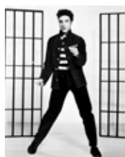
1950 Hoogtijdagen van de Rock-'n roll