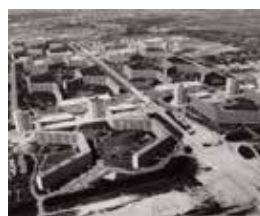
1966 Start bouw Bijlmermeer