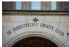
2013 De IGC bestaat 100 jaar en wordt koninklijk