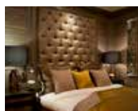
2018 Hotel TwentySeven opent haar deuren #voordeurdelers #nieuwewebvorenuren