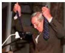
1998 Prins Claus werpt zijn das af