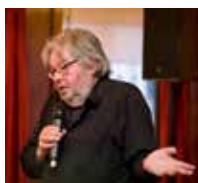
2006 De start van Twitter: tweeten doen wij niet over sprekers