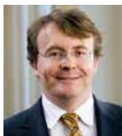
2009 We kunnen nu ook buiten de Club contact maken: chatten via WhatsApp