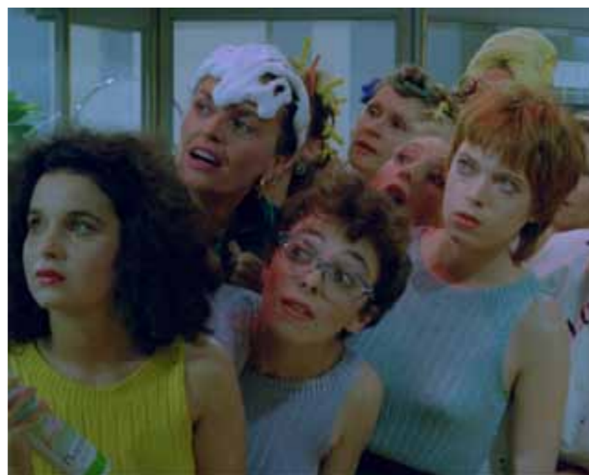
Golden Eighties (Chantal Akerman)