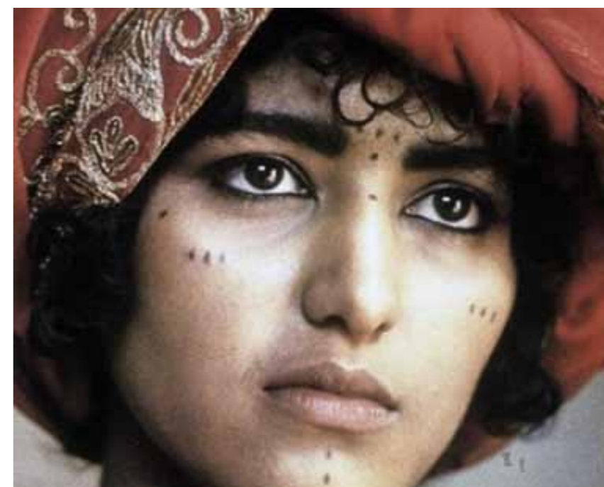
Les Baiseurs du désert (Nacer Khémir)

Oktober , het meesterwerk van Sergei Eisenstein, genoot ook een complete restauratie. Zo kon een volledig nieuwe digitale master aangemaakt worden. Deze zal in 2017 meermaals vertoond worden, waaronder een aantal keer begeleid door een filharmonisch orkest (o.a. in Brugge, Antwerpen en Tilburg).