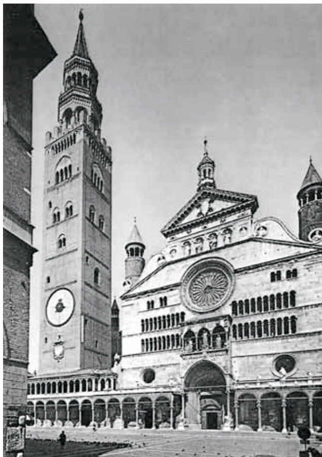
Fig. 1 – Duomo di Cremona e Torrazzo.