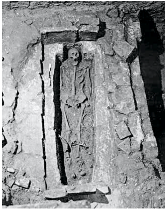
Fig. 5 – Cremona, Torrazzo '80, scavo interno. Tomba appartenente allo strato più antico di sepolture. In effetti si nota la fattura arcaica della struttura; il particolare della nicchia, per il cranio sarà sostituito, nei loculi più recenti, da un mattone posto a mo' di cuscino trasversalmente.

È solo dopo questo che si impostano le prime tombe, le quali peraltro non durano molto, visto che il vescovo Sicardo cita il settore come strada utilizzata in particolari funzioni liturgiche: una fruizione cimiteriale ridotta in stridente contrasto con l'attigua situazione interna riscontrata.