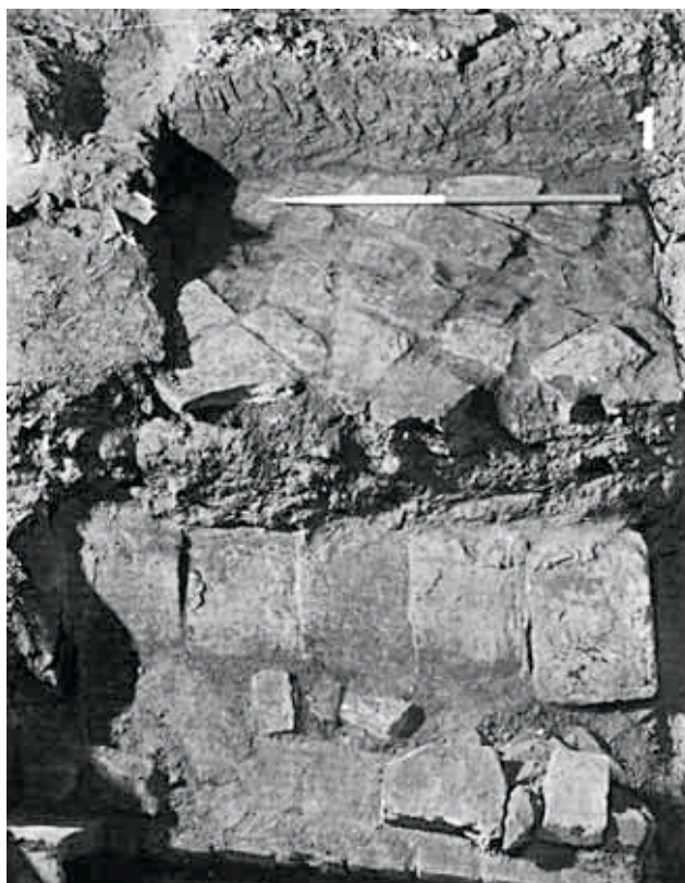
Fig. 4 – Cremona, Torrazzo '80, interno. Il prosieguo dello scavo chiarisce meglio la situazione presentata nella foto precedente: il pavimento con mattoni romani di reimpiego sigilla il sottostante livello di tombe a cappuccina, una delle quali è tagliata dalla trincea di fondazione della torre, indicata dal numero uno.

puccina", pur meno curate che all'interno, limitrofe a tombe a falsa volta, induce a ritenerle coeve.