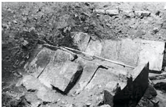
Fig. 3 – Cremona, Torrazzo '78, interno. La foto coglie le prime tombe "a cappuccina" rinvenute durante la campagna '78. Di particolare interesse sono i mattoni allineati in alto che successivamente risulteranno essere la parte residua di un pavimento appartenente ad una fase anteriore la costruzione della torre.

Quando ero intento a questo lavoro mi venne data notizia dal presidente dell'Archeoclub che lavori di sterro in Largo Boccaccino avevano messo in luce sepolture a "cappuccina" limitrofe all'area dello scavo 1978-1980. Seppur tale dato andrebbe valutato avendo a disposizione maggiori elementi che ne limitino la fortuiticità, mi pare corretto fornire un'interpretazione. Il rinvenimento di strutture a "cap-