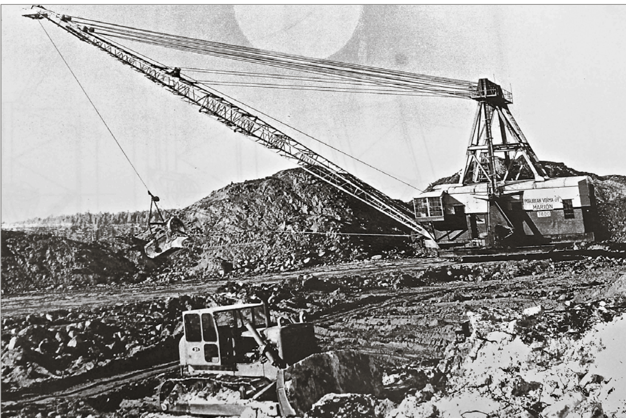
Marion oli komea kone. Sen nostopuomi näkyi selvästi puiden yläpuolelle.

Kolmesta jättikaivinkoneesta kaksi on romutettu. Yksi on myyty Yhdysvaltoihin, jossa se yhä toimii. JR