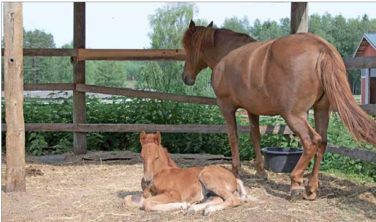
Ylirannan ratsutilalle on syntynyt kesän aikana kolme varsaa. Tässä niistä yksi lepäilee kesäpäivän lämmössä.