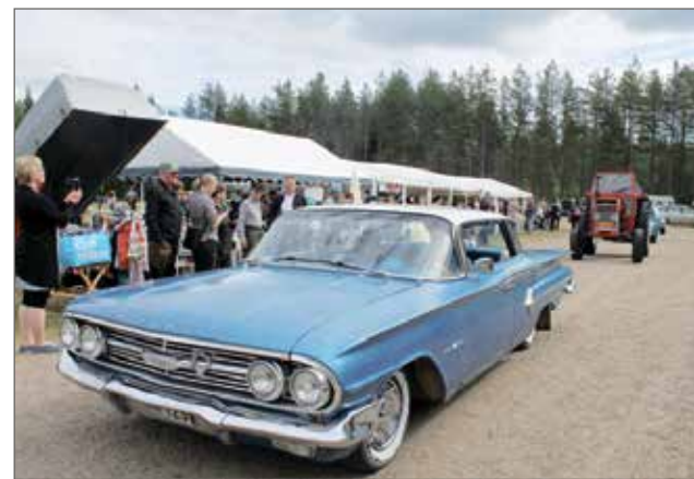
Tuomo Häyrynen ohjasi Chevrolet Bel Airia vuosimallia 1960.