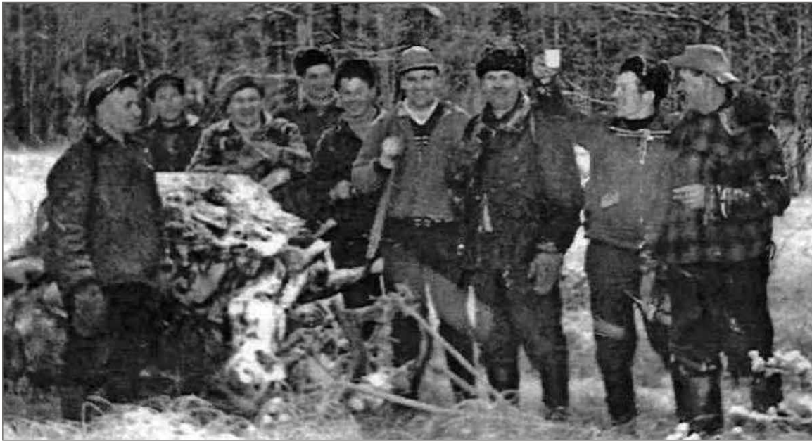
Ylirantalaisia hirvimiehiä avustajineen hirvenkaadolla Palosuolla 60-luvulla