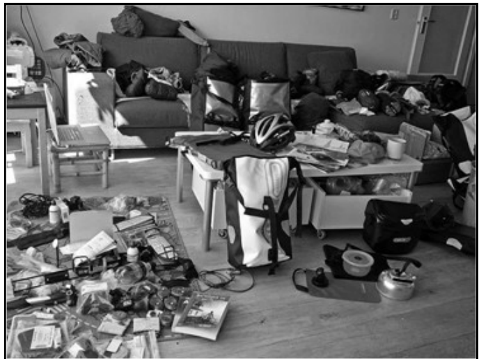
Dit is een voorbeeld van verkeerde bewoning.

Echter stelt Mitros wel een aantal regels op, om te zorgen dat de woningen er enigszins toonbaar uit blijven zien. De mening van Mitros, wat acceptabel is, verschilt nog wel eens met wat u als wijkbewoner vindt. Echter als ik door de buurt loop en kijk naar wat sommige "vaste" bewoners presteren, zijn er tijdelijke woningen die er netter uitzien, inclusief tuinen.