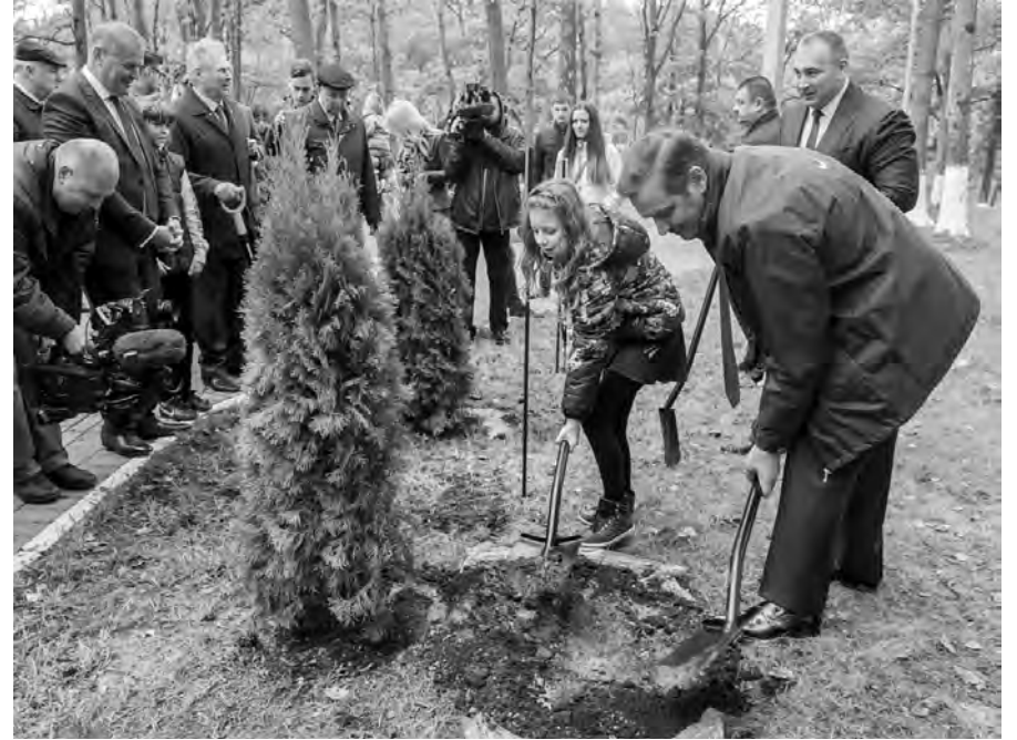
Открытие жилого комплекса Малиновка в Калуге.