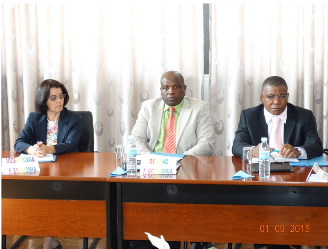
(Direcção da Faculdade de Economia da UMN)