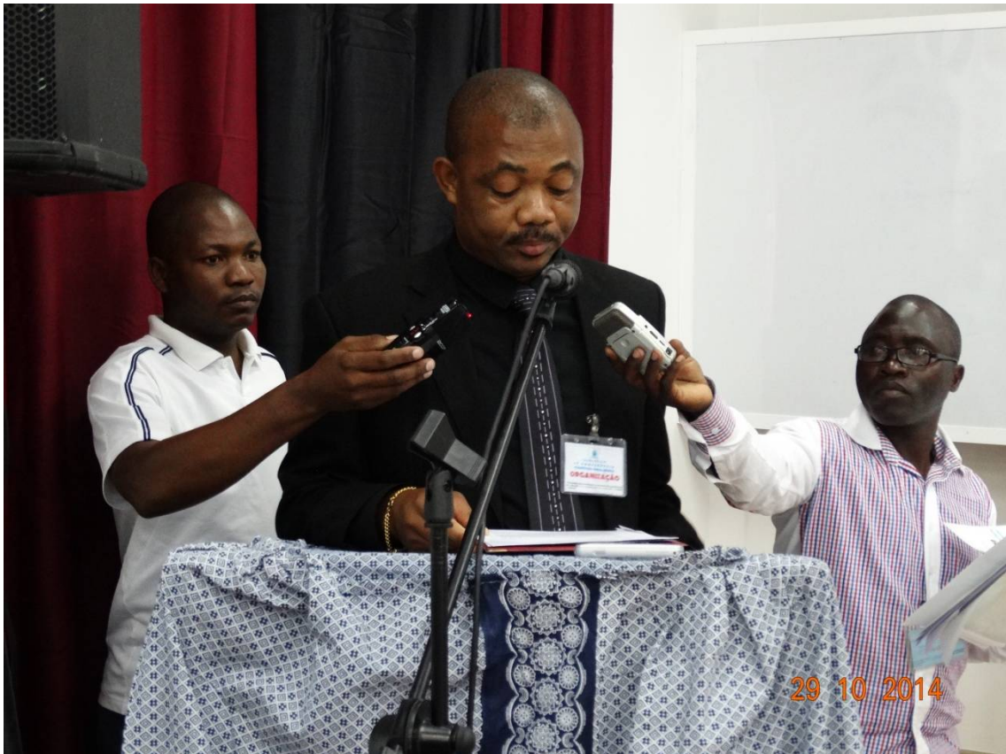
(Decano da Escola Superior Pedagógica do Namibe-UMN)