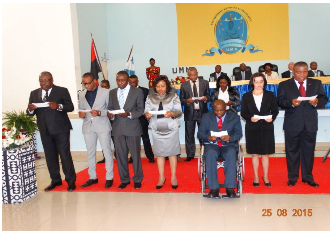
(Tomada de posse dos Decanos e Vice-Decanos da Universidade Mandume Ya Ndemufayo )