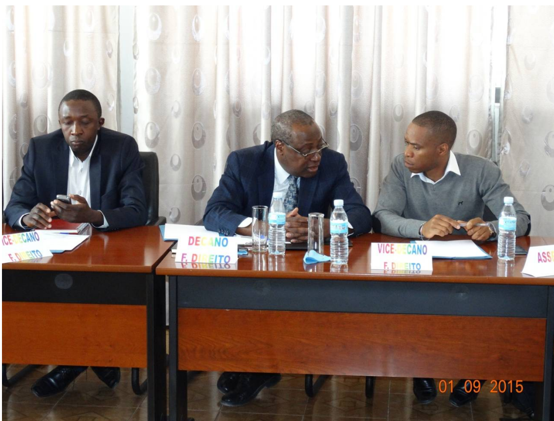
(Direcção da Faculdade de Direito da UMN)