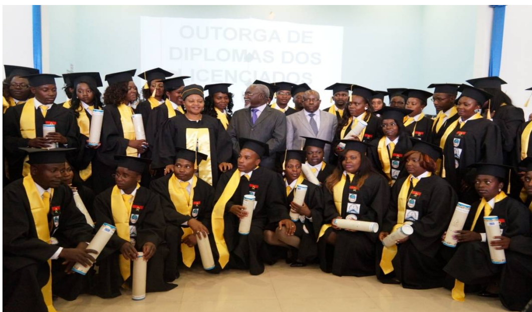
(Outorga de Diplomas aos primeiros Licenciados da Faculdade de Medicina da UMN, presidido por Sua Excelência Sr. Ministro do Ensino Superior de Angola, Prof. Doutor Adão Gaspar Ferreira do Nascimento)

O modelo de gestão da UMN, baseia-se nos princípios e práticas inovadoras que promovam a eficiência, a competitividade, a participação e o espírito de equipa. A acção da UMN realiza-se através de uma cultura de sustentabilidade, de cidadania responsável e de partilha, que valoriza o pensamento crítico e a liberdade de expressão, as vivências culturais, artísticas e desportivas, e a complementaridade dos saberes.