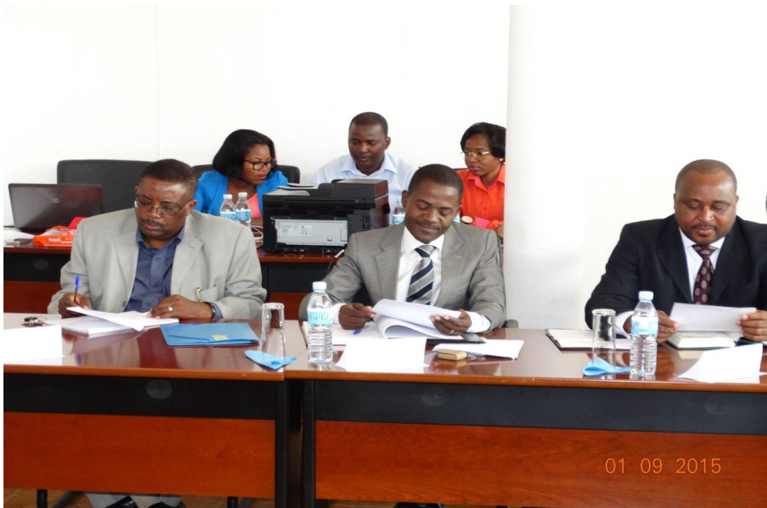
(Direcção do Instituto Superior Politécnico da Huíla-UMN)