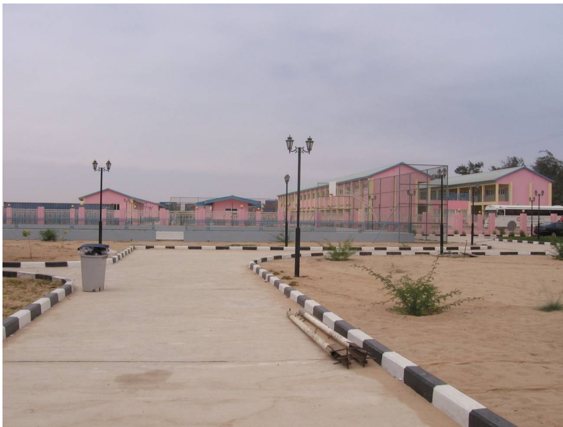
Cidade do Namibe- Escola Superior Pedagógica do Namibe.

Email. direccao@espdn.umn.ed.ao ; areaacademica@espdn.umn.ed.ao ; areacientifica@espdn.umn.ed.ao ; reclamacoes@espdnumn.ed.ao .