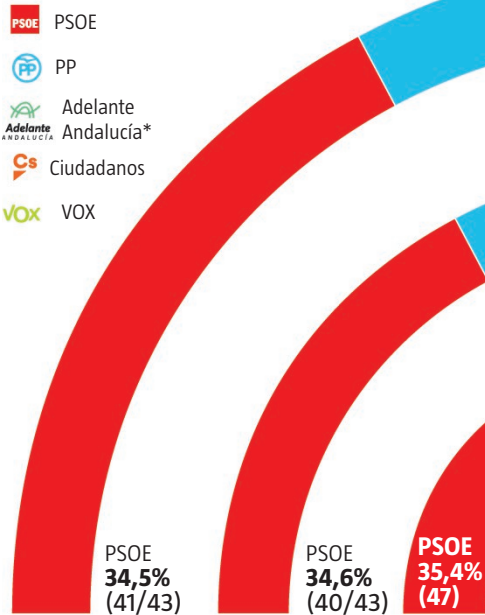
ENCUESTA 19-23 NOVIEMBRE 2018

Porcentaje sobre voto válido y proyección de escaños