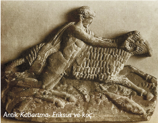
Antik Kabartma- Friksus ve koç

insanların kurban edilmesini istemez, " derken bilicilerden gelen haberin yanlış olduğu da ortaya çıkmış oluyordu. Koç başını sırtına doğru çevirince Friksus binmesi gerektiğini anladı ve hemen koçun sırtına atladı. Bu arada Helle de koşup gelmişti. " Beni de al, " dedi kardeşine. " Beni burada zalimlerin elinde bırakma. "