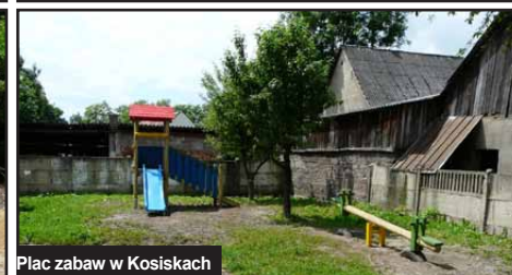
Plac zabaw w Kosiskach