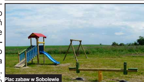
Plac zabaw w Sobolewie