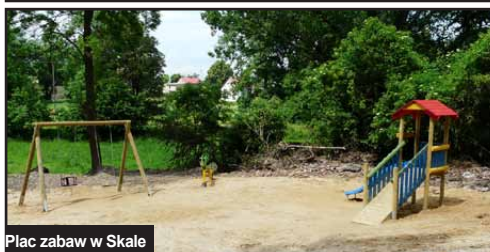
Plac zabaw w Skale