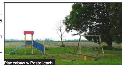
Plac zabaw w Postolicach