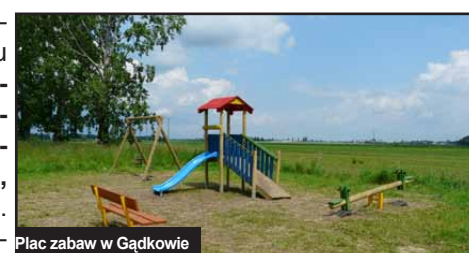
Plac zabaw w Gądkowie

W przyszłości place będzie można rozbudować wyposażając je w kolejne urządzenia.