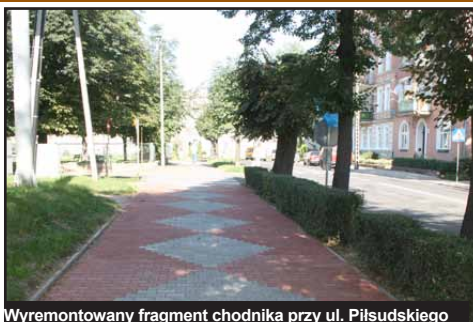
Wyremontowany fragment chodnika przy ul. Piłsudskiego

W Gminie Mściwojów wybudowany zostanie nowy chodnik w Snowidzy (wartość inwestycji - 158 tys. zł), przy drodze powiatowej nr 2792D, o długości 251 metrów. Trwają również uzgodnienia dotyczące zakresu i finansowania chodnika w Mściwojowie. Gmina Mściwojów planuje pozyskać dofinansowanie na ten cel z Programu Rozwoju Obszarów Wiejskich.