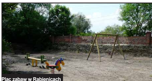
Plac zabaw w Rabienicach