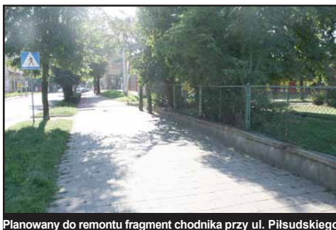
Planowany do remontu fragment chodnika przy ul. Piłsudskiego