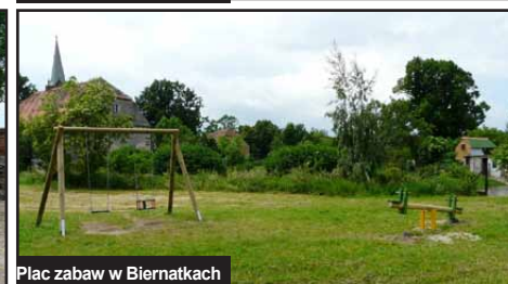
Plac zabaw w Biernatkach