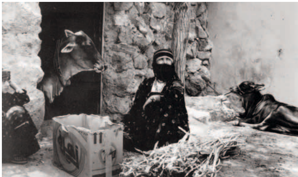
בקר זכו בחצר בית של משפחה יהודית בראייה, תימן, 1993

במכתבו הנזכר של הרב קארפ, שעסק בעניין כאמור בשליחות הרב אלישיב, נאמר במפורש: 'לאחינו הספרדים מכל החוגים אינו נוגע שאלה זו משום שלא קיבלו עליהם מנהג זה'. 97 הרב עובדיה יוסף בדרשתו הקבועה בבית הכנסת ה'יזדים', במוצאי שבת בכ' באדר תשס"ד (13 במרס 2004), ציטט את תשובתו של הרב ואזנר מ'שבט הלוי' 98 ואמר כי אין ספק שהזכו מותר. 99