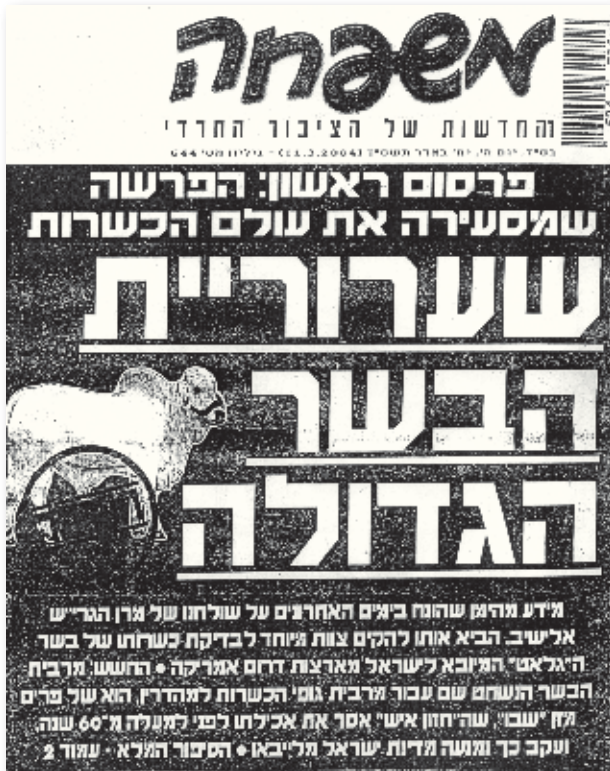
מתוך: 'משפחה', י"ח באדר תשס"ד

הנאכלים 'ממין המותר לפיך'. 124 מדובר כאן במדרון חלקלק ומסוכן, שסופו מי ישרנו. ואכן בשל ההשלכות מרחיקות הלכת והאחריות שעמדה לפתחם של כל הגורמים שעסקו בדבר, מיהרו להסיר פרשה זו – לפי שעה – מסדר היום הציבורי והתורני. 125