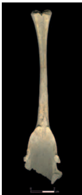
חוליה של זבו מחפירות עיר דוד

בממצא, אך ייתכן שהדיווח עליהן מועט מפני שלא תמיד עמדו החוקרים על החשיבות של סימן זה, ולכן לא ציינו אותו במפורש בדו"חות האוסטיאולוגיים, העוסקים בממצא העצמות. למרות זאת יש כמה דיווחים על מציאת חוליית שכמה של זבו באתרים בארץ.