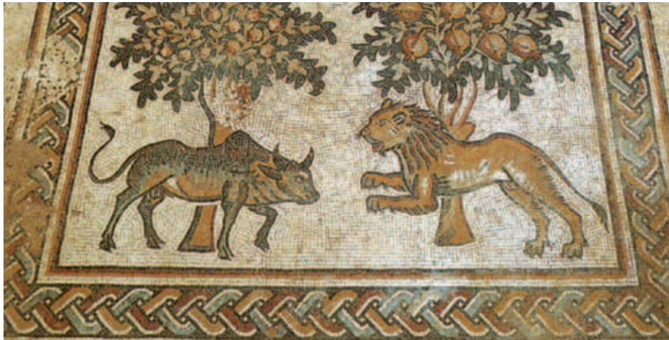
דמות זבו בפסיפס הבמה של הכנסייה על שם הדיאקון תומס, ואדי עיון מוסא, סמוך להר נבו

ד. פסיפסים. בעלי חיים שונים, ובהם בקר זבו, נראים בפסיפסים בכנסיות מהתקופה הביזנטית בבית-גוברין (מח'טאת אלארדי), 32 בבית-שאן (כנסיית המרטיר בתל אצטבה) 33 וכן בעבר הירדן, 34 ולמשל בכנסיית משה בהר נבו שבעבר הירדן (המאה השישית לסה"נ), נראה זבו מתחת לעץ. 35 זבו מופיע גם בפסיפסים בבתי כנסת מתקופת התלמוד בארץ-ישראל: בנירים (מעון), 36 בפסיפס גלגל המזלות (במזל שור) בבית הכנסת שבבית-אלפא 37 בנערן 38 ובחמת-טבריה; 39 כולם מתוארכים למאה השישית לסה"נ, וחלקם פעלו כנראה גם בתקופה הערבית הקדומה. כמו כן מופיע זבו ברצפת בית הכנסת בציפורי, בקטע המתאר הקרבת קרבנות; ליד המזבח יש שור בעל גבנון וקרניים הפונות כלפי מעלה. 40