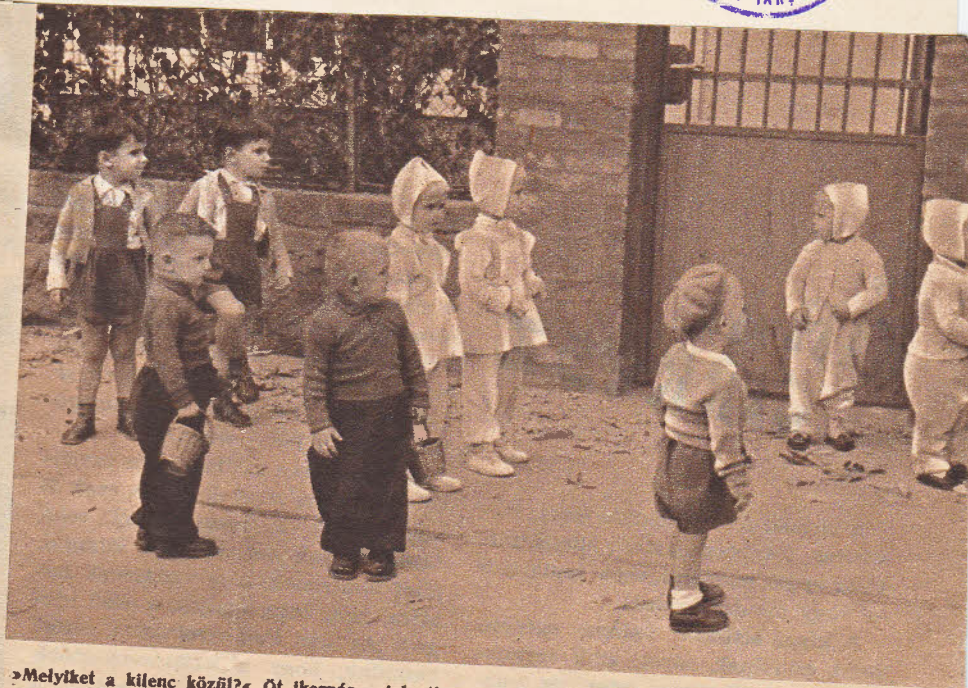
»Melyiket a kilenc közül?« Őt ikerpár a jelentkezők közül. Az egyiknek a »fele« azért hiányzik, mert a fényképezés pillanatában kisért a képből