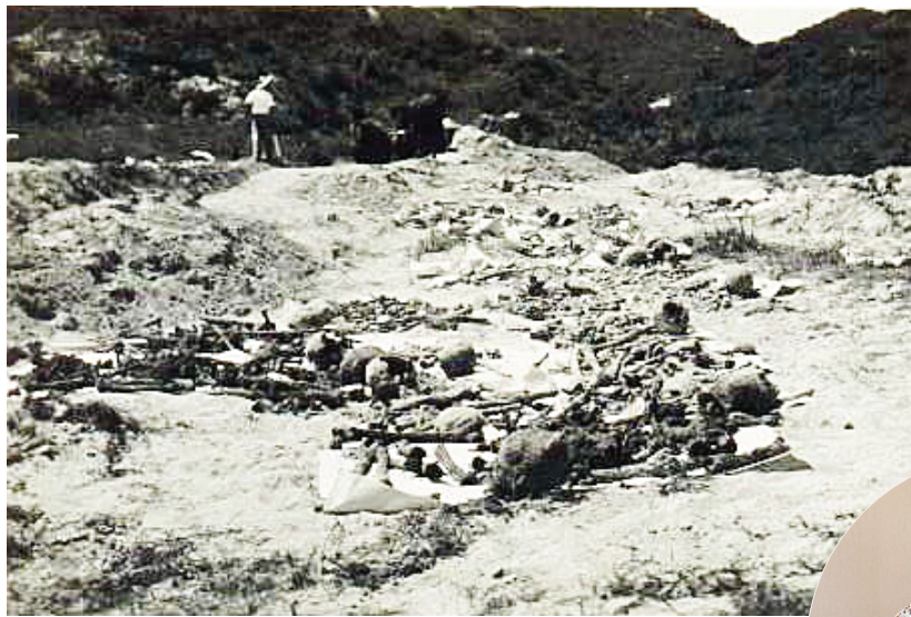
■陆金焯老人拍摄的照片。