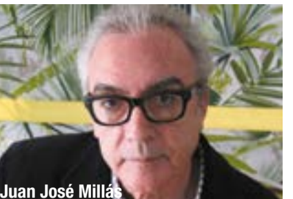
Juan José Millás