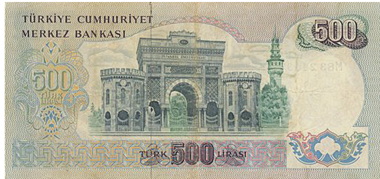
Arka yüzünde İstanbul Üniversitesi ana kapısı çizimi bulunan 500 Türk lirası. Türkiye Cumhuriyet Merkez Bankası'nın altıncı emisyon banknotlarından olan bu banknot 1971 yılında dolanıma girmiş, 1984 yılında dolanımdan kaldırılmıştır.