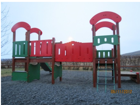
Mynd 1. Kastalinn

Myndirnar sem börnin tóku voru meðal annars af leiktækjum á leikskólalóðinni, öðrum börnum og moldarholu í jörðinni sem þeim fannst þurfa að laga. Á meðan börnin gengu um og tóku myndir ræddu þau hugmyndir sínar hvort við annað og leikskólakennarann. Þau sögðu frá myndunum sínum og af hverju þau tóku þær þannig rökstuddu þau oftast hugmyndir sínar. Til dæmis þegar börnin ræddu um mikilvægi þess að hafa kastalann á lóðinni (mynd 1) sagði önnur stúlknanna: „Við þurfum að hafa kastalann til þess að renna og leika Gulleyjuna“. Börnunum þótti einnig mikilvægt að hafa sandkassann (mynd 2) áfram þó að þau notuðu hann lítið eins og einn drengjanna benti á. Hann sagði að sér þætti leiðinlegt að leika sér í sandkassanum en hann þyrfti samt að vera áfram vegna þess að mörg önnur börn léku sér þar. Myndir 1 og 2 sýna dæmi um myndir sem börnin tóku af þeim leiktækjum sem voru á leikskólalóðinni og þau töldu mikilvægt að hafa þar áfram.