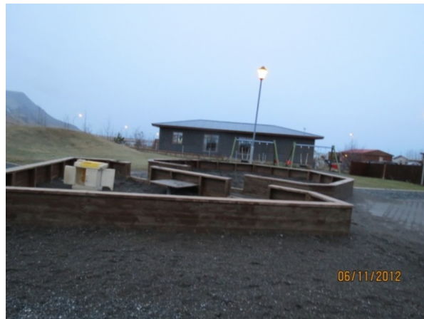
Mynd 2. Sandkassinn

Svipuð umræða átti sér stað um myndirnar sem teknar voru af leiktækjum sem börnin töldu að þyrftu ekki að vera á leikskólalóðinni. Börnin bentu á að rólurnar þyrftu ekki að vera vegna þess að þær væru leiðinlegar en þau vildu frekar hafa annars konar rólu. Börnunum þótti klifurgrindin einnig óþörf vegna þess að hún væri lítið notuð og það væri mjög erfitt að klifra í henni. Myndir 3 og 4 sýna dæmi um ljósmyndir sem börnin tóku af leiktækjum sem þeim þótti óþörf á leikskólalóðinni.