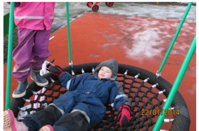
Mynd nr. 8 Kóngulóarála

Ekki var hægt að uppfylla allar óskir barnanna til dæmis höfðu þrjú þeirra teiknað svokallaða aparólu sem þótti ekki hentug á leikskólalóðina. En þegar lagðar voru saman hugmyndir barnanna, starfsfólks leikskólans og hönnunaraðila var niðurstaðan að þeirra mati vel heppnuð leikskólalóð þar sem börn og starfsfólk una sér vel í leik og starfi.