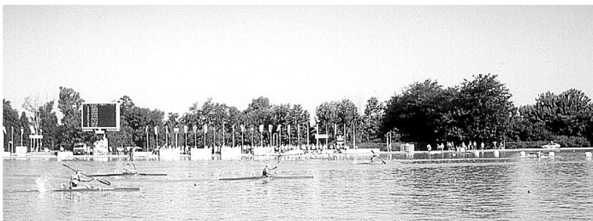
На чемпионате Европы