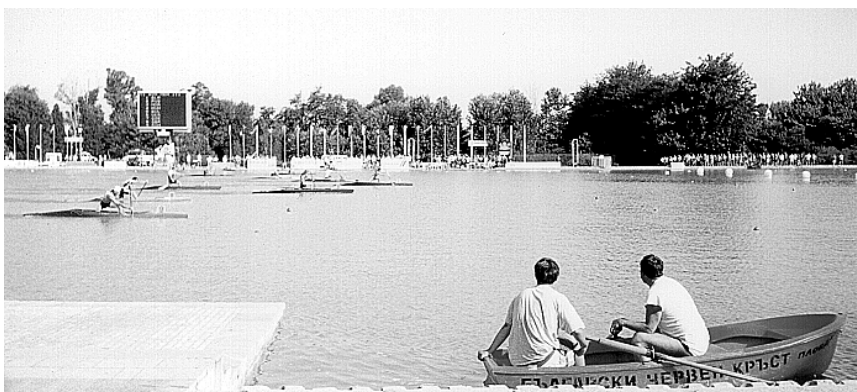
Старты в Пловдиве