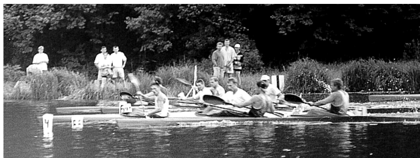
Чемпионат в Тернополе

В активе николаевцев – 4 серебряных и 4 бронзовых медалей.