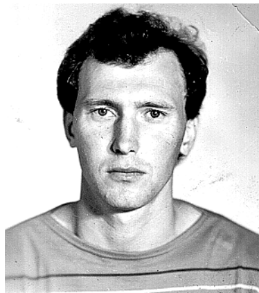
И.Гайдамака – двукратный чемпион мира