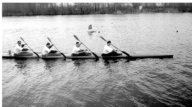
На чемпионате Украины в Днепропетровске